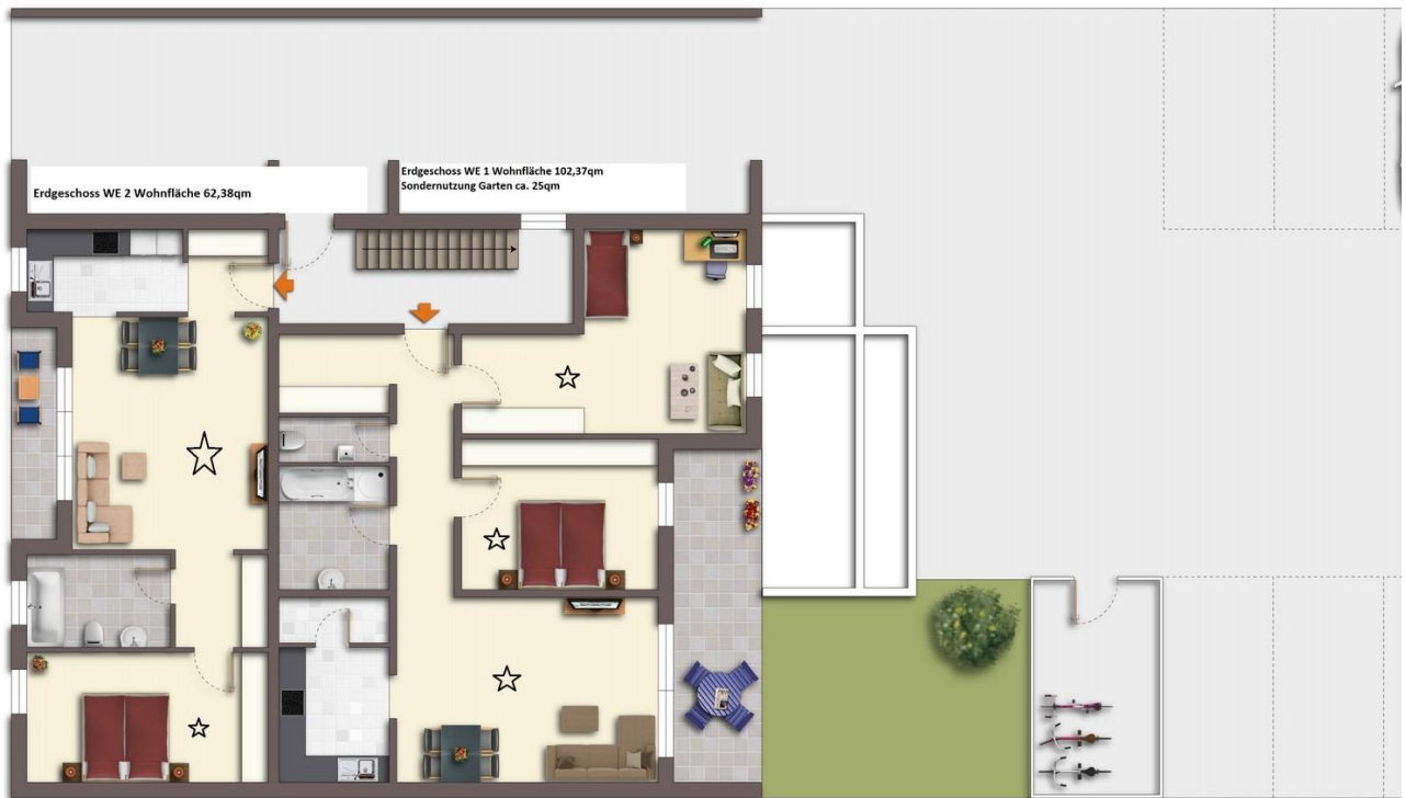
EG Wohnung ca. 102qm mit Garten