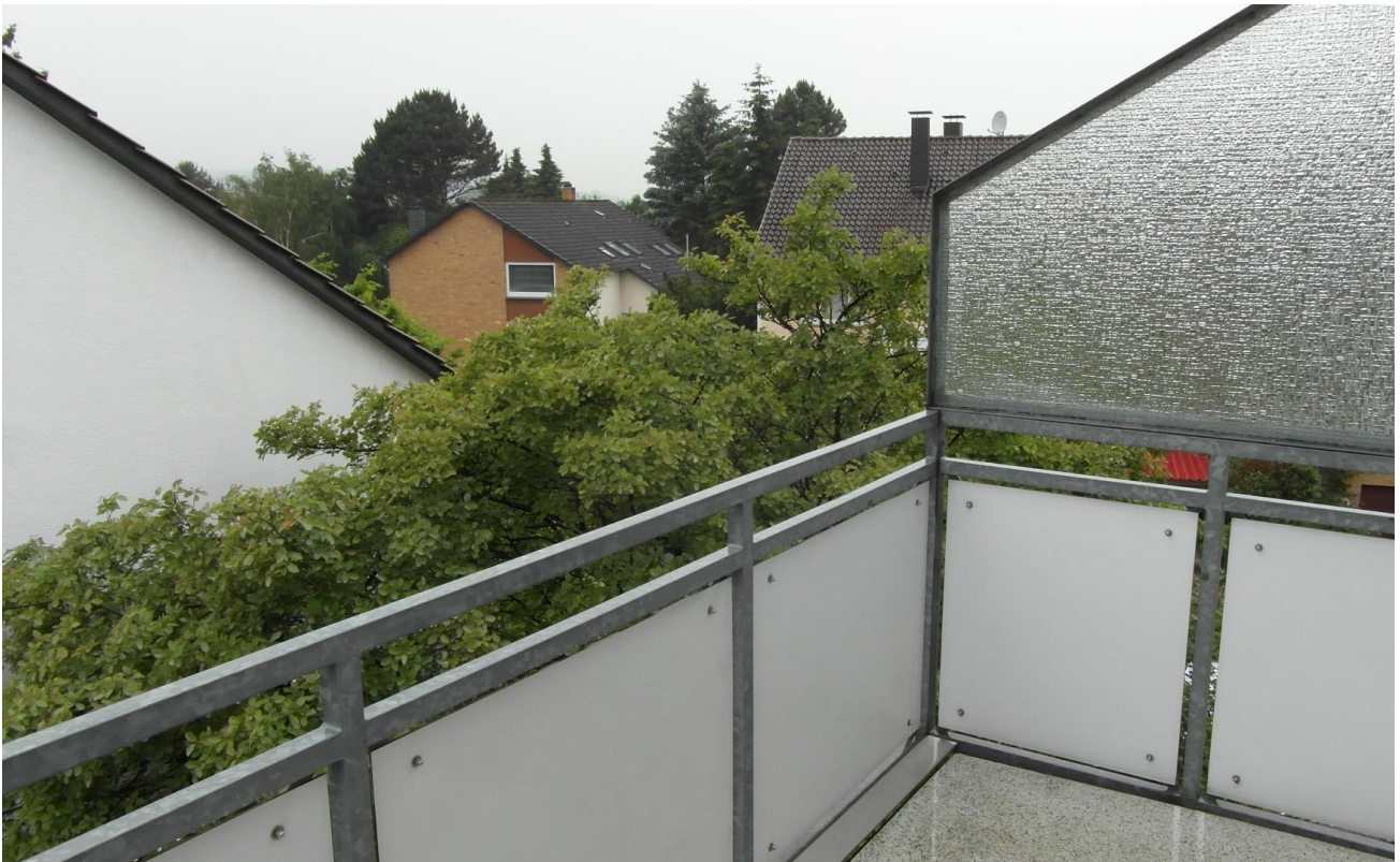
Ausblick Balkon DG