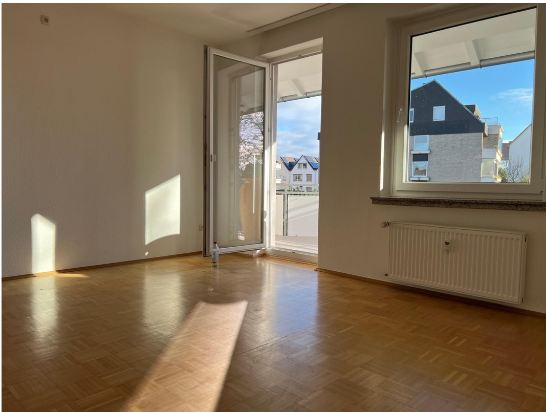
Schlafz. Ausg. Balkon (1.OG)