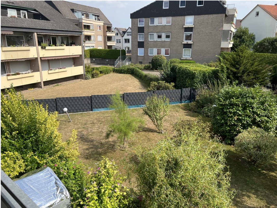
Garten, Blick 1. OG.