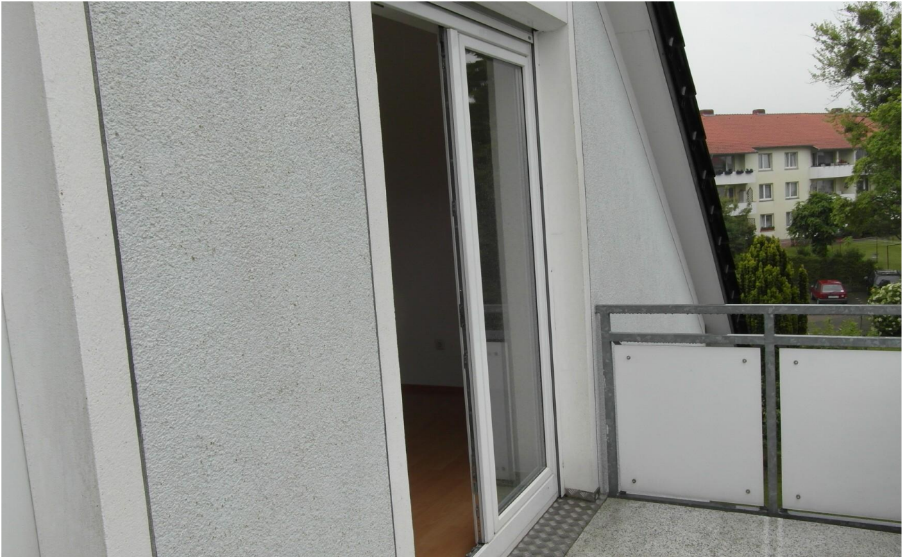
Ausgang Balkon DG