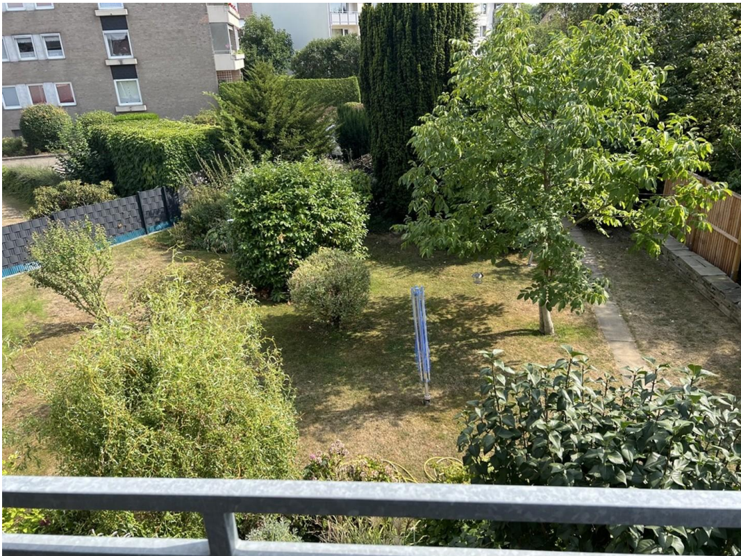
Garten, Blick 1. OG