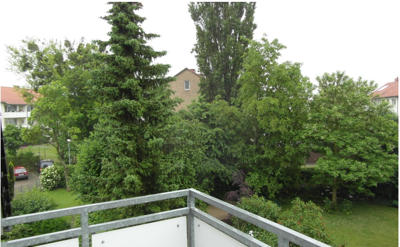
Ausblick vom Balkon DG