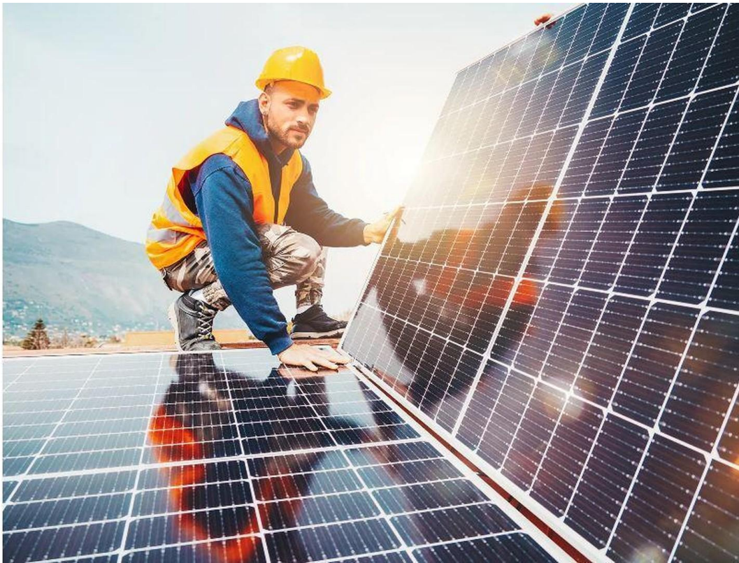
PV - Starteranlage