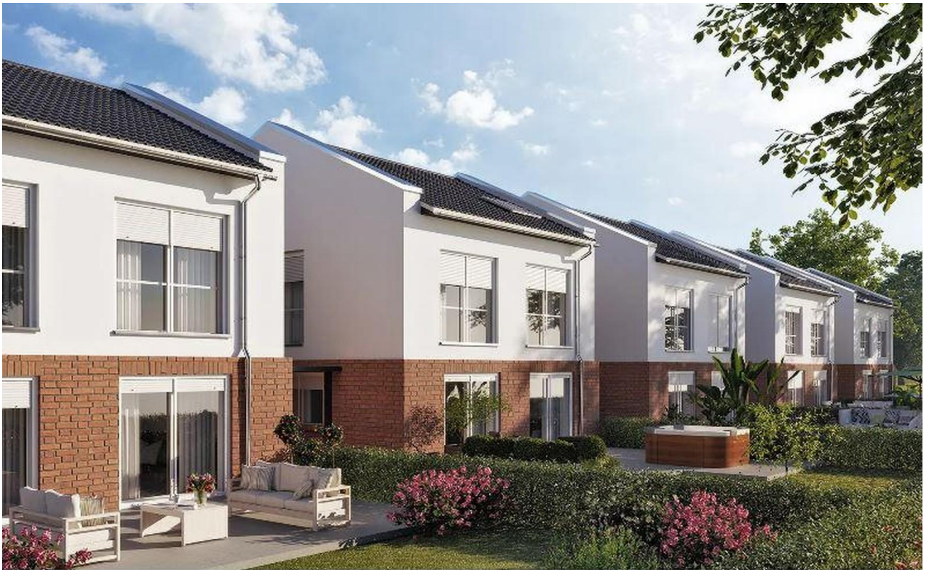
Extra Schutz d. elektr. Roll.