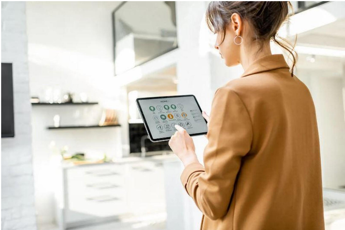
Smart Home Ready