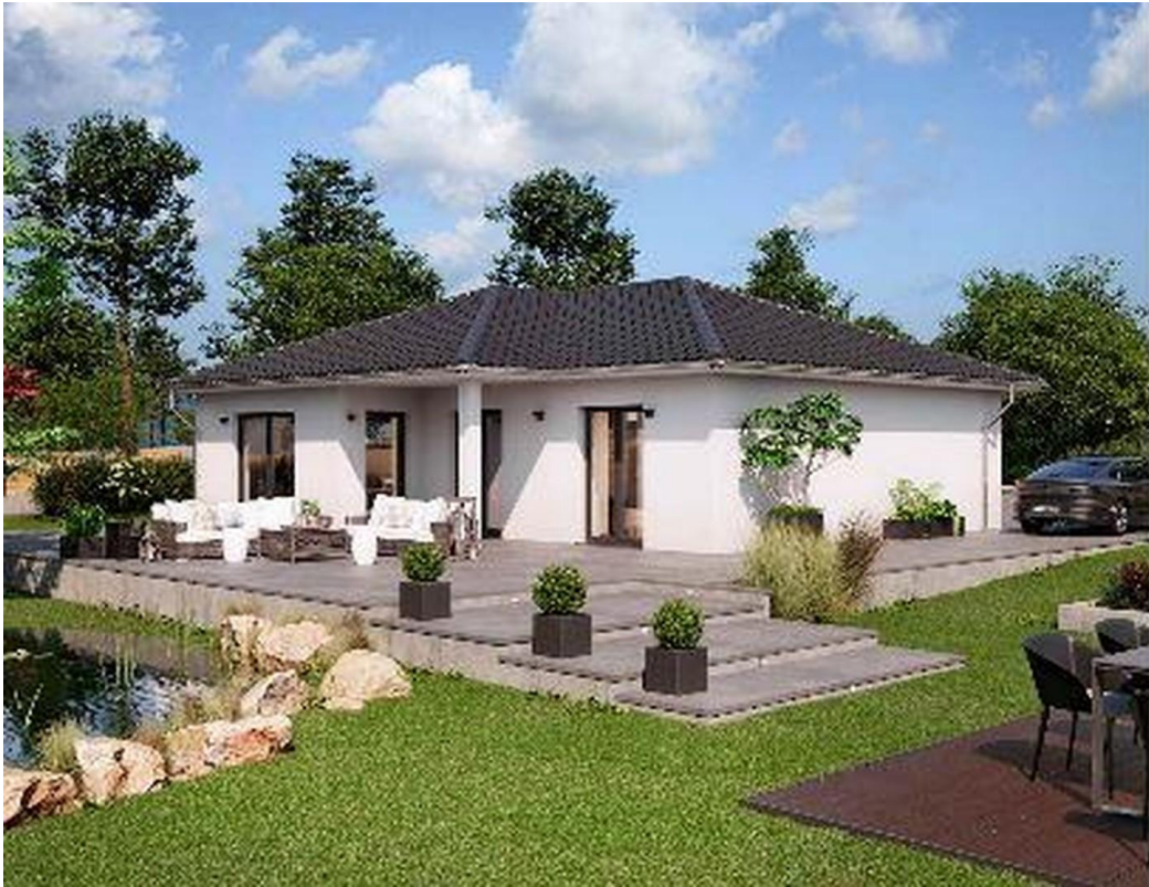
weitere Obj. auf Anfrage