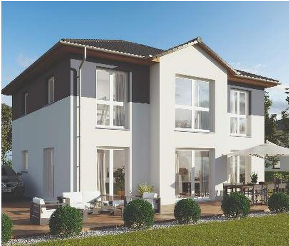
weitere Obj. auf Anfrage