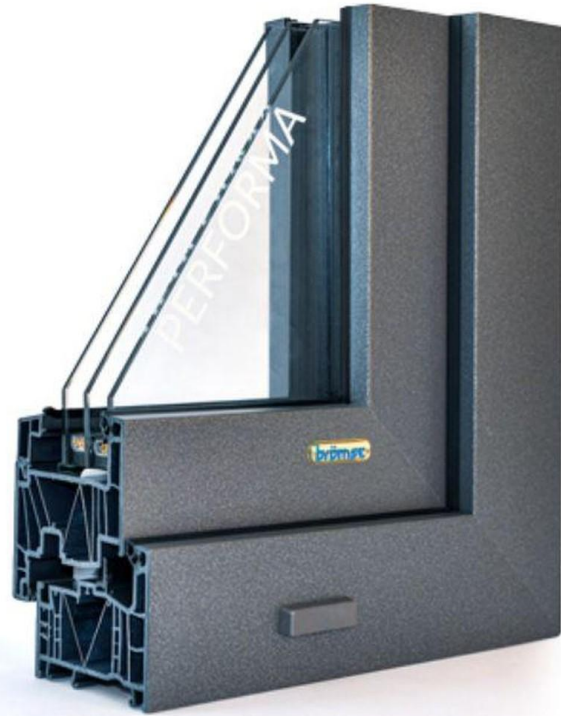
Safety First 3fgl. Fenster