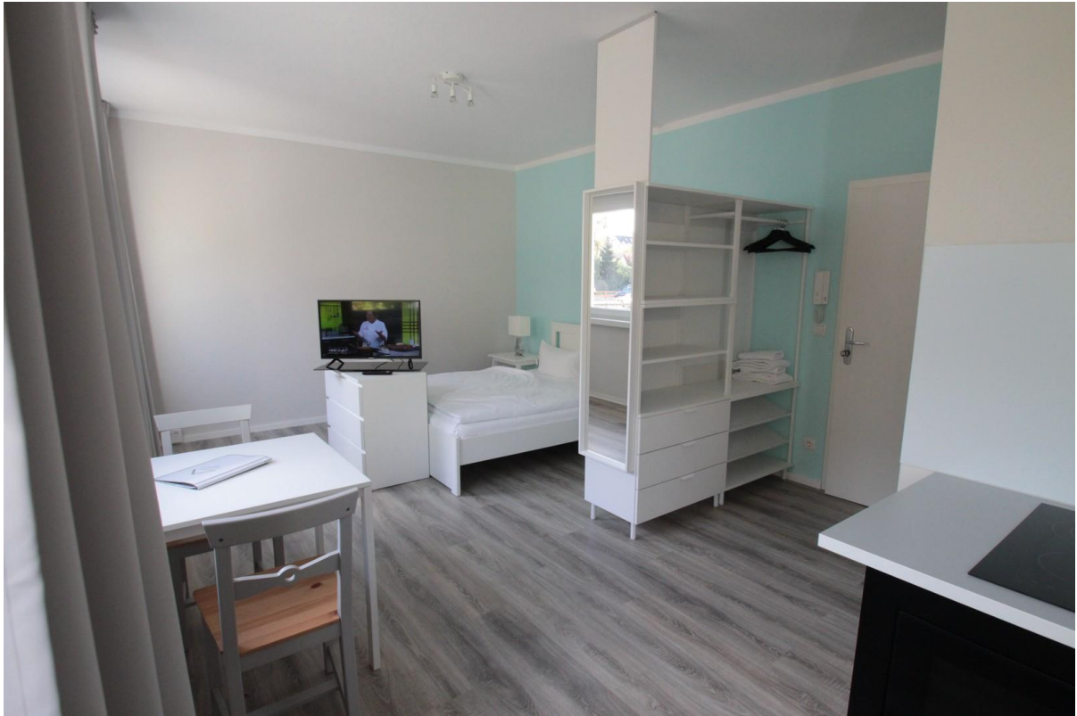
Wohnraum mit Küche, Beispiel