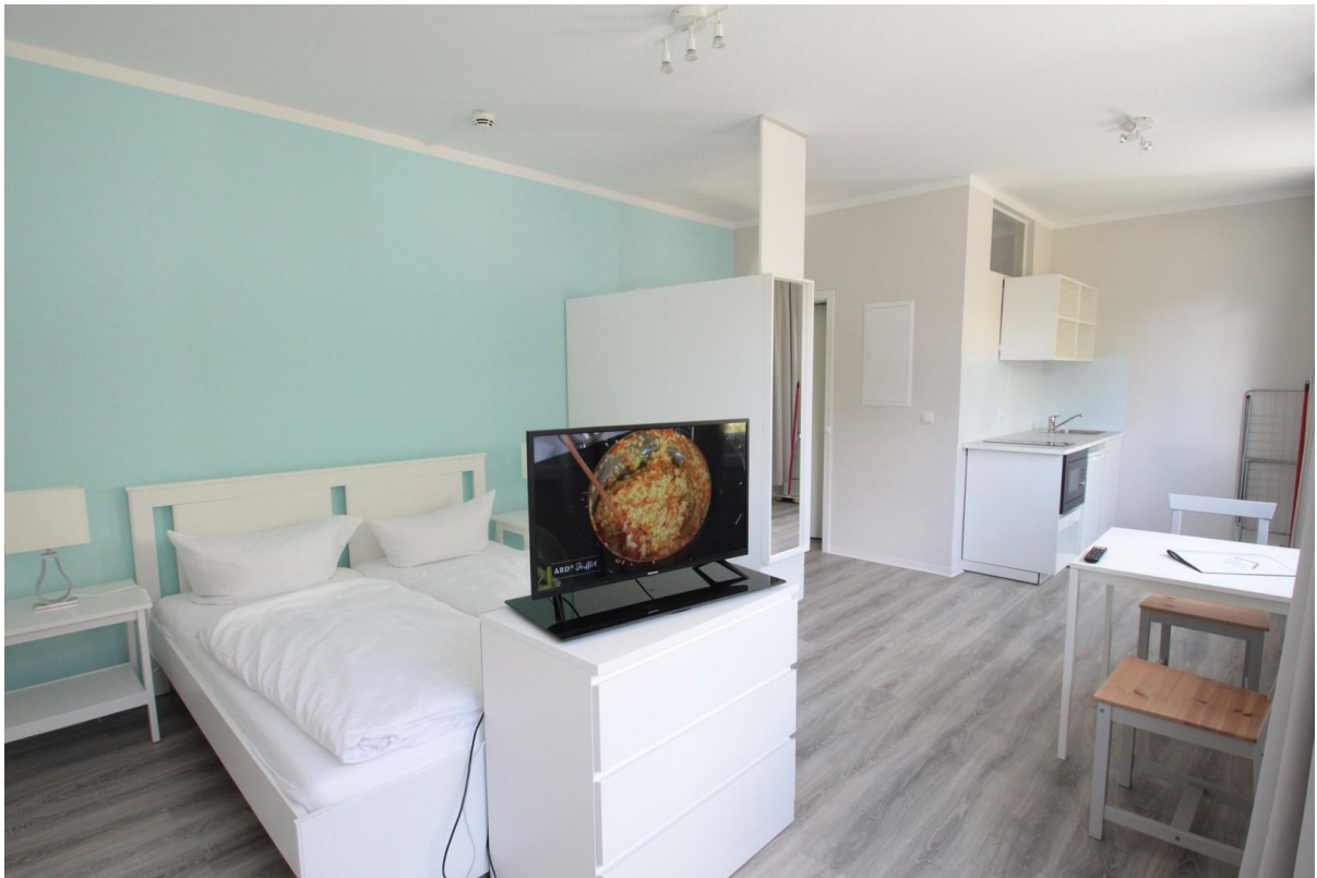
Wohnraum mit Küche, Beispiel