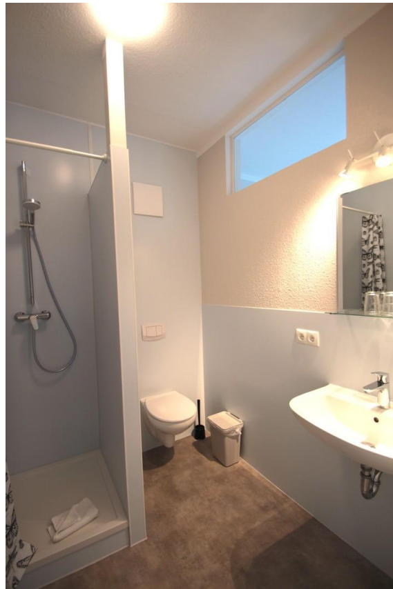
Duschbad mit WC