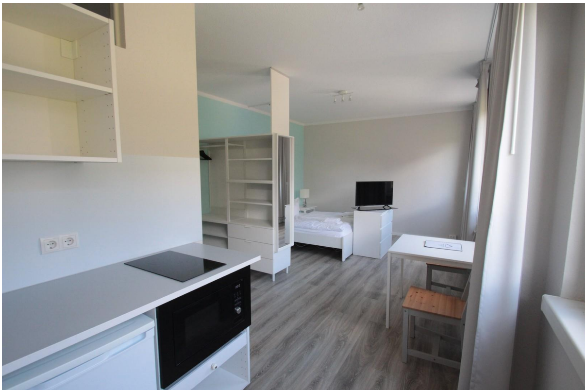
Wohnraum mit Küche, Beispiel