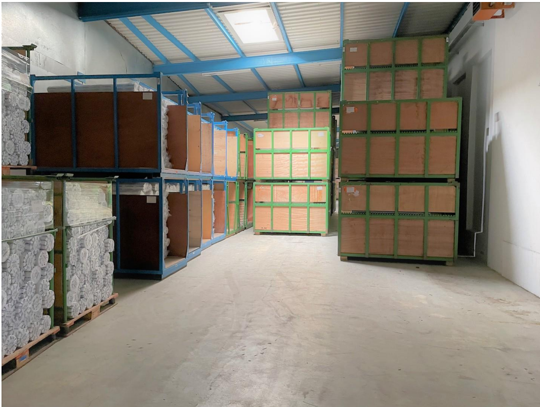
Bild Halle 6