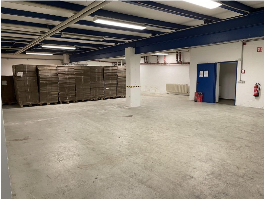
Bild Halle 1