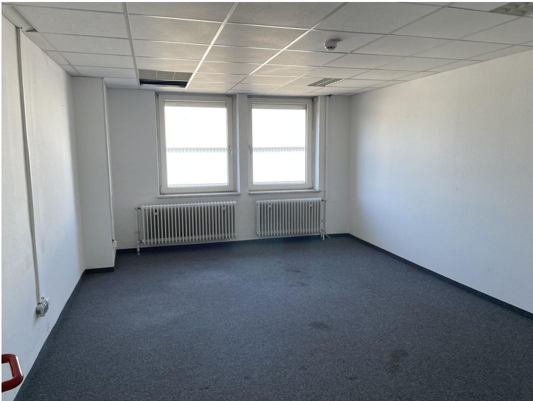
Bild Büro- und Sozialflächen 5