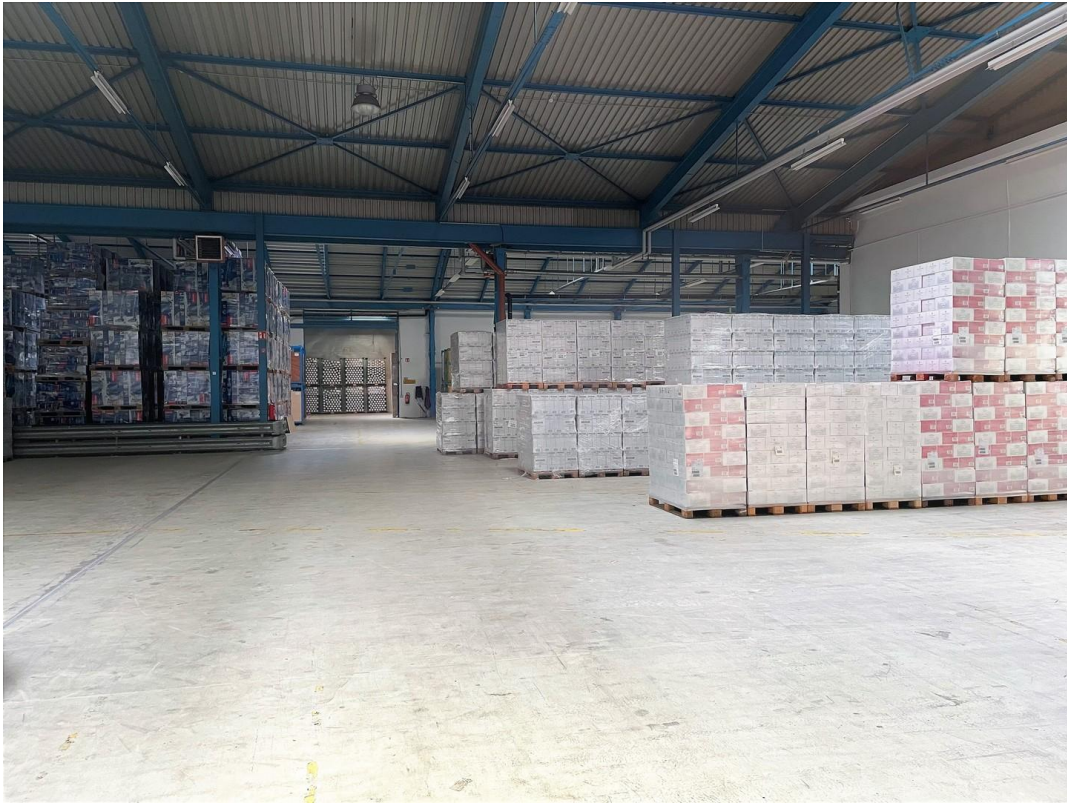
Bild Halle 3