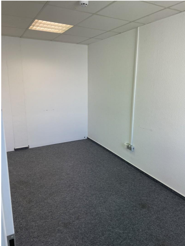
Bild Büro- und Sozialflächen 1