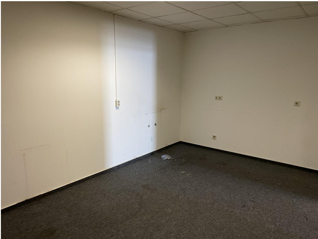
Bild Büro- und Sozialflächen 7