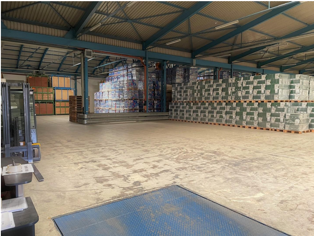
Bild Halle 4