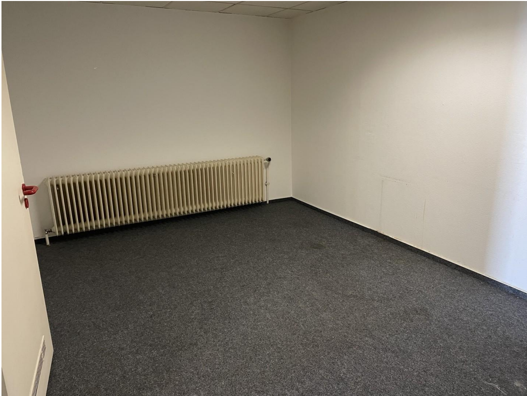
Bild Büro- und Sozialflächen 6