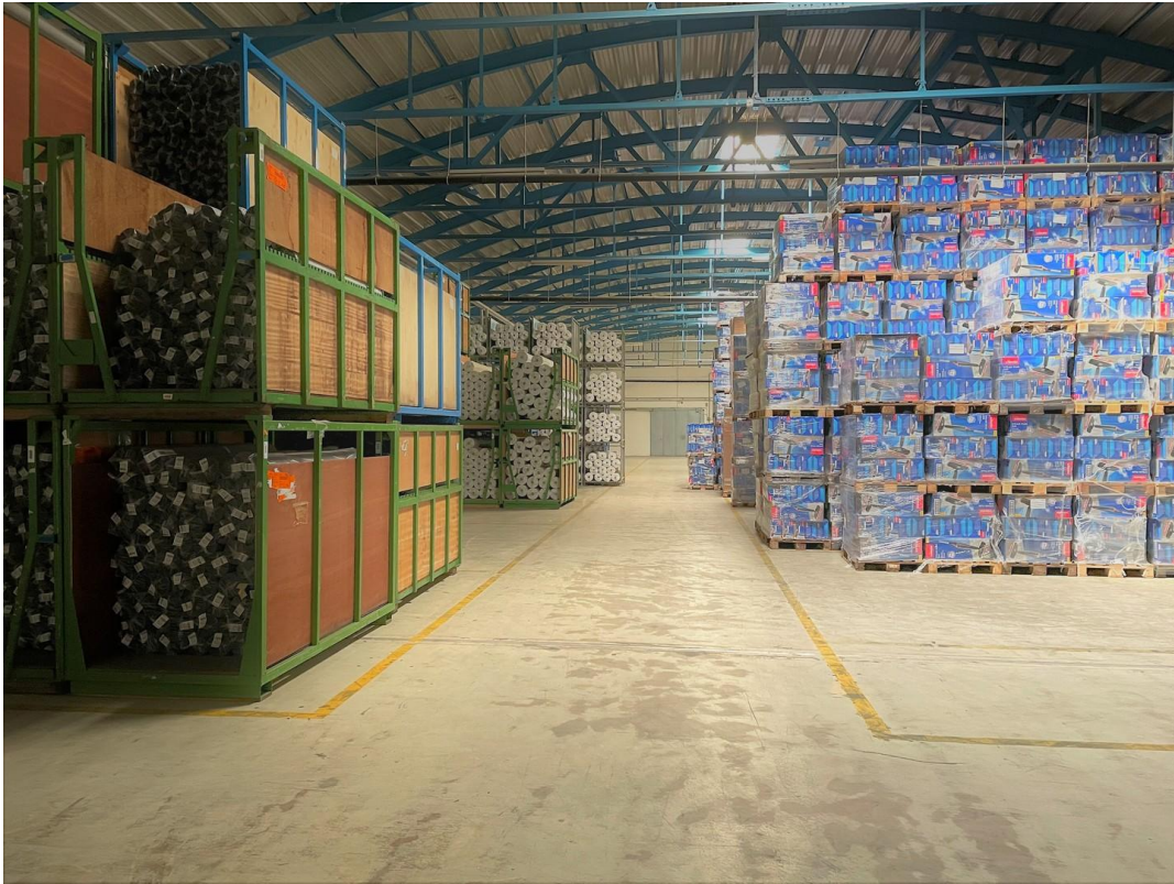
Bild Halle 5