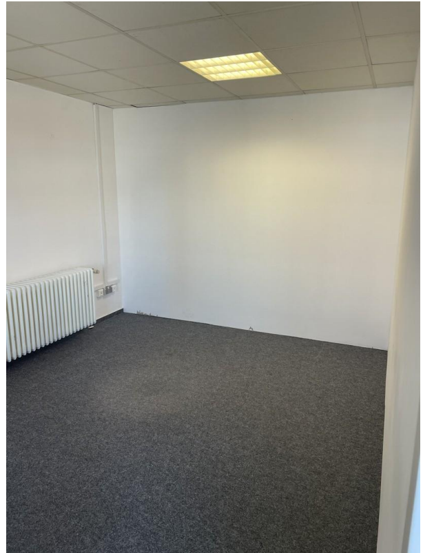
Bild Büro- und Sozialflächen 2