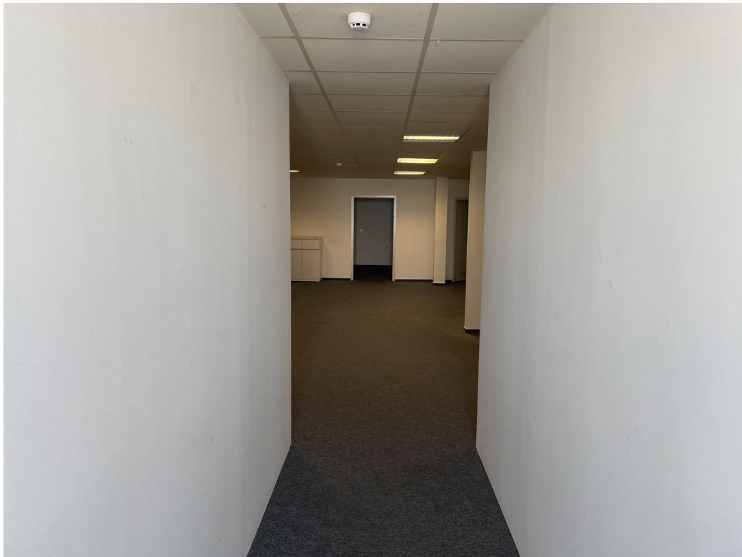
Bild Büro- und Sozialflächen 3