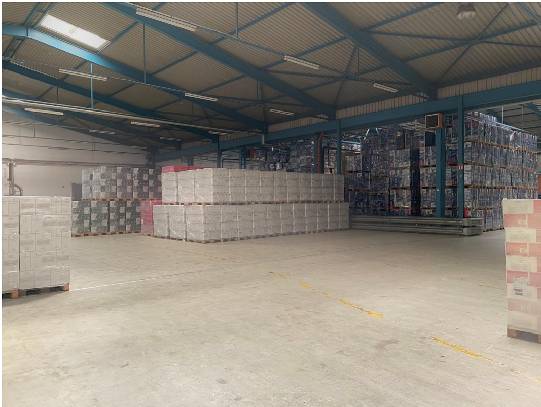
Bild Halle 2