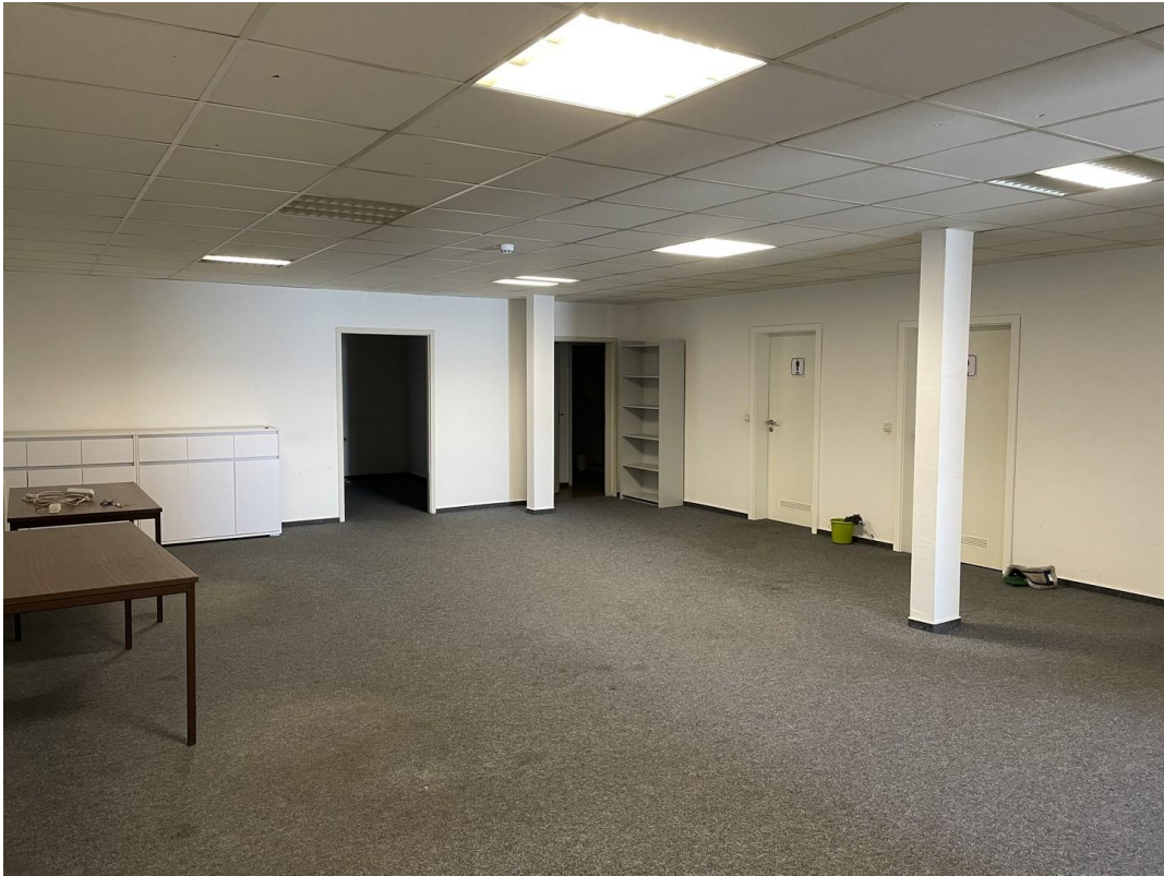
Bild Büro- und Sozialflächen 4