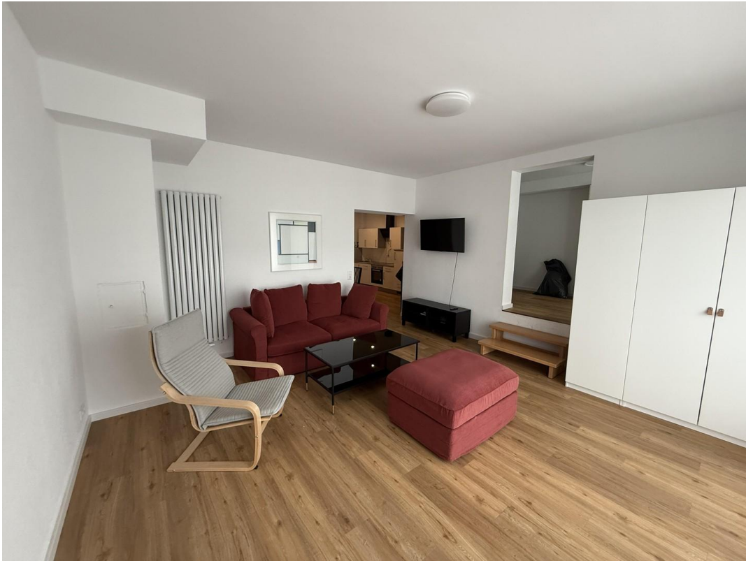
Blick in Richtung Küche