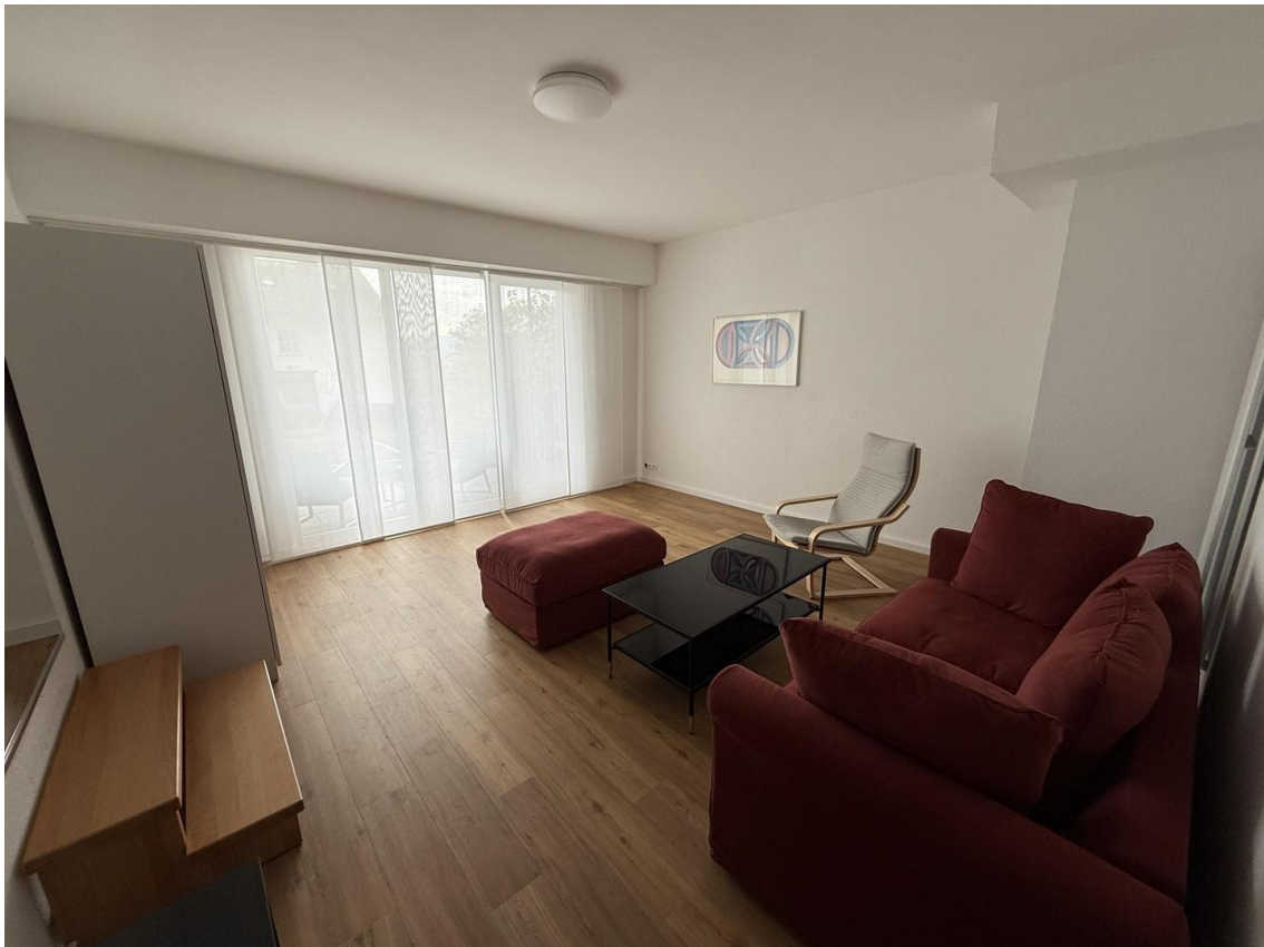
Blick von der Küche ins Wohnzi