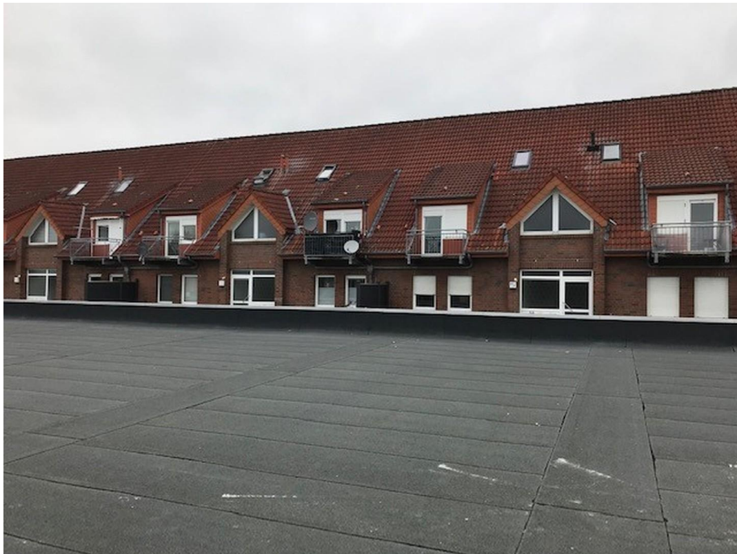
gesamtes Gebäude, Bild 1