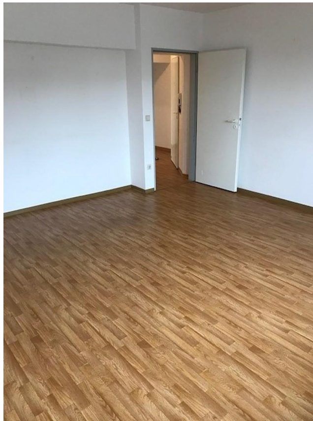
Wohnzimmer, Bild 2