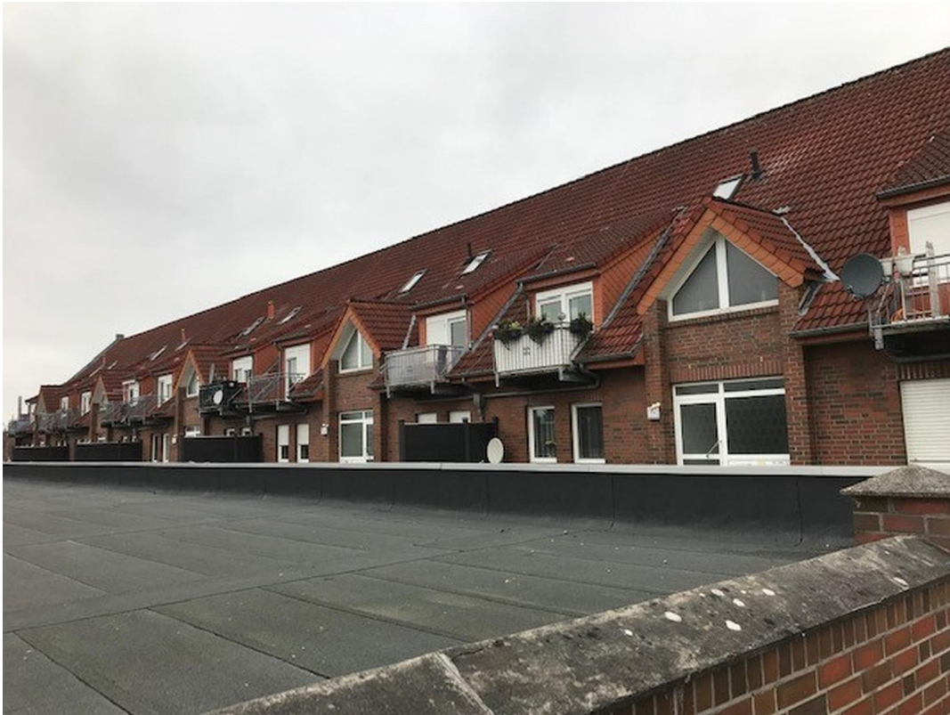
gesamtes Gebäude, Bild 2