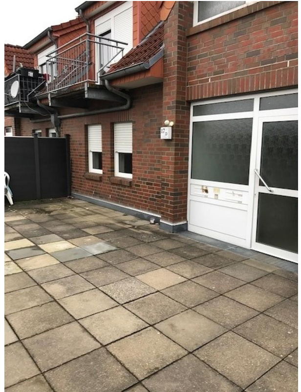
Außenansicht, Bild 2