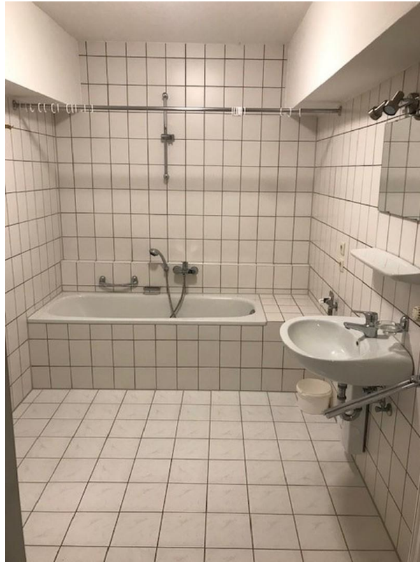
Badezimmer, Bild 1