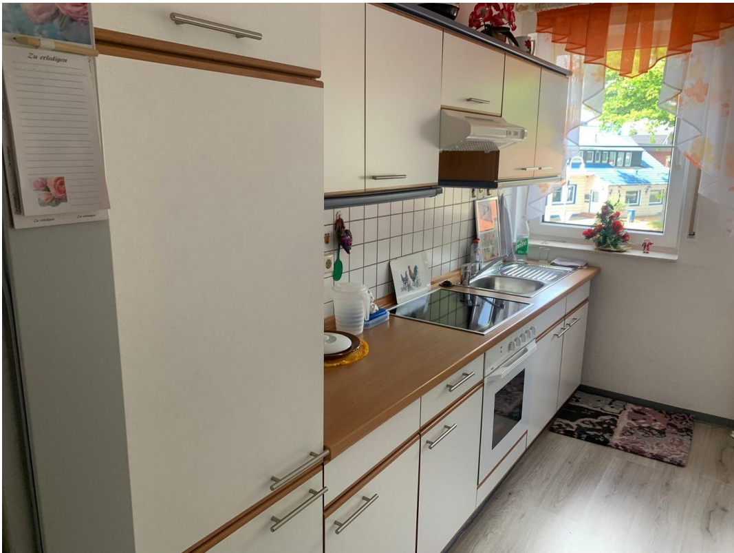
Küche, jedoch ohne EBK