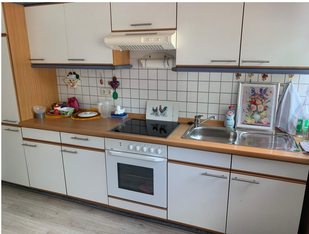
Küche, jedoch ohne EBK