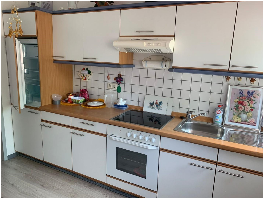
Küche, jedoch ohne EBK