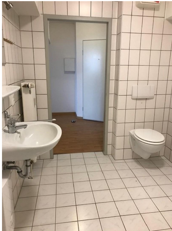
Badezimmer, Bild 2