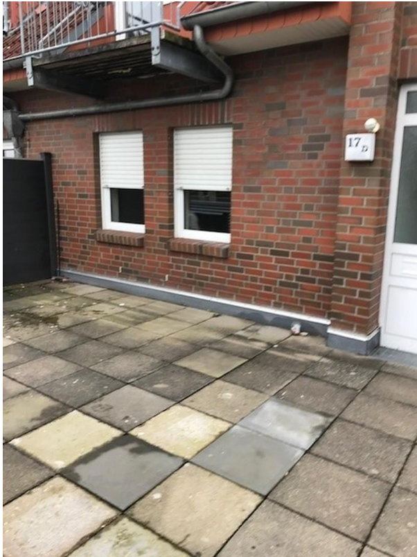
Außenansicht, Bild 1