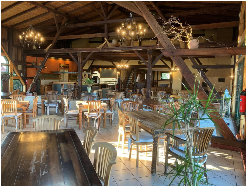
Blick Richtung Bar