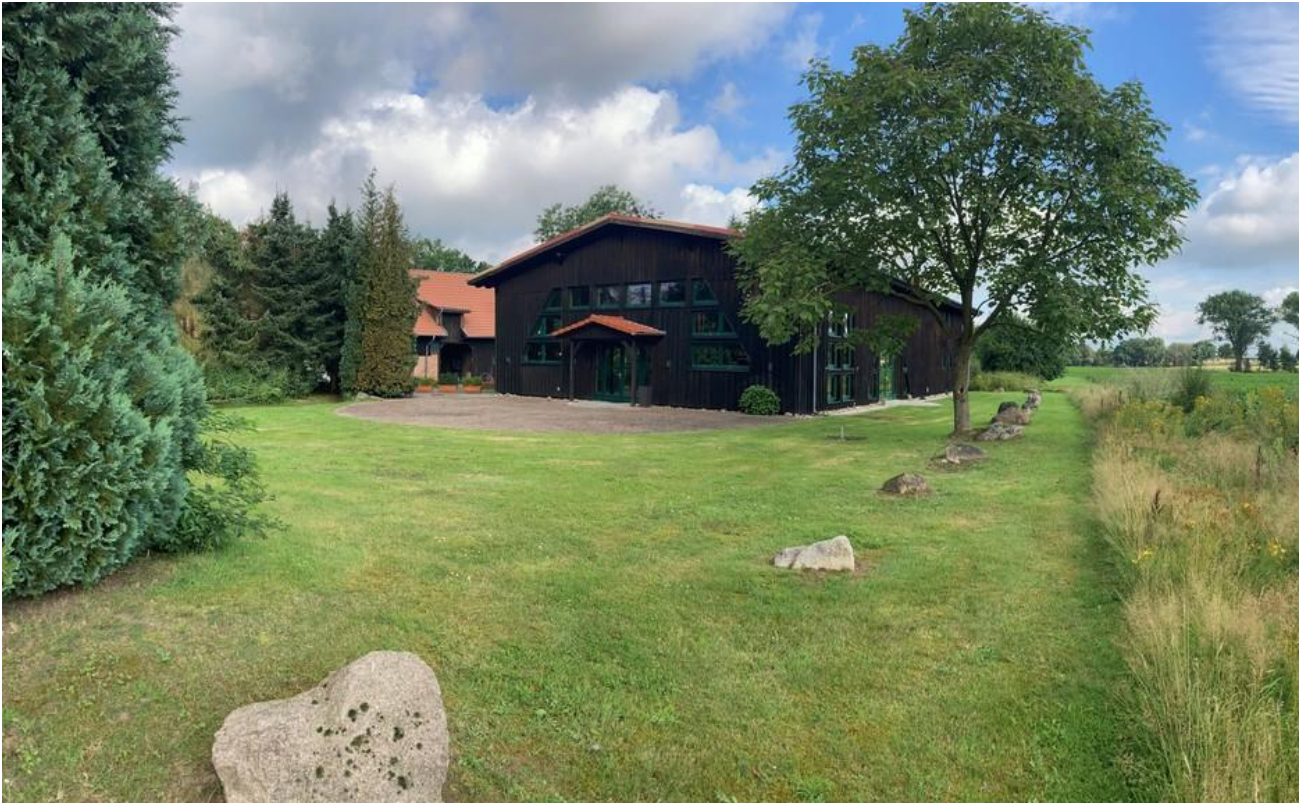
Terrasse und Ackergrundstück