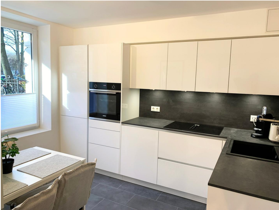
Küche Ansicht 1