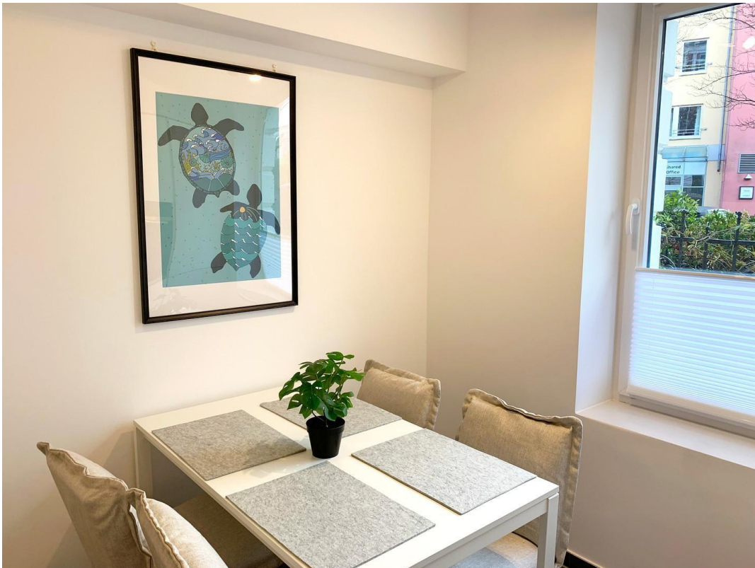
Küche Ansicht 2