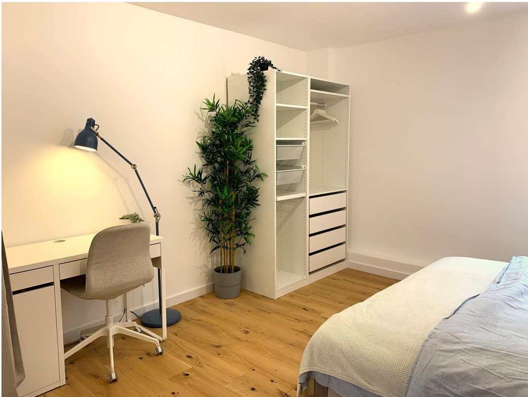
Schlafzimmer Ansicht 2