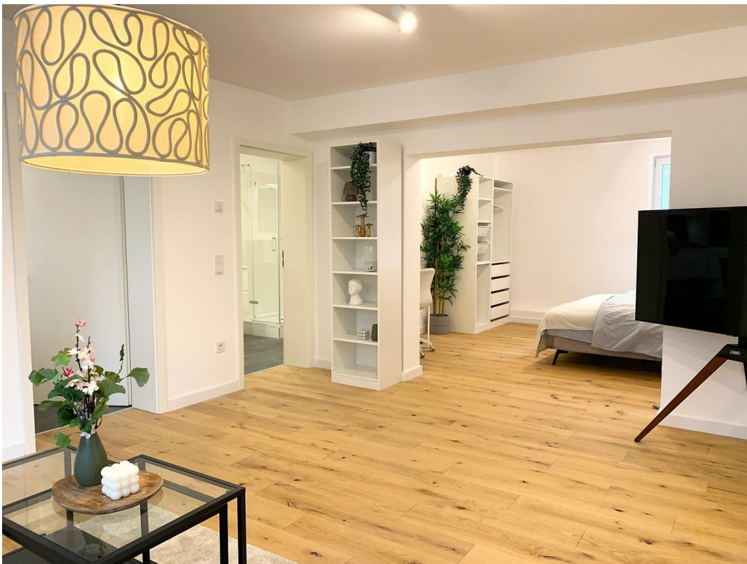
Wohnzimmer Ansicht 4