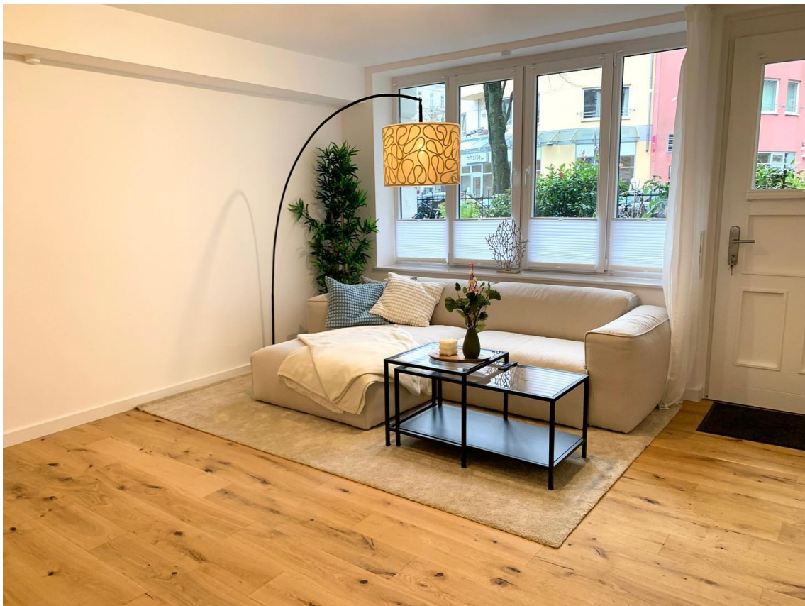
Wohnzimmer Ansicht 2