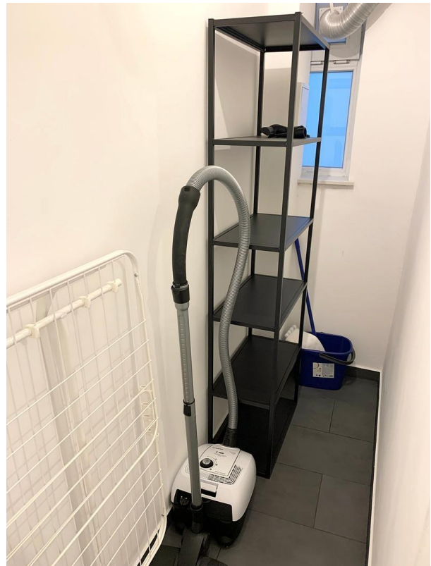
Abstellraum Ansicht 2