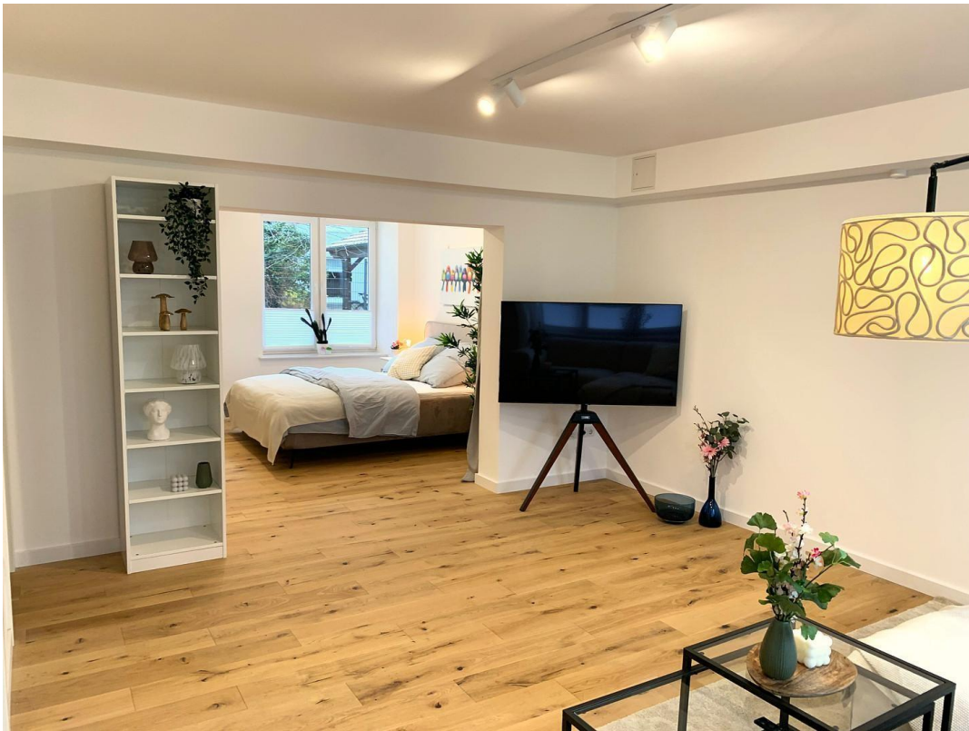
Wohnzimmer Ansicht 3