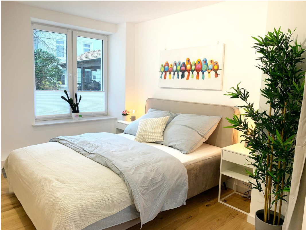
Schlafzimmer Ansicht 1