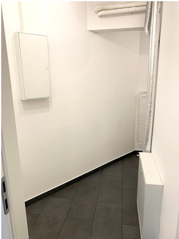
Abstellraum Ansicht 1