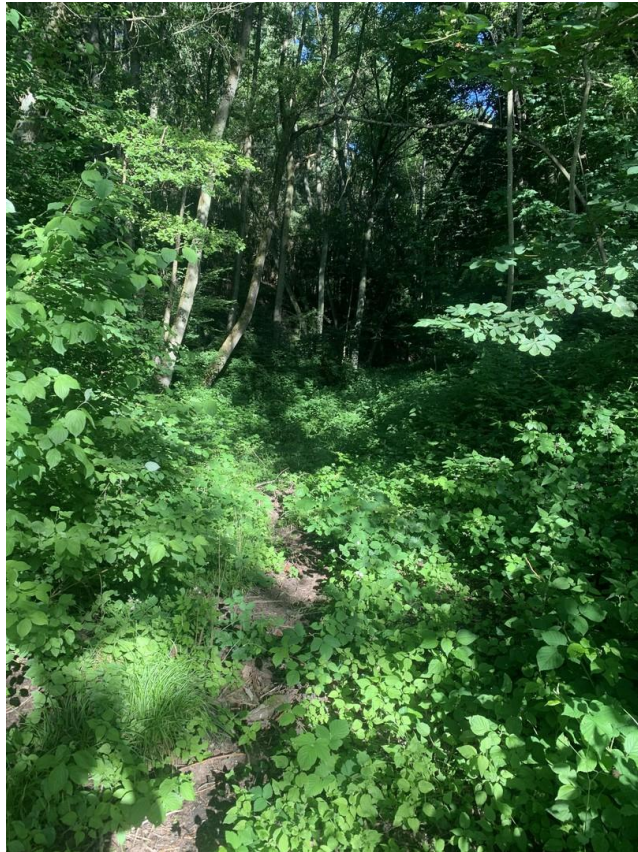
Weg in den eigenen Dschungel