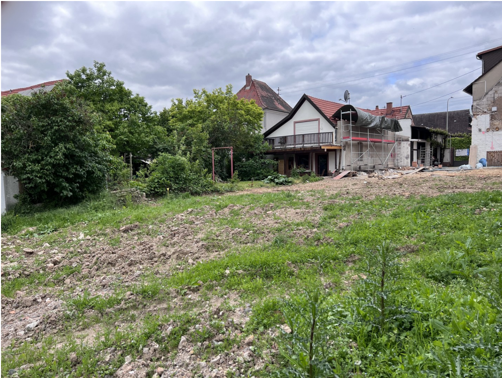
Blick von Ost nach West