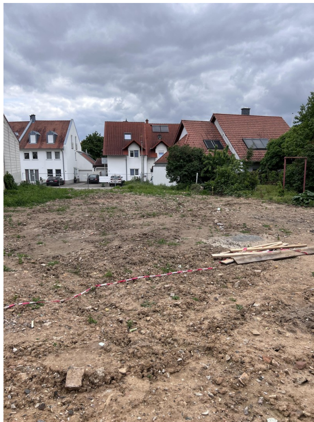
Blick von West nach Ost