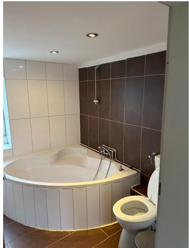
EG Bad mit Wanne