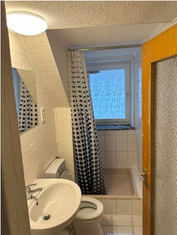
DG Bad mit Dusche