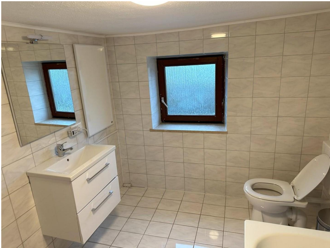
OG Bad mit Wanne