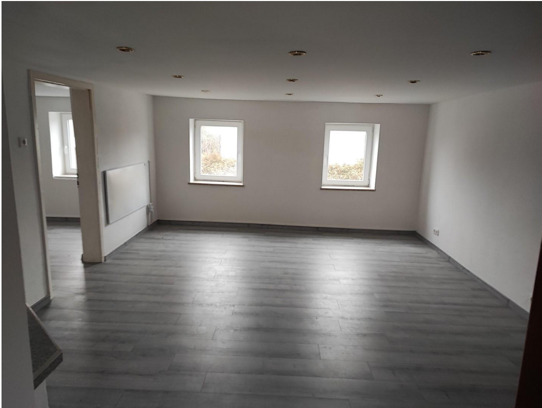
OG Wohnen mit Kamin