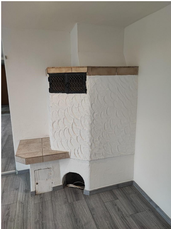
Kamin EG Schlafen