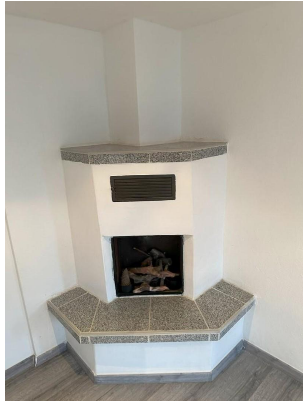
Holzöfen auf allen Ebenen