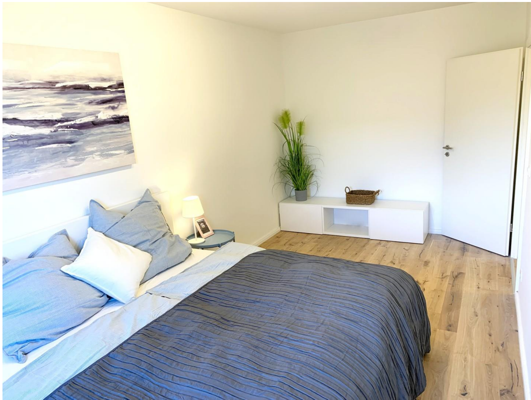
Schlafzimmer Ansicht 2