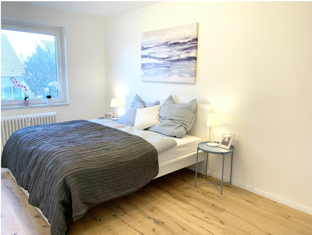
Schlafzimmer Ansicht 1