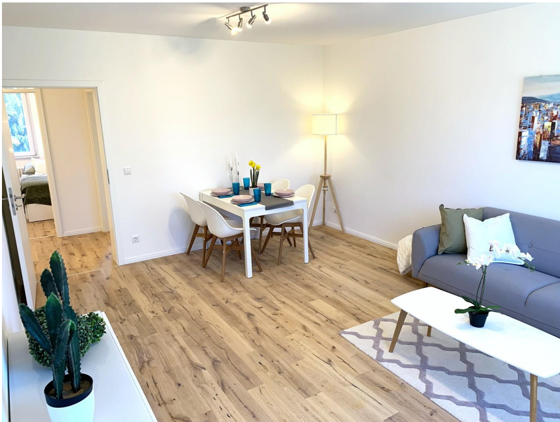
Wohnzimmer Ansicht 2