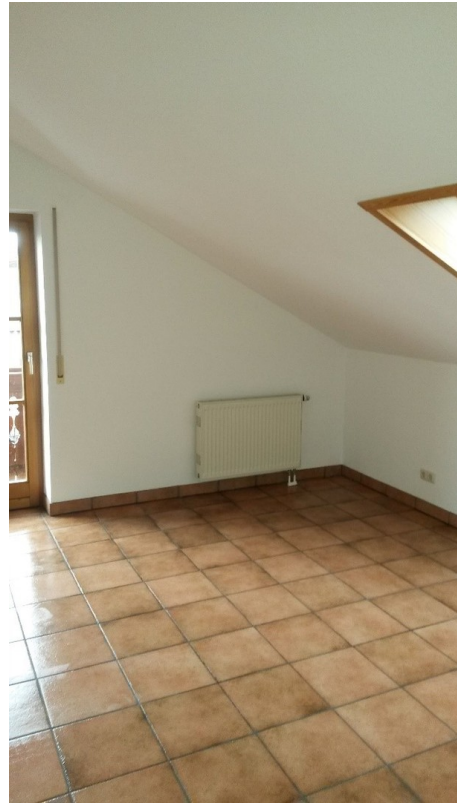
Zimmer Nordseite Zugang Balkon