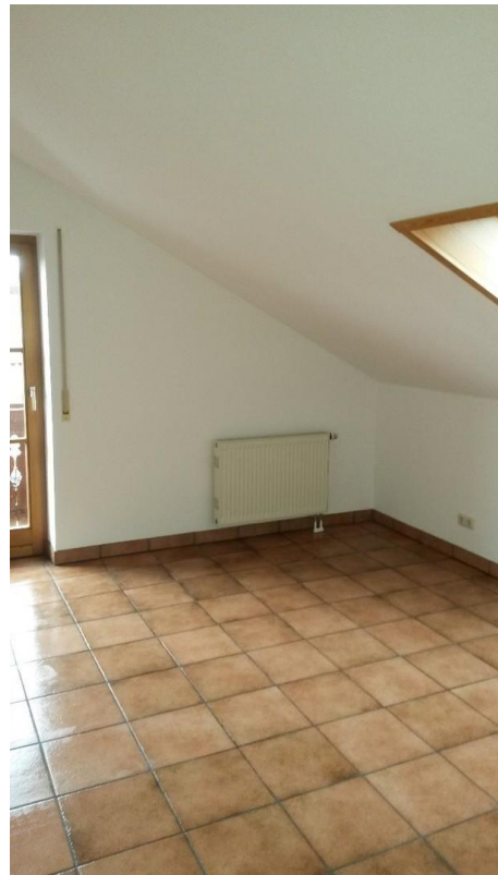
Zimmer Nordseite Zugang Balkon