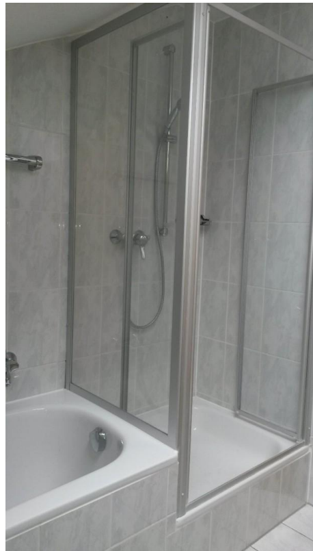
Dusche / Badewanne