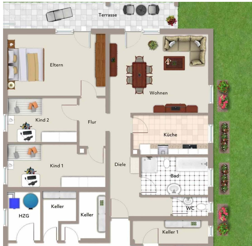
Plan mit Möbel-Beispiel