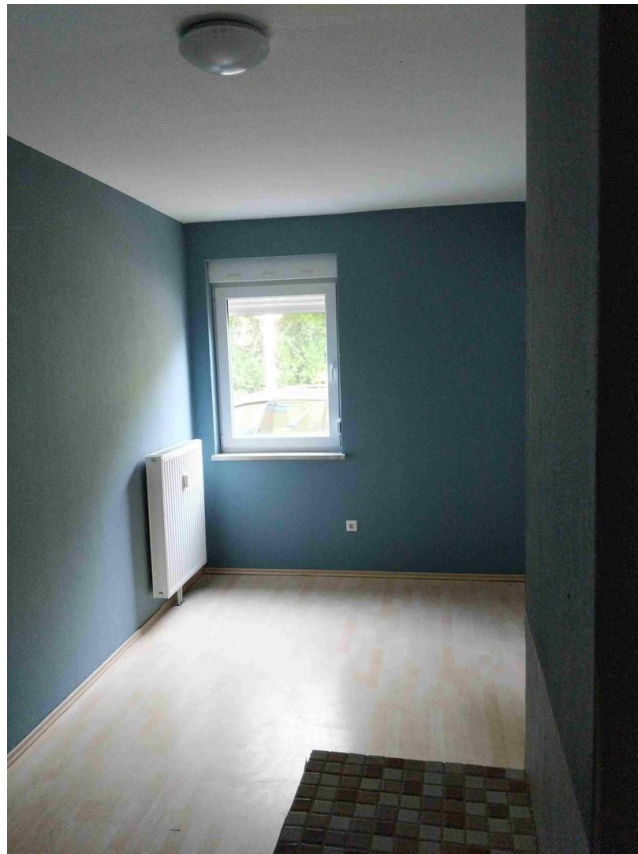
mittleres Schlafzimmer (2)