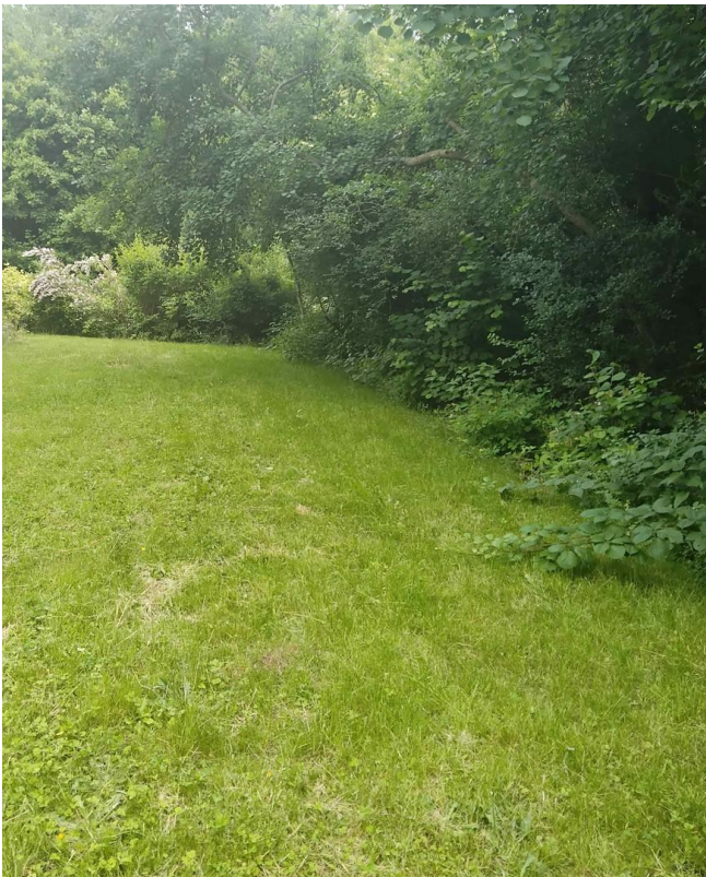
Rasen im Süden