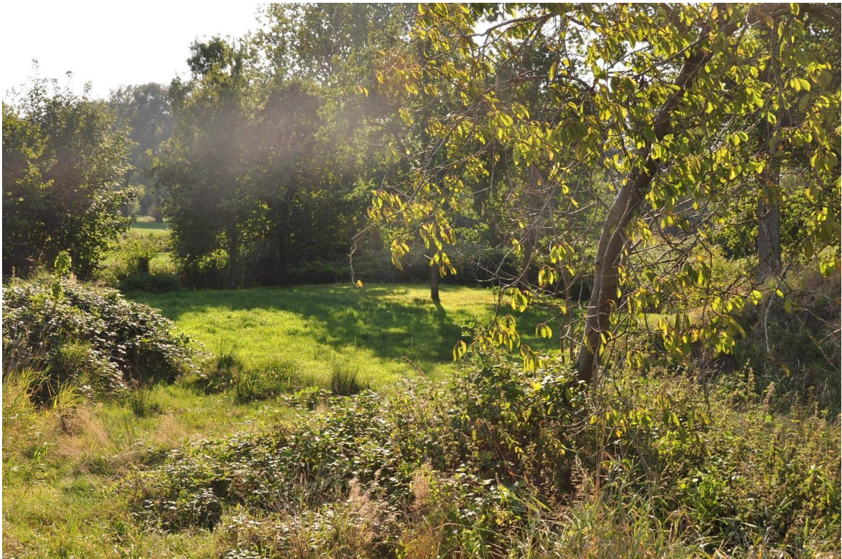
Bauplatz mitten im Grünen