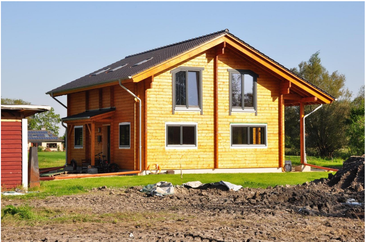
Blockhaus auf № 17 a