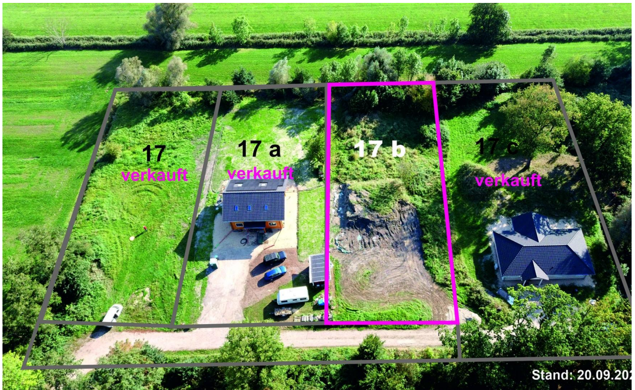
Blick nach Süden