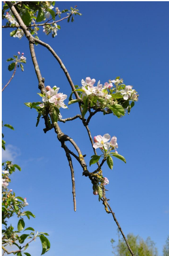
Obstbaum in Blüte