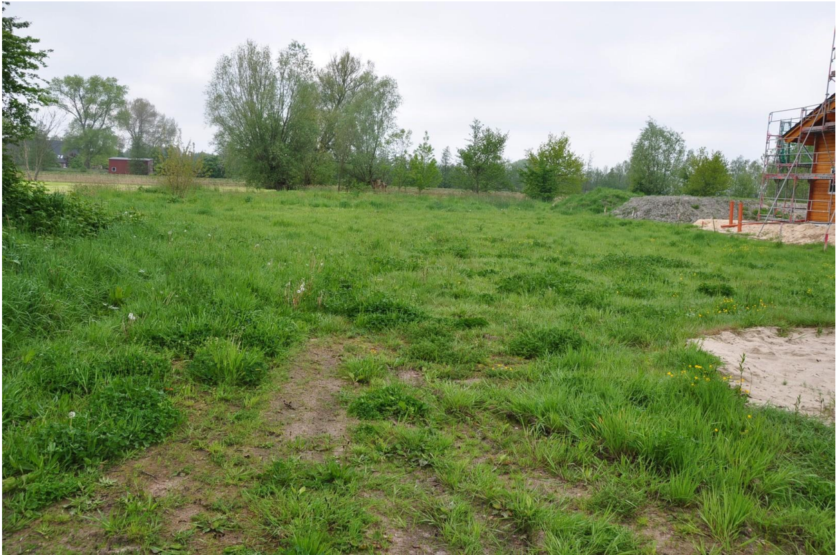
Hier könnte Ihr Haus stehen