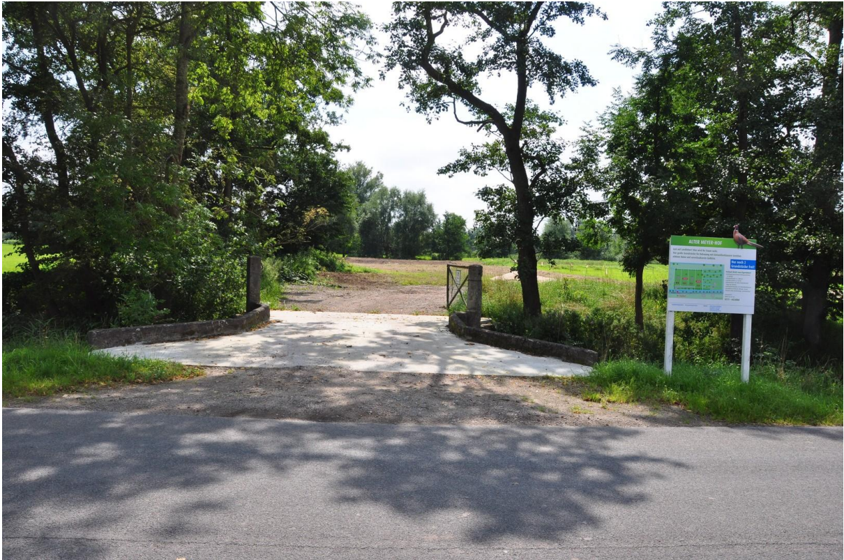
Zufahrt über die Wetternbrücke