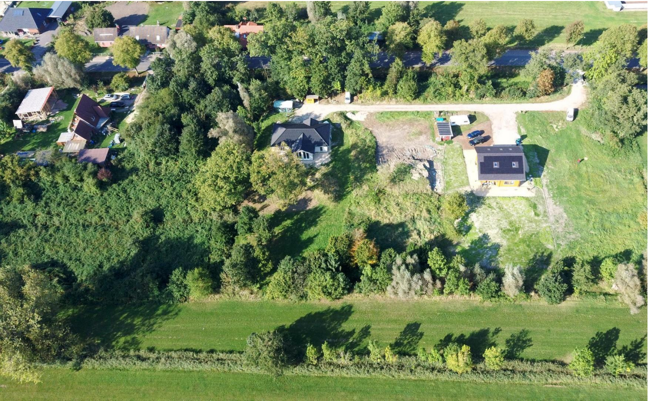
Blick nach Norden