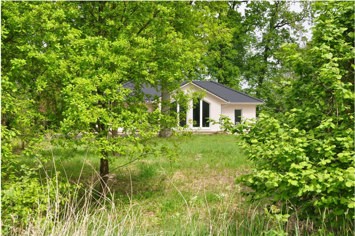
Bungalow auf № 17 c