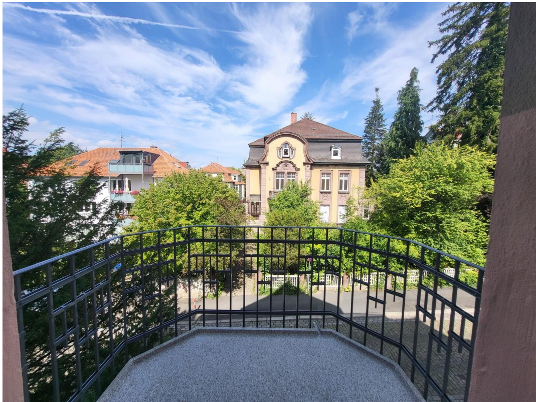
Zimmer 1, Balkon