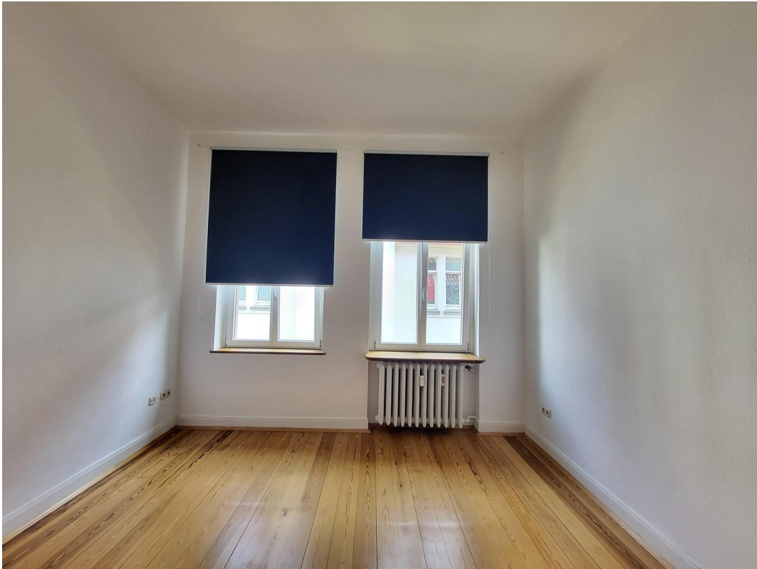
Zimmer 3, Verdunkelungsrollo