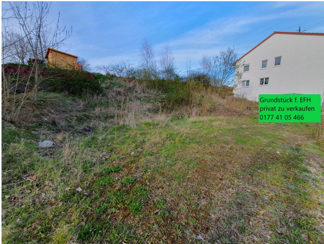
Ausblick Richtung Norden