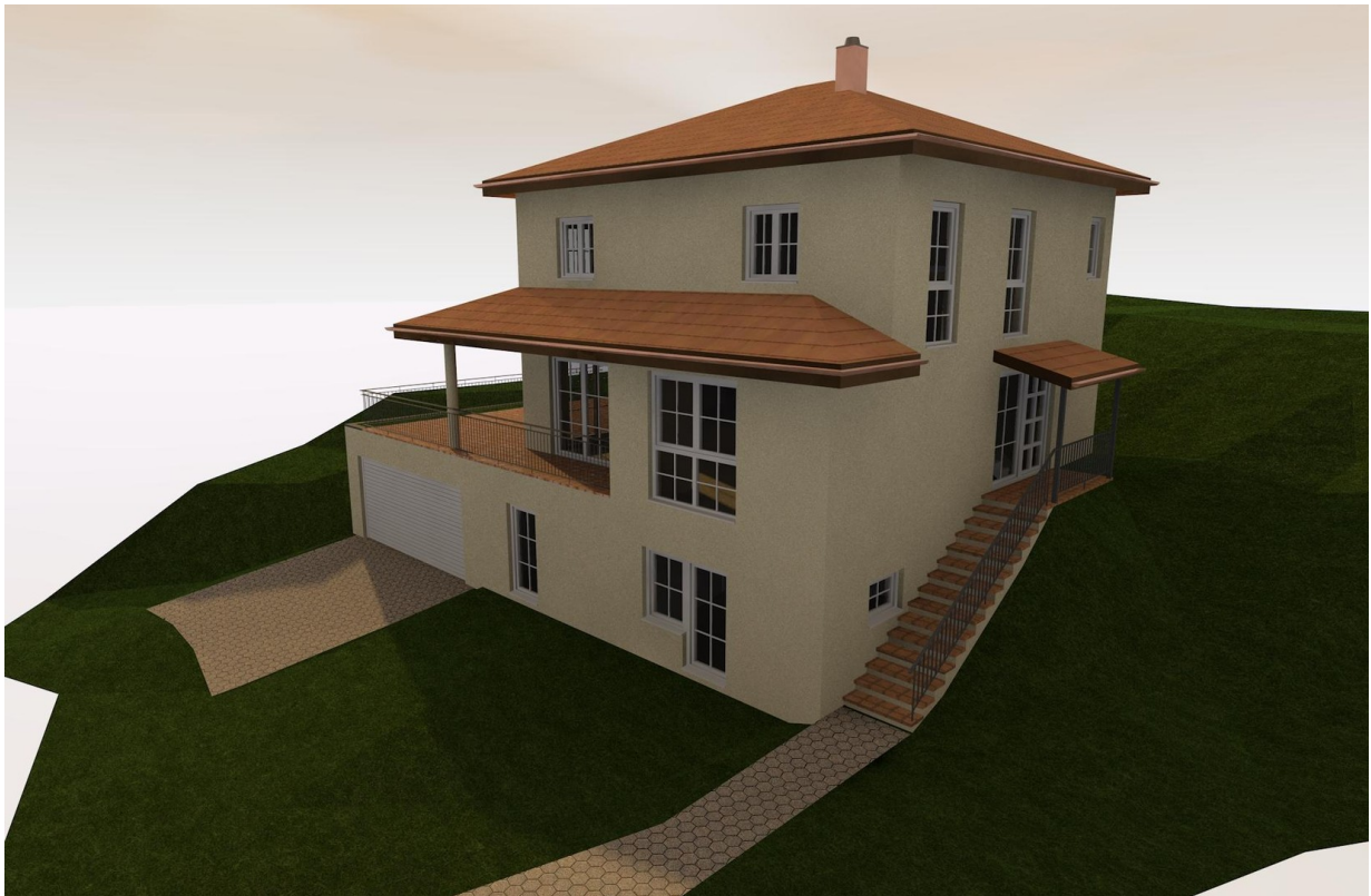
Beispielhaus SO Ansicht