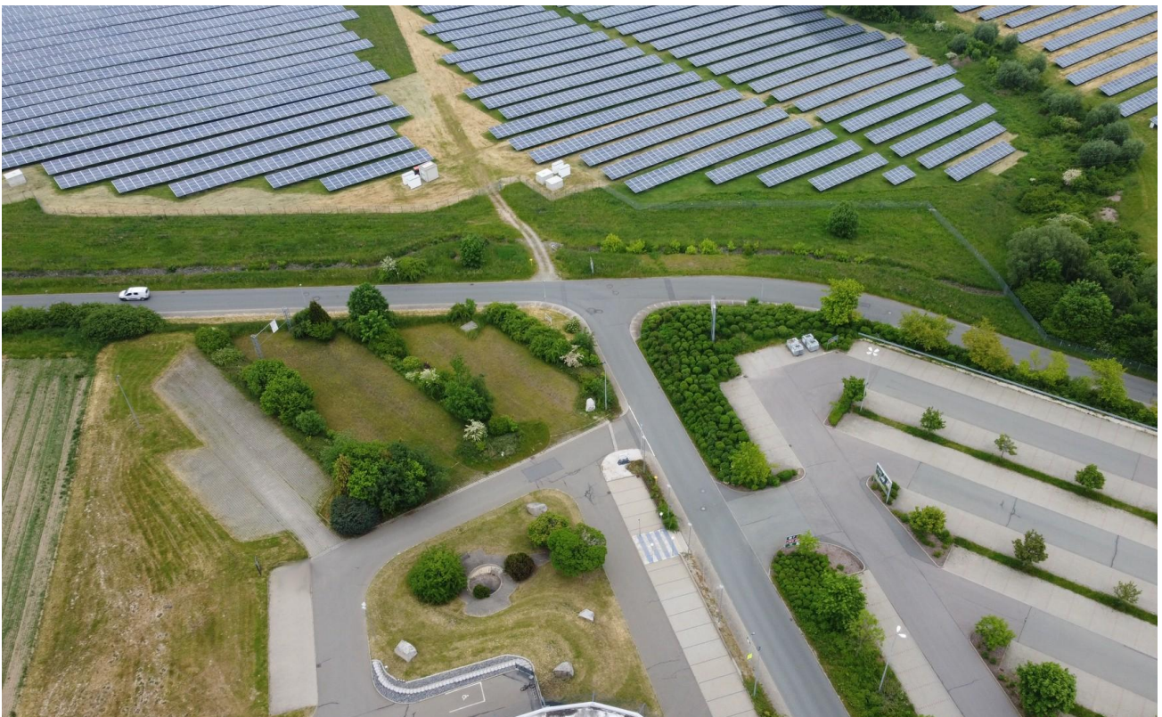
Schrägsicht mit Zufahrten