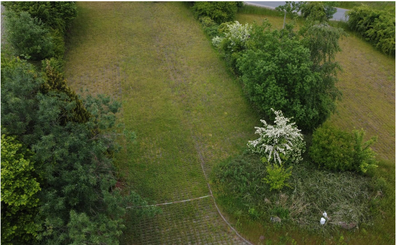
Flächen 2 und 3