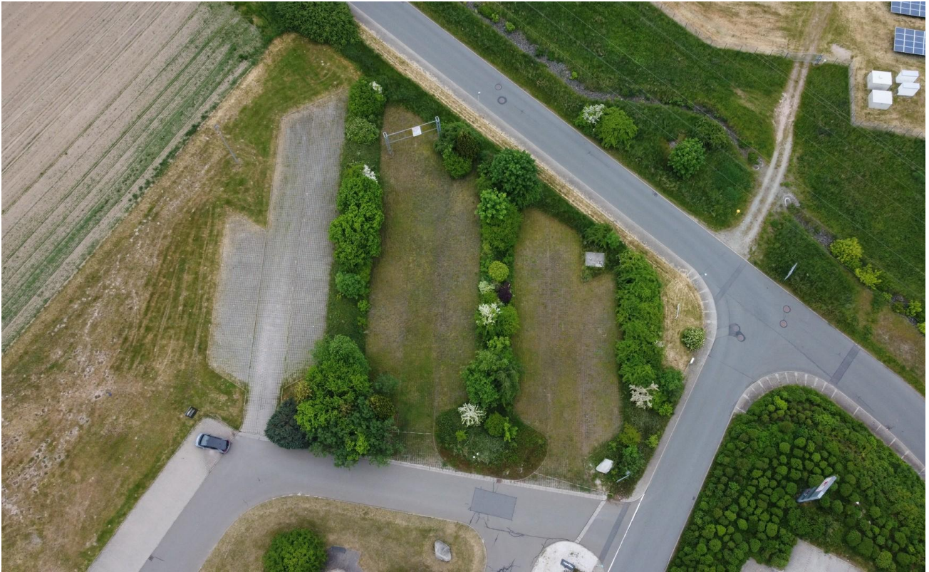
Draufsicht mit Umgebung