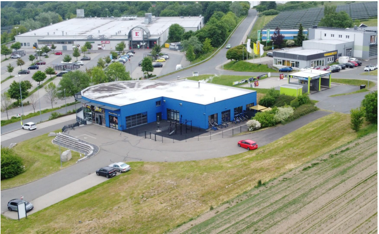
Einordnung im Gewerbegebiet