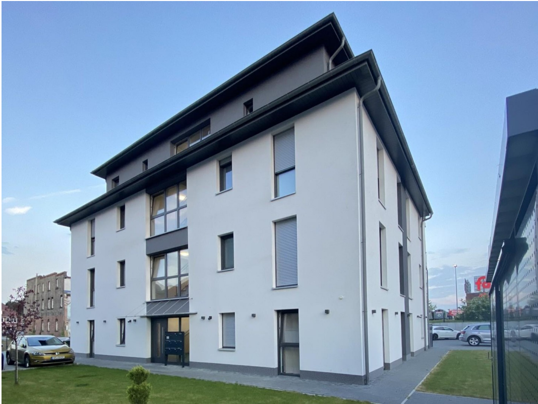
Ansicht Außen 2