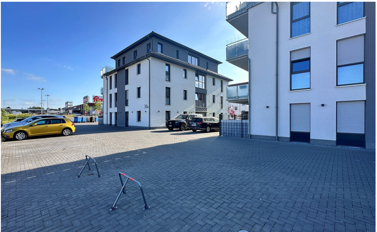
Ansicht Außen 3