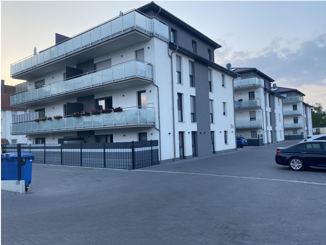
Ansicht Außen 4