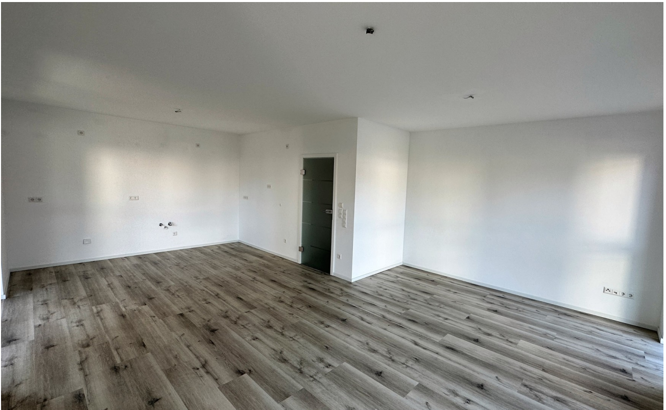
Wohnbereich mit Küche