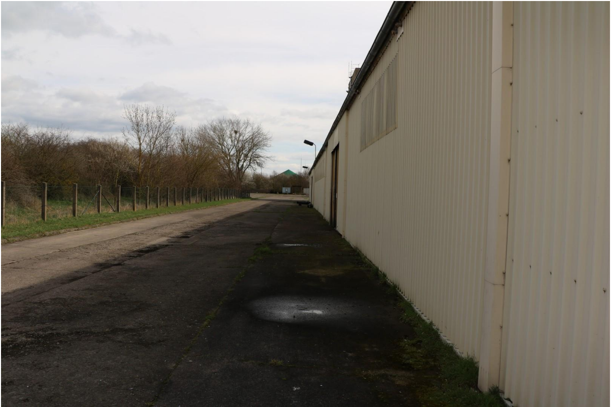
Freigelände entlang Halle 1