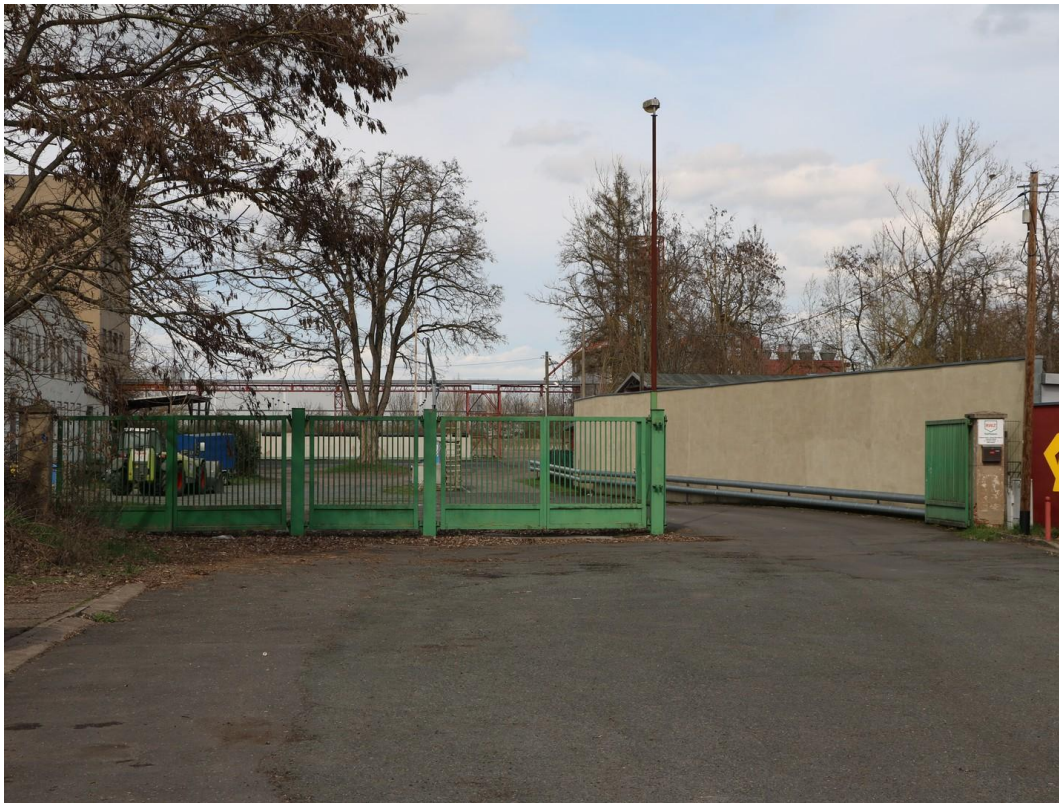
Blick auf Grundstückseinfahrt