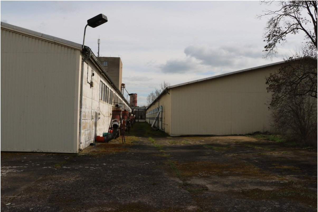
Halle 1 + 2