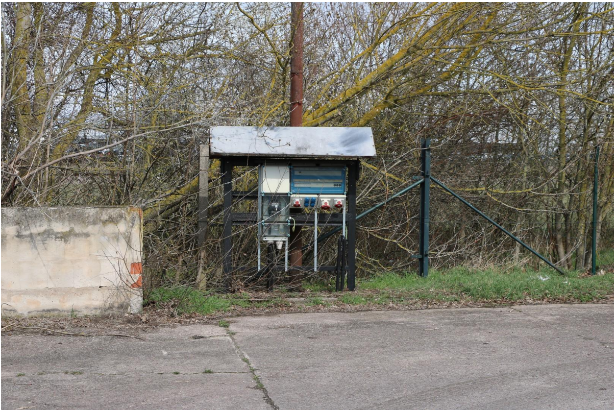
Stromversorgung im Freigelände