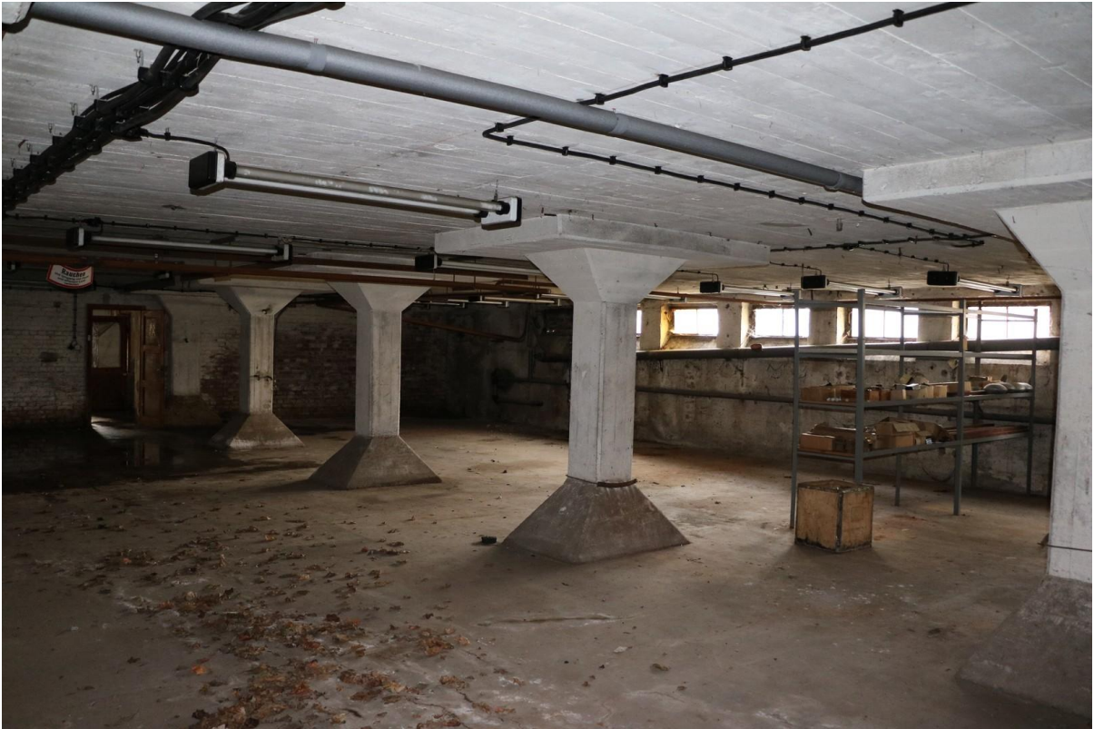
Kellerbereich Halle 3