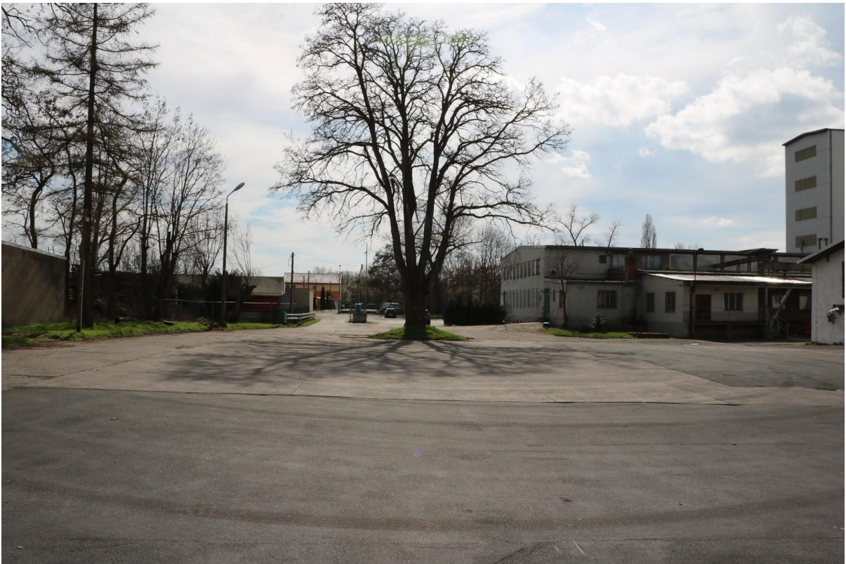
Blick auf Grundstückseinfahrt