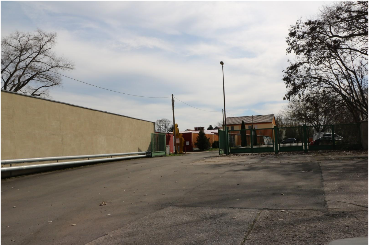
Blick zur Grundstückseinfahrt