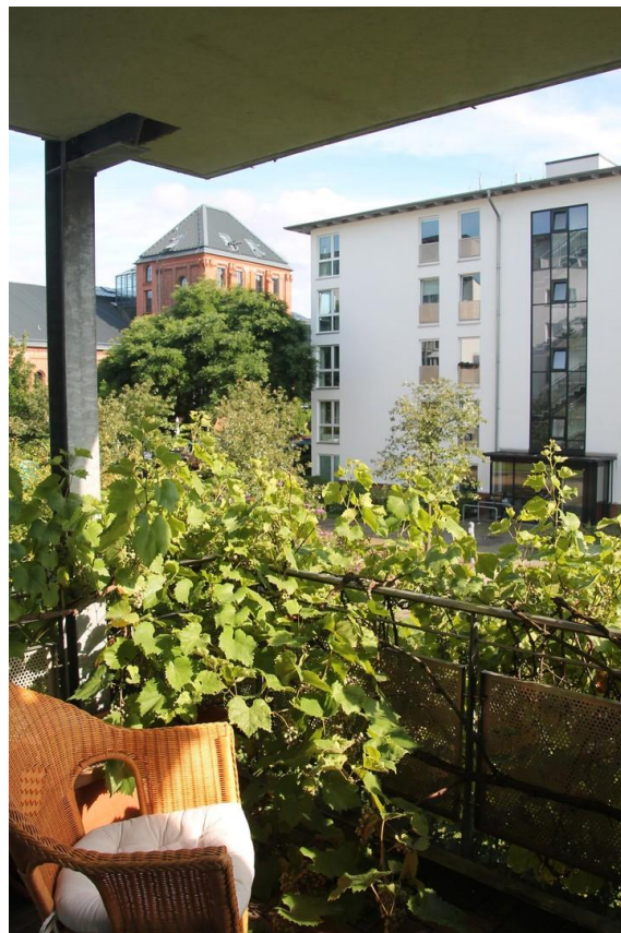
Balkon - Südseite