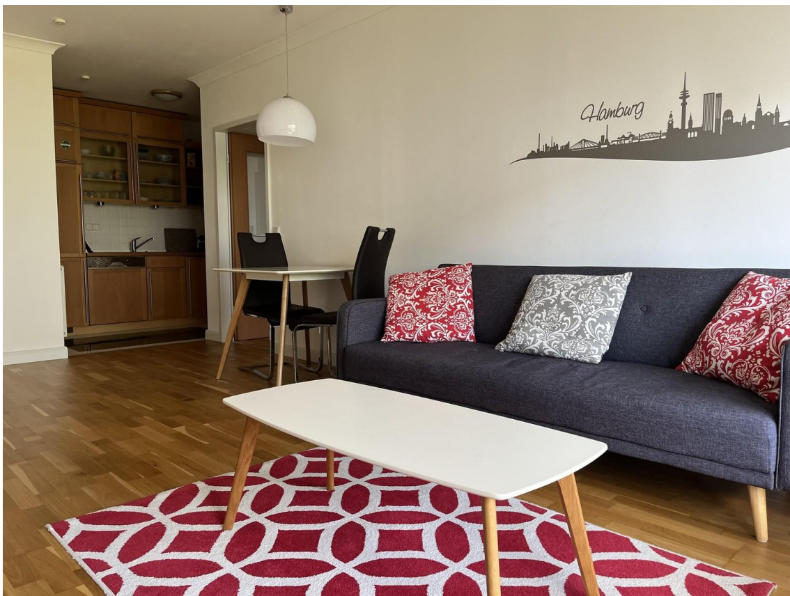
Essplatz offene Küche