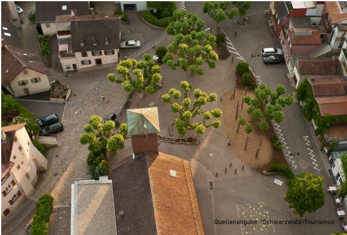
Der Johannisplatz Waldshut