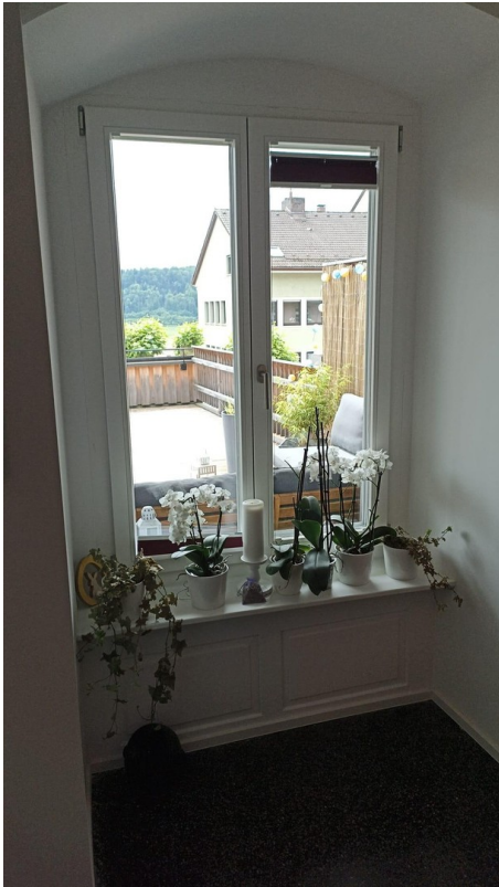
Ausblick auf Terrasse