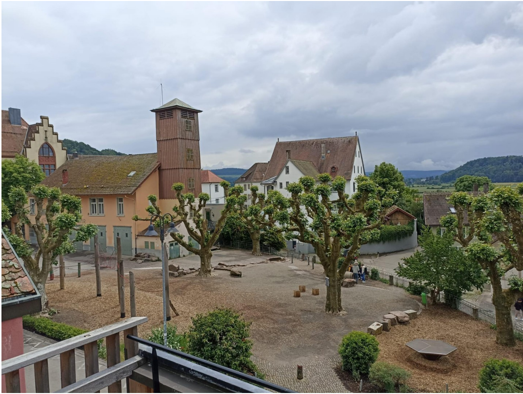
Blick zum Johannisplatz