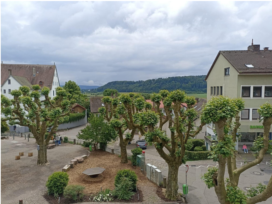
Blick zum Johannisplatz