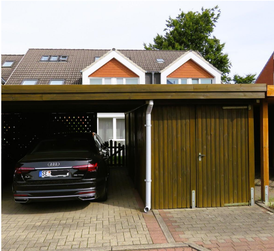
Carport und Schuppen