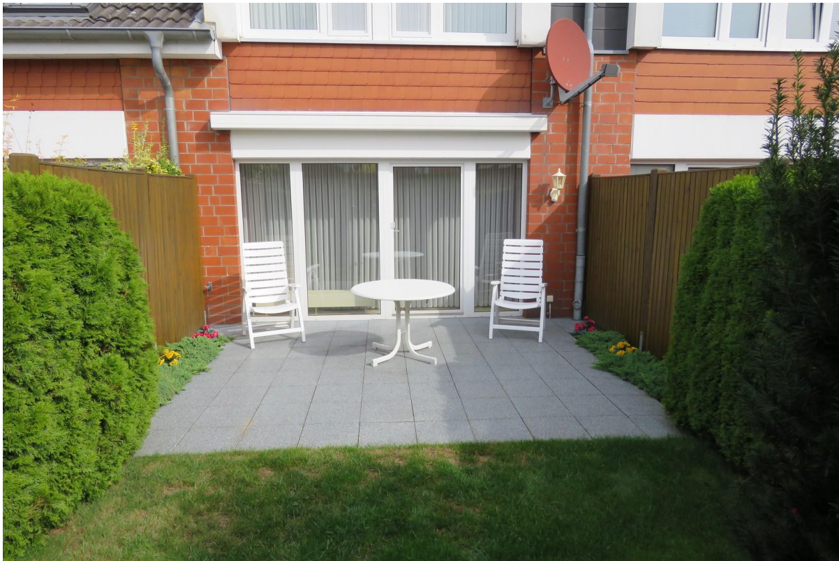
Hausansicht von hinten 2