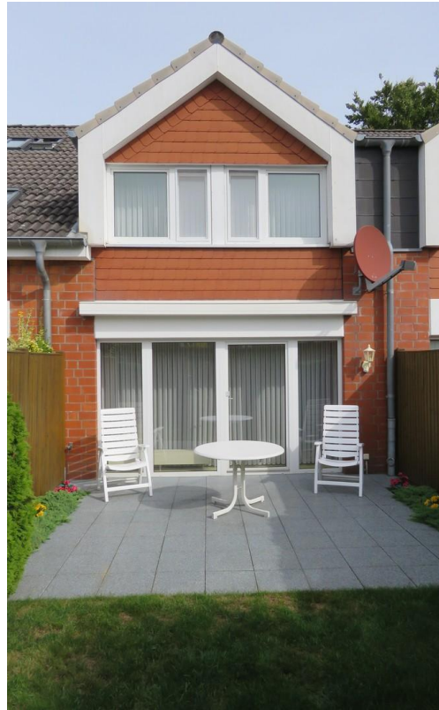
Hausansicht von hinten 1