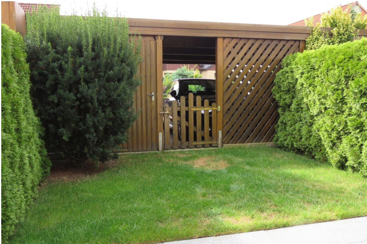
Garten und Carport