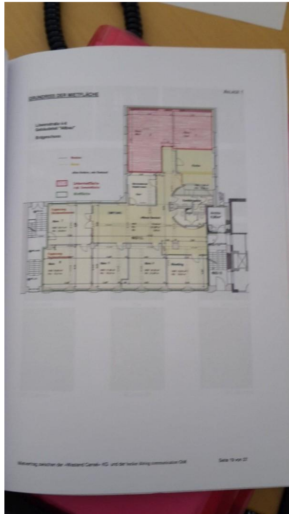
Untermietfläche in Rot