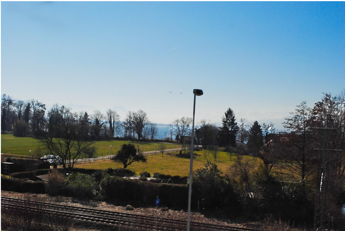
360 Grad ausblick