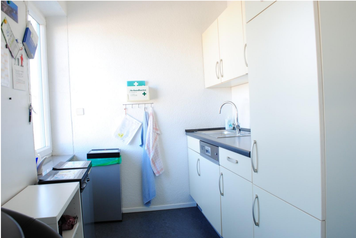
Küche / 2. OG