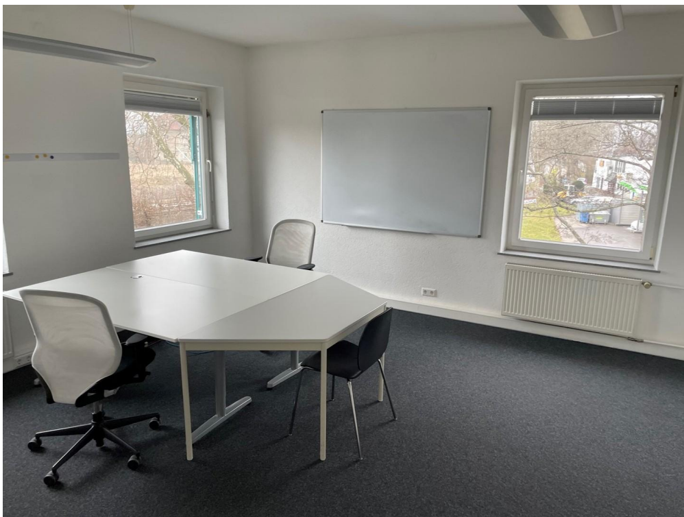
Büro 2 / 2.OG