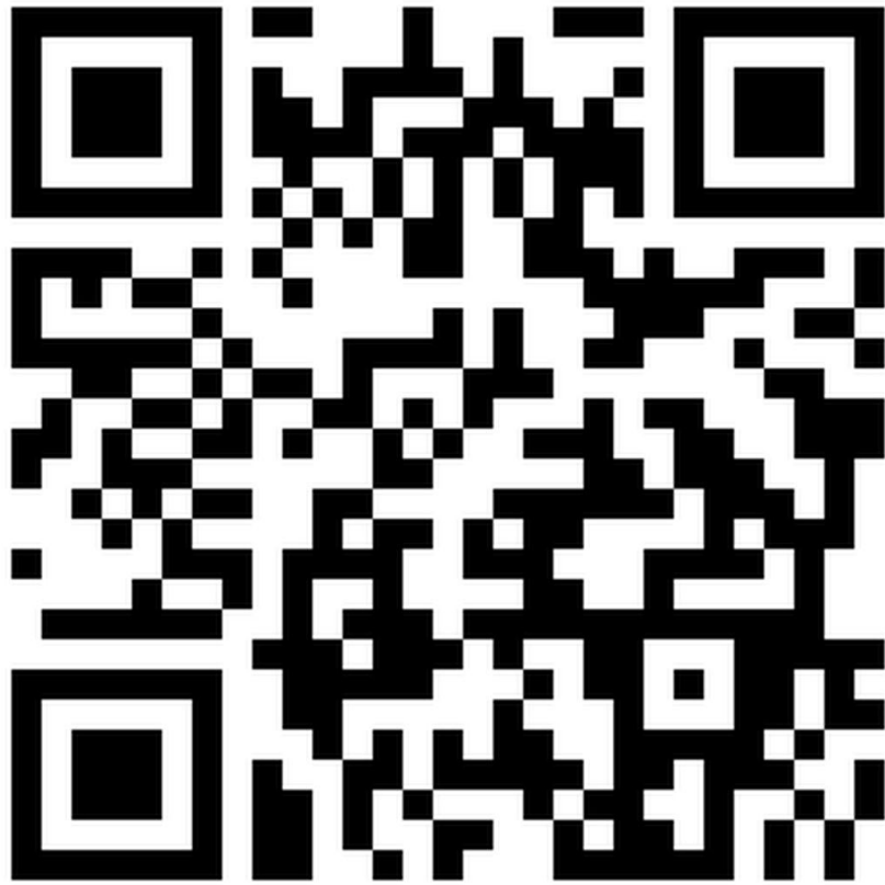
Link zur Website