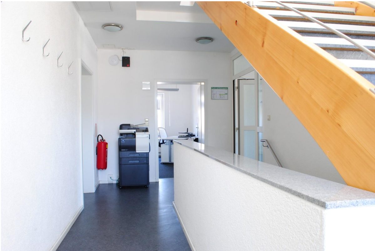
Treppenhaus / 2.=G