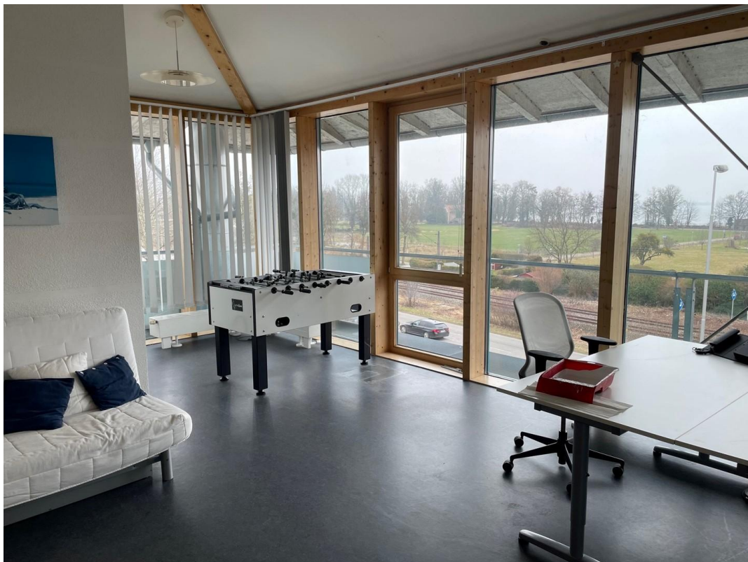
3. OG Kicker