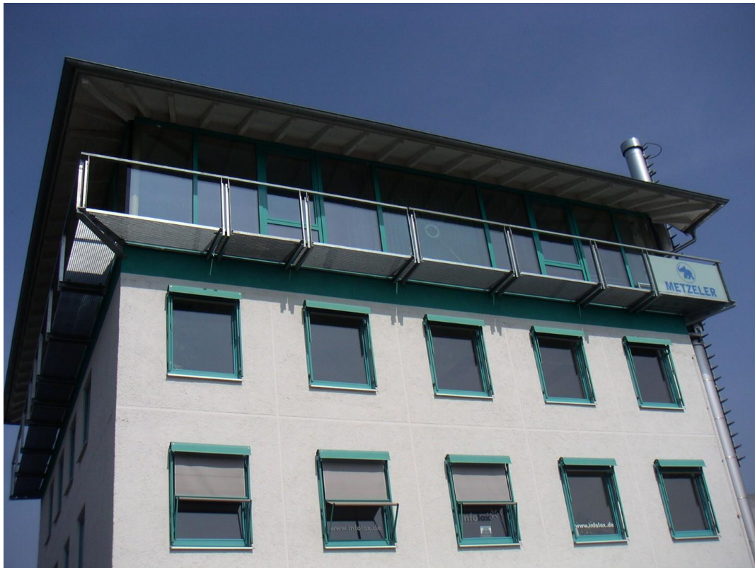
Gebäude von aussen / 2+3OG