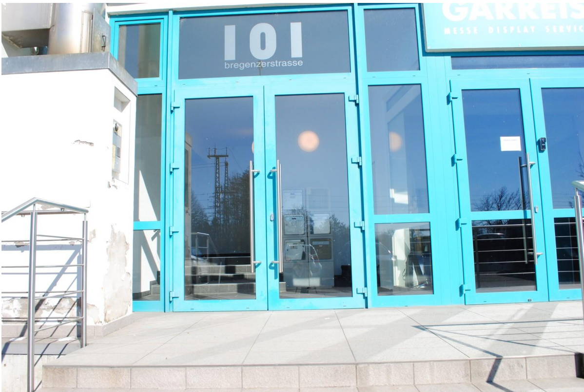
Eingang / EG