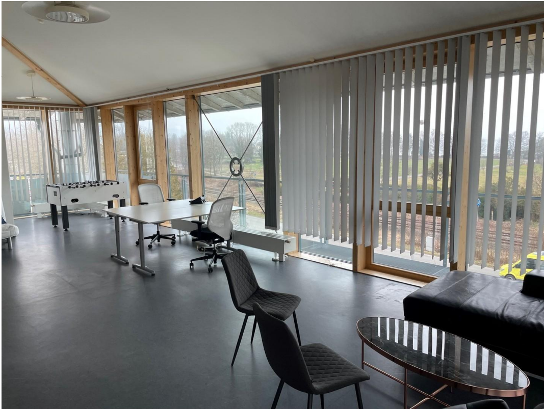
Großraumbüro / 3.OG