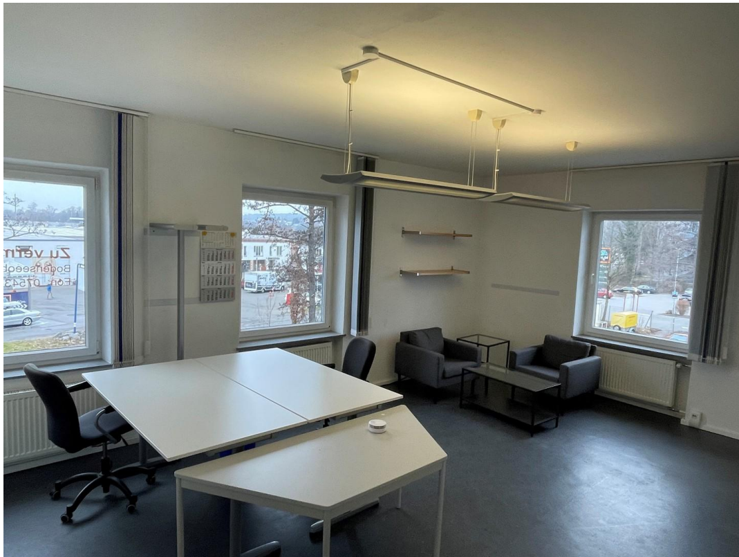
Büro 3 / 2. OG