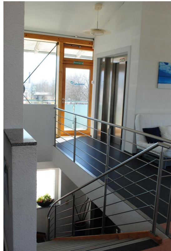
Treppenhaus / 3.OG