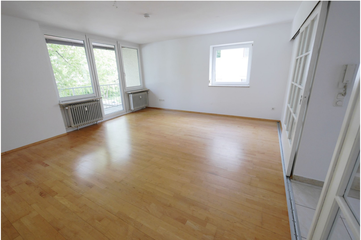
Wohnbereich & Schiebetür