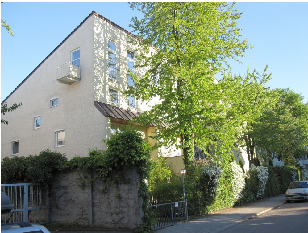
Haus von aussen