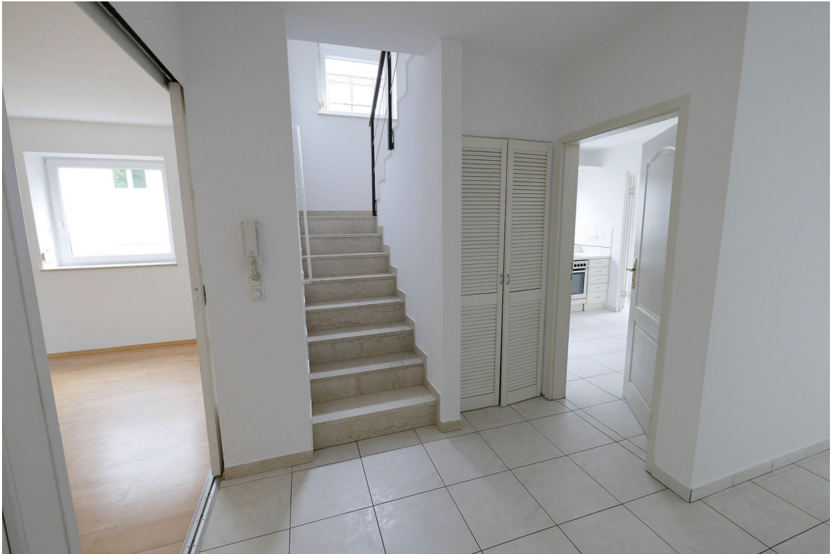
Treppe nach oben ins 2.OG