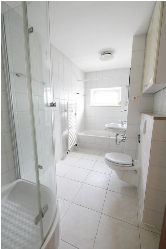
Bad mit Duschkabine & Badew.