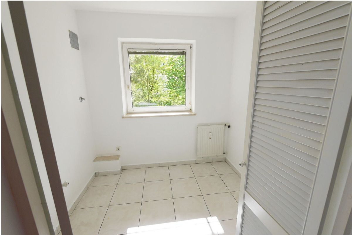
Küchennebenzimmer / Abstellr.