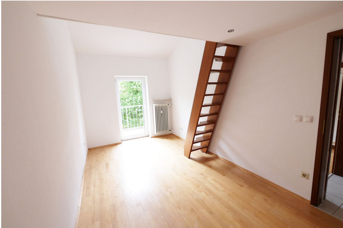
Kinderzimmer 1 mit Terrasse