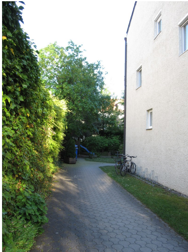
Eingang zum Wohnhaus