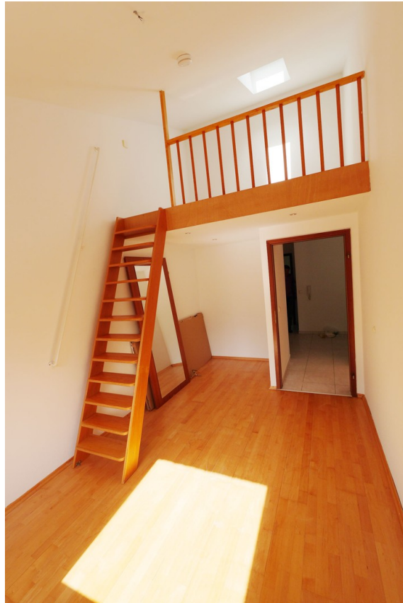
Kinderzimmer2 & Zwischenempore