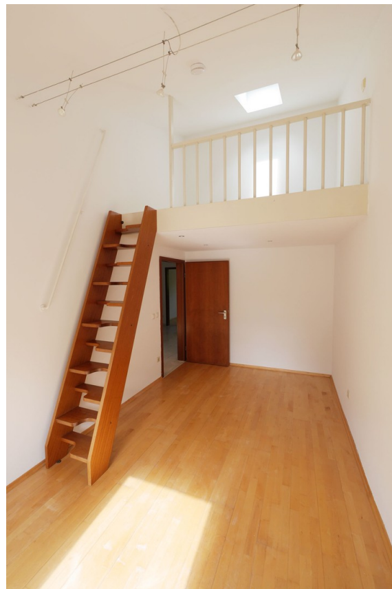
Kinderzimmer1 + Zwischenempore