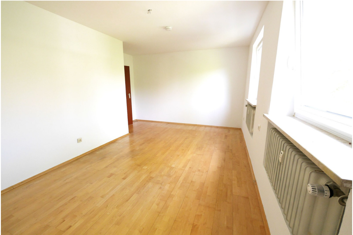
Großes Schlafzimmer 3