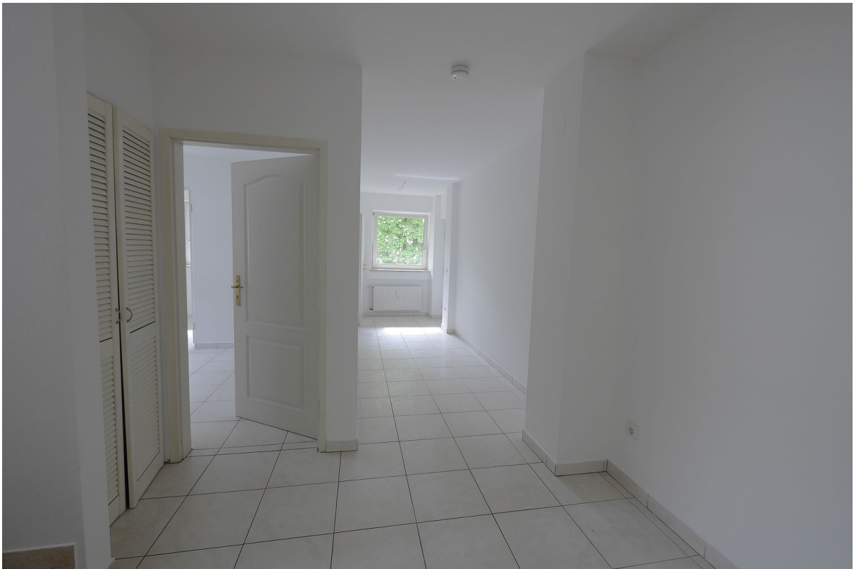
Eingangsbereich + Gäste-WC