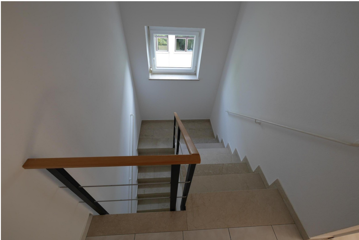
Treppe zwischen 1.&2.OG