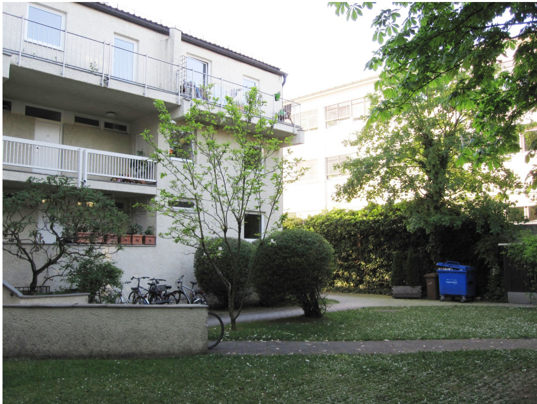
Haus von aussen