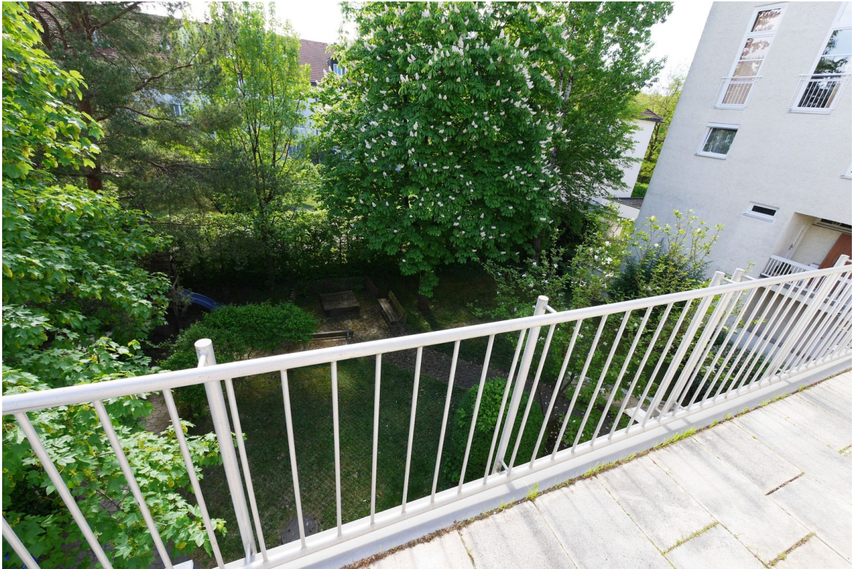
Terrasse mit Blick ins Grüne