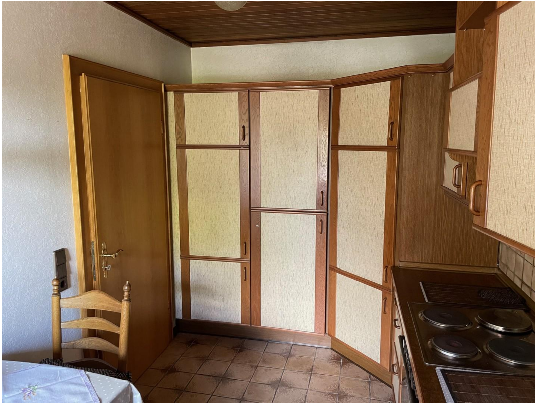
Küche 1. Geschoß