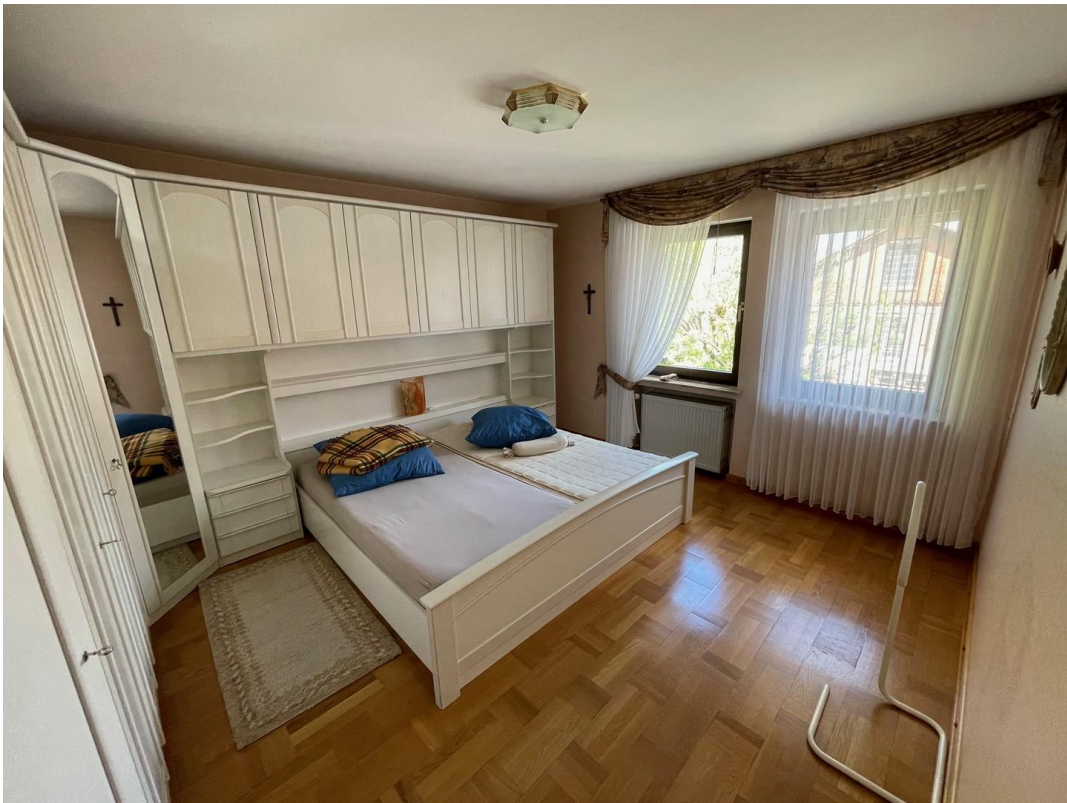
Schlafzimmer 1. Geschoß