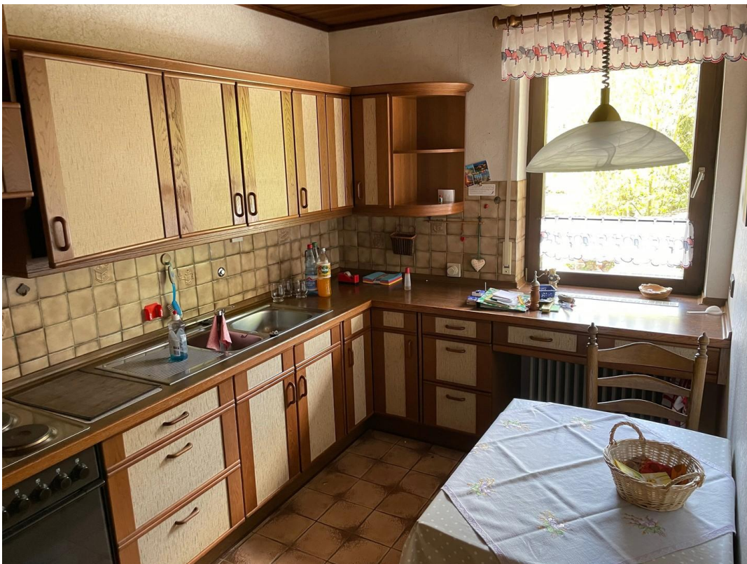
Küche 2. Geschoß