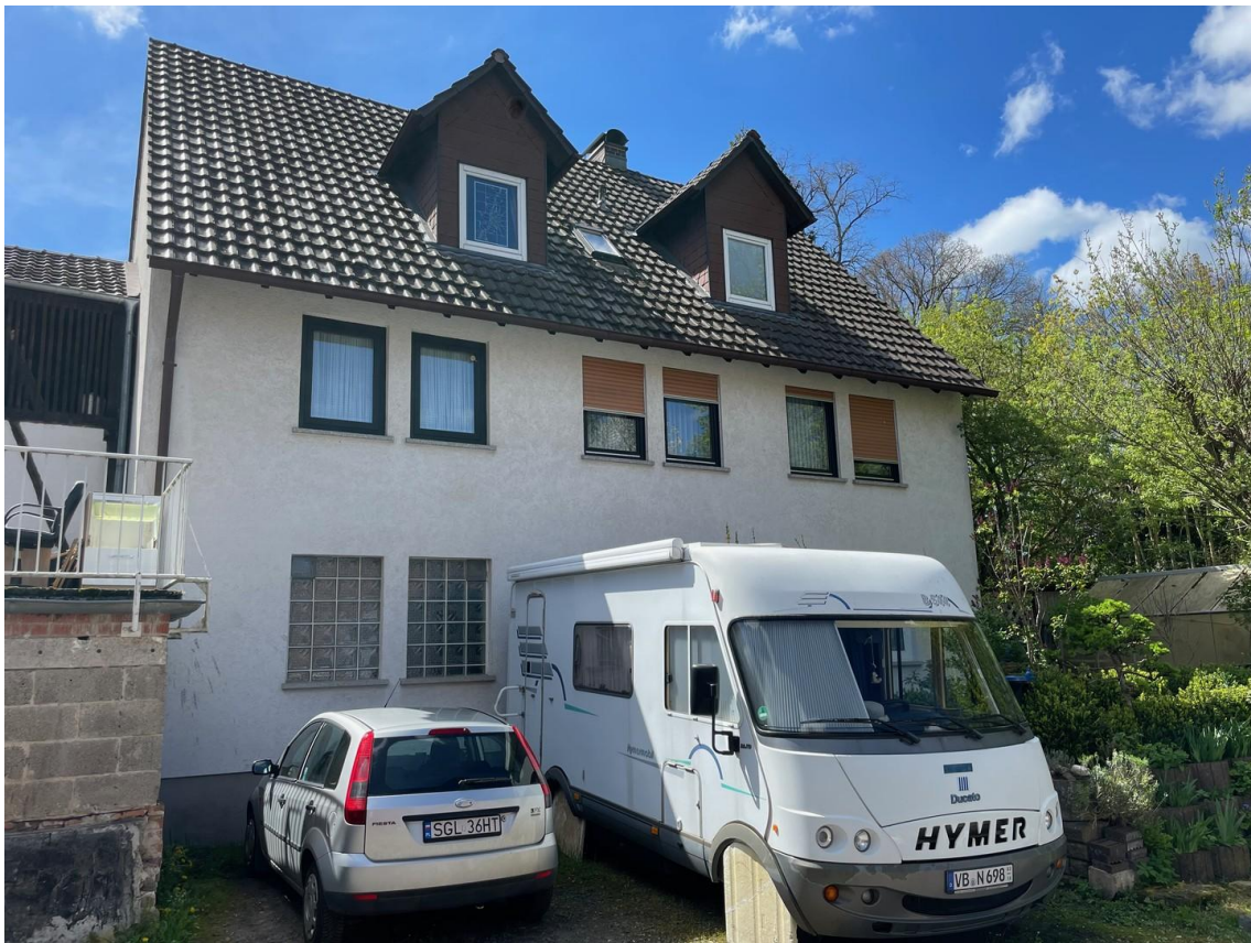
Rückseite der Immobilie