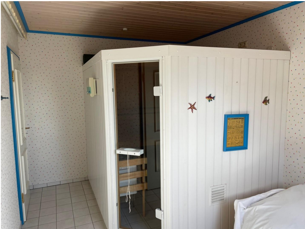
Küche 2. Geschoß