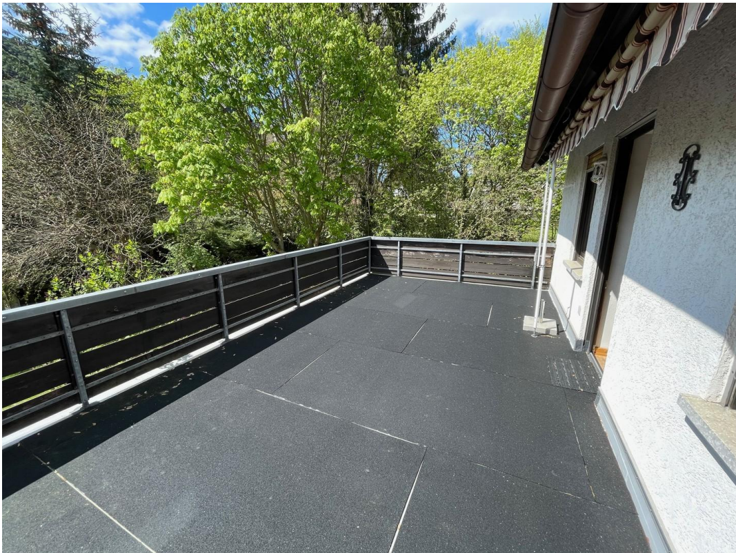
Ballkonterasse 1. Geschoß