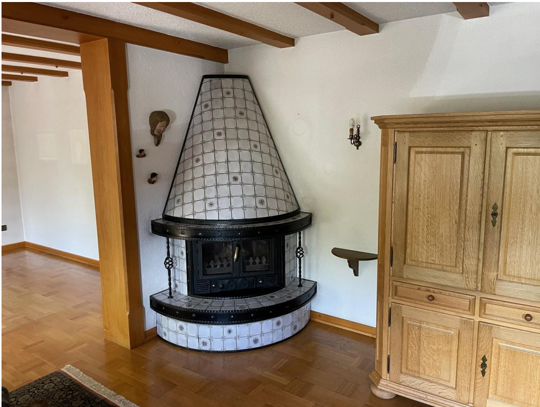
Wohn/Essbereich 1. Geschoß