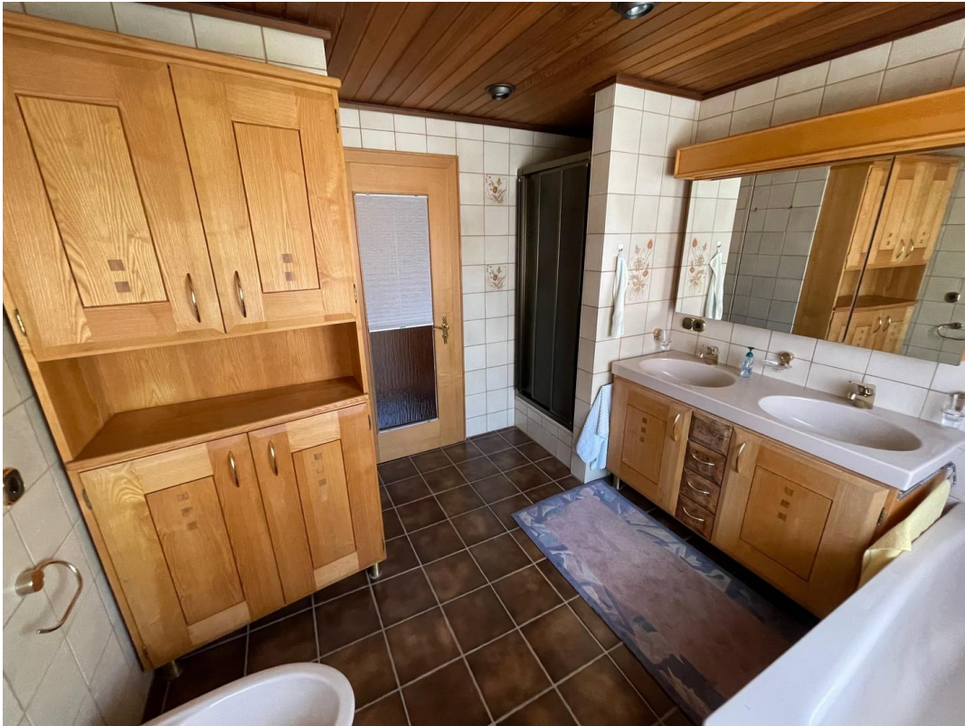
Badezimmer 1. Geschoß