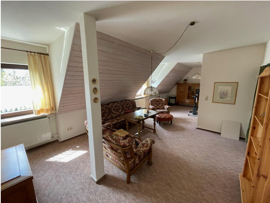
Wohn/Essbereich im 2. Geschöß