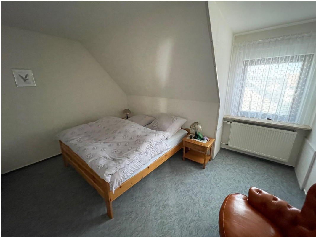
Schlafzimmer im 2. Geschoß