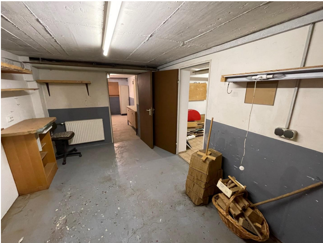
Blick in einen der Kellerräume