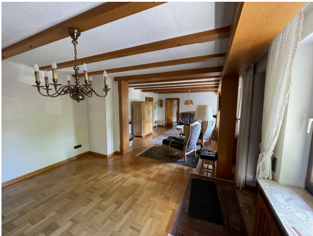
Wohn/Essbereich 1. Geschoß