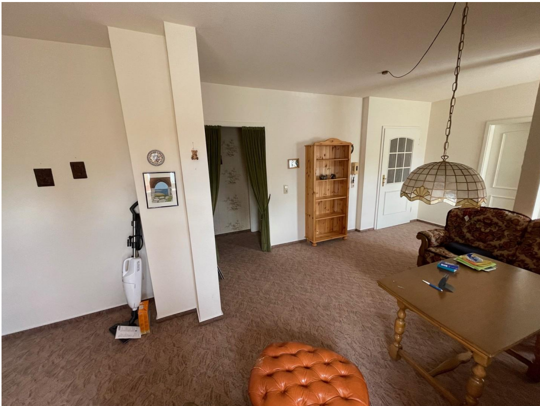
Wohn/Essbereich im 2. Geschöß