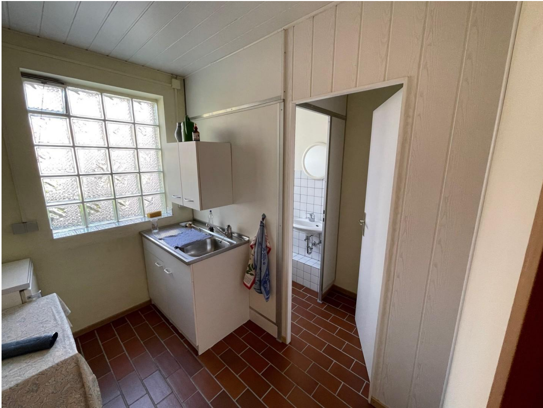
Erdgeschoß Teeküche und Toilet