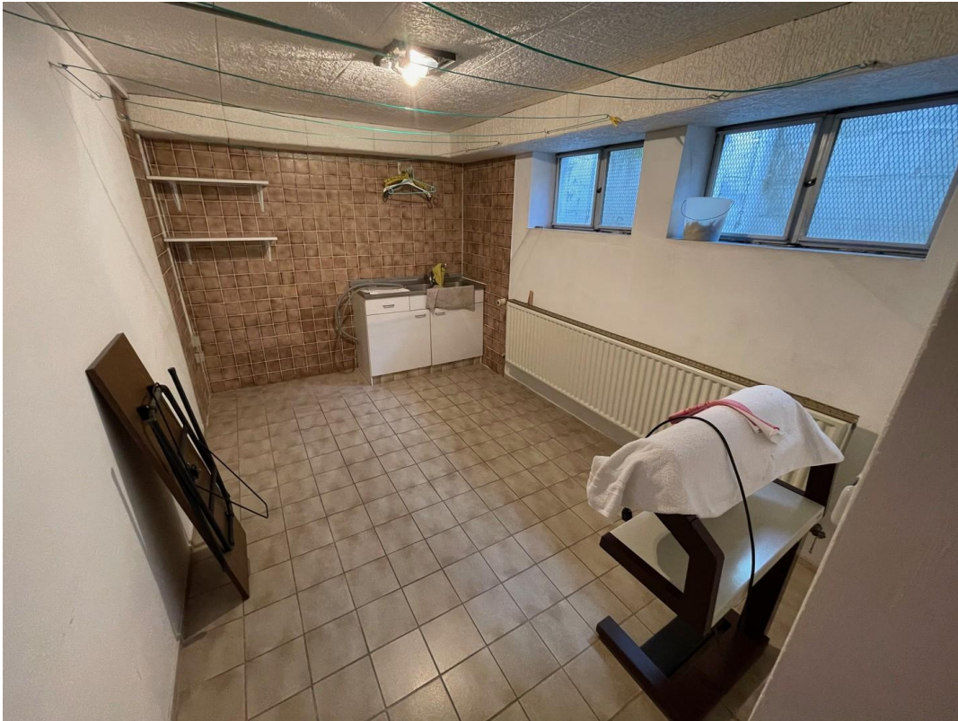
Waschküche im Keller