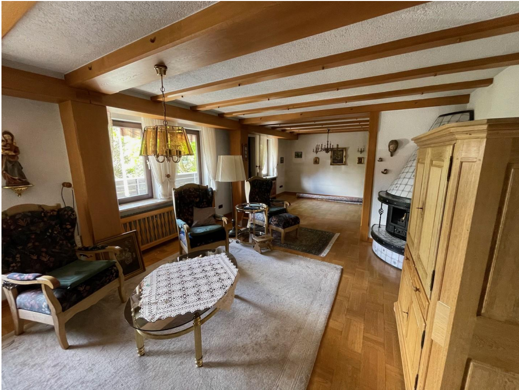
Wohn/Essbereich 1. Geschoß