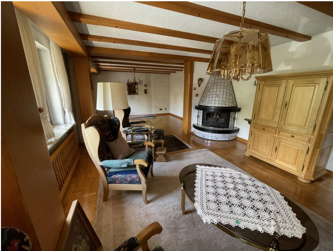
Wohn/Essbereich 1. Geschoß