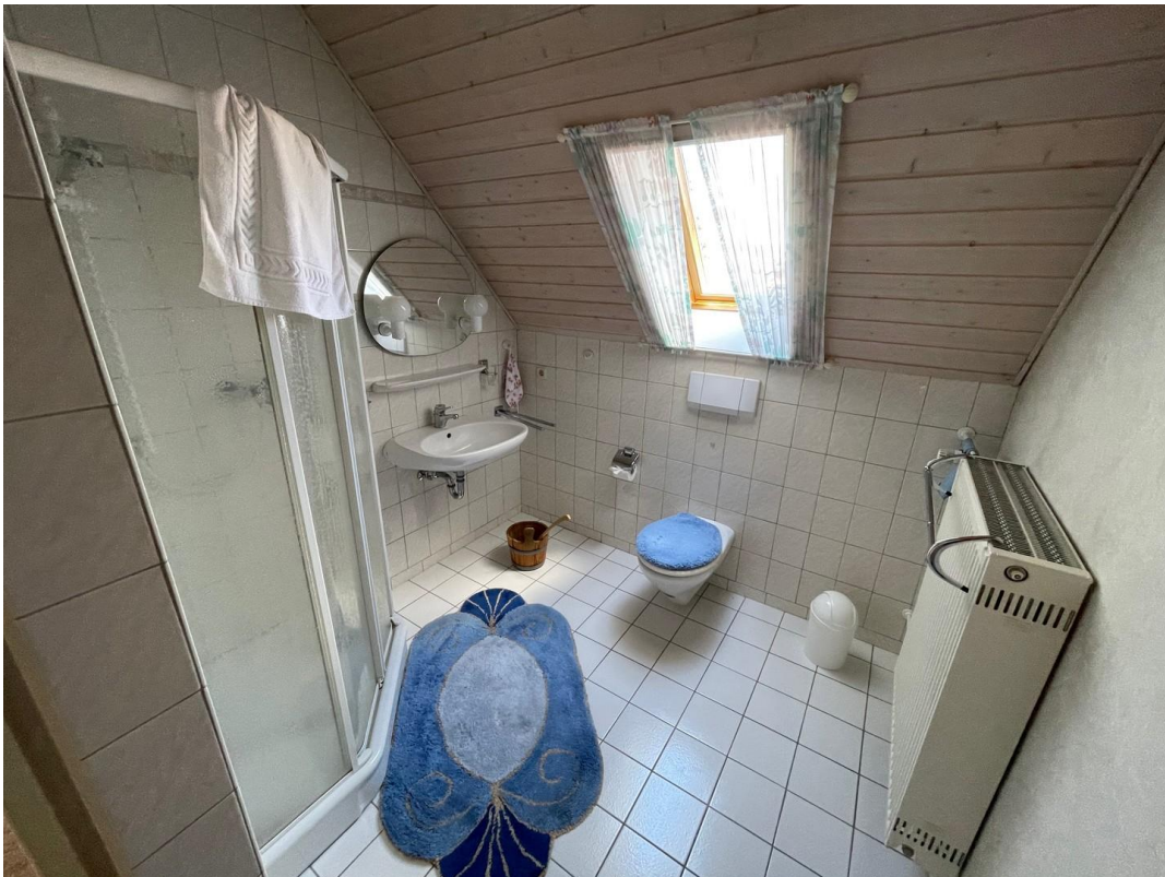
Bad im Dachgeschoß