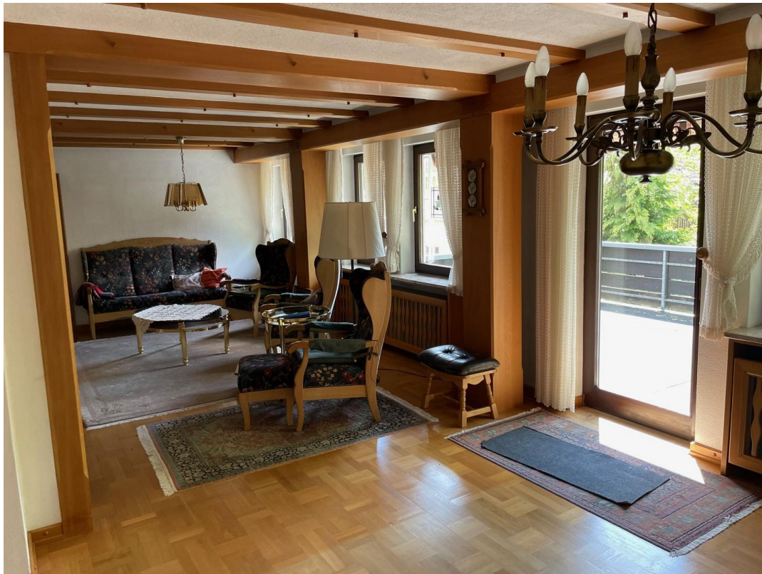
Wohn/Essbereich 1. Geschoß