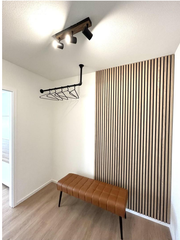
Flur / Garderobe