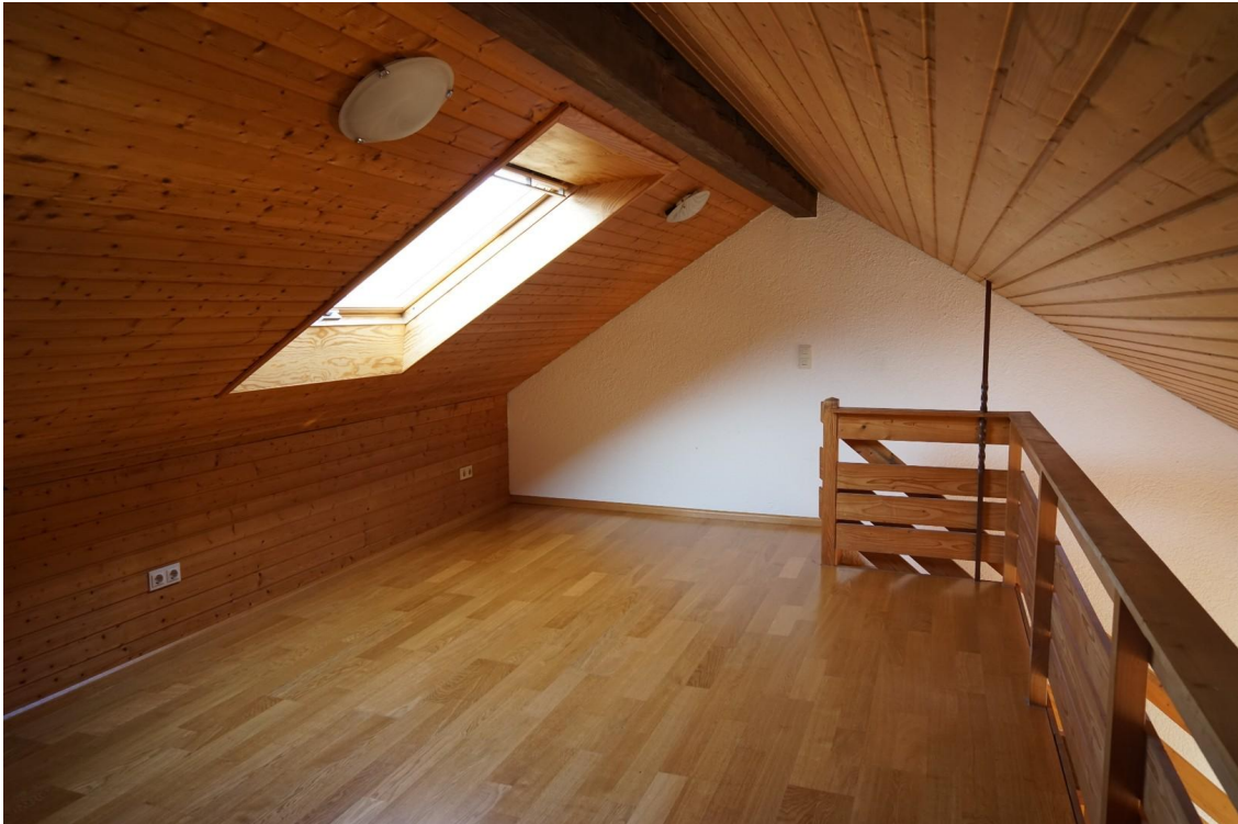
Galerie für Essplatz