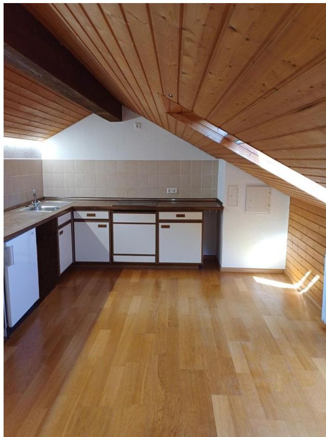
Küche im Dachspitz mit Fenster