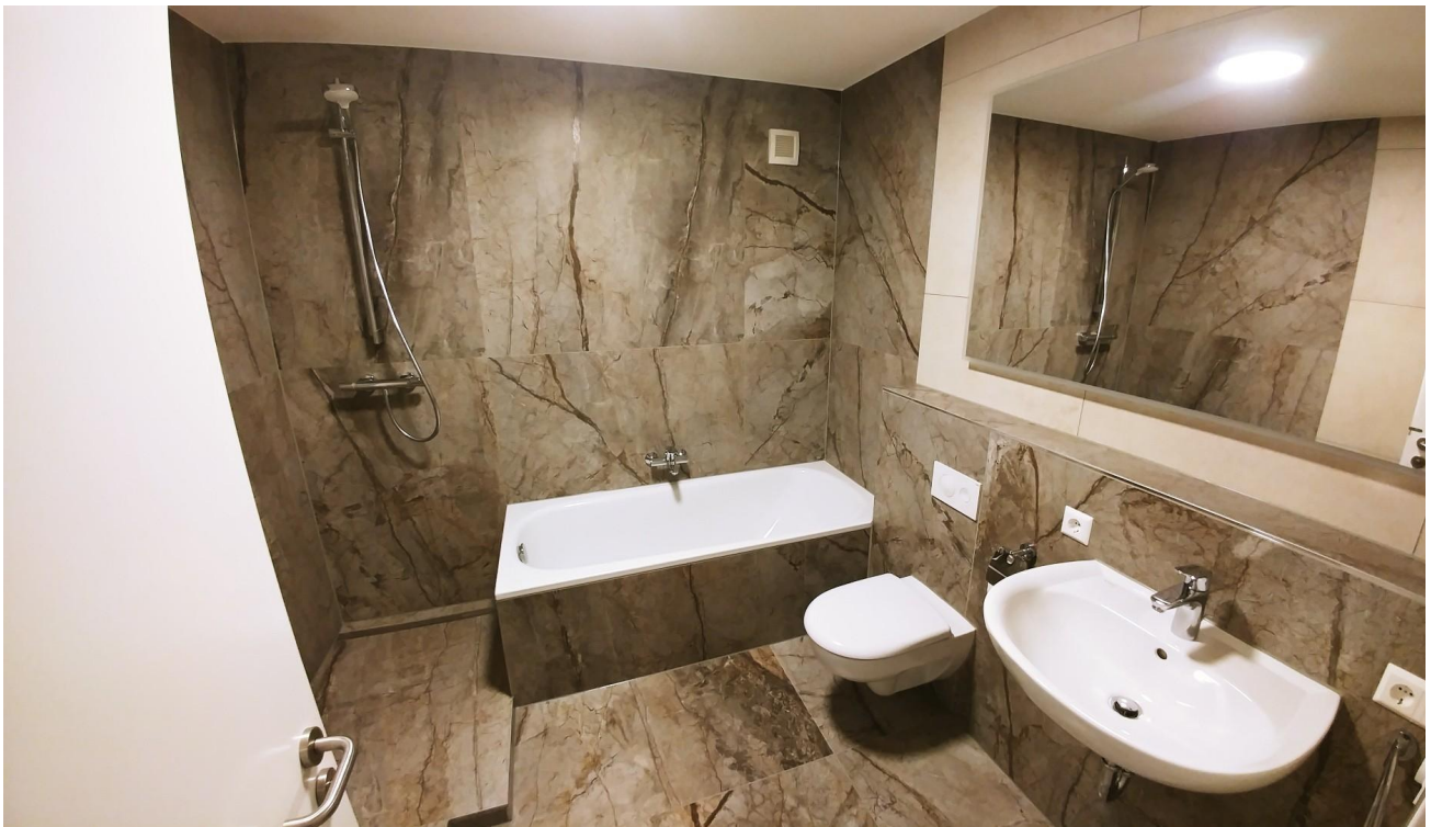
Bad mit Dusche und Wanne