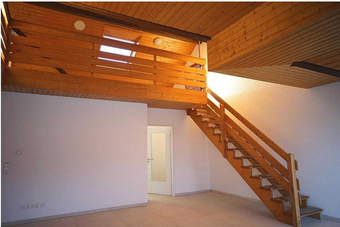
Treppe zur Galerie