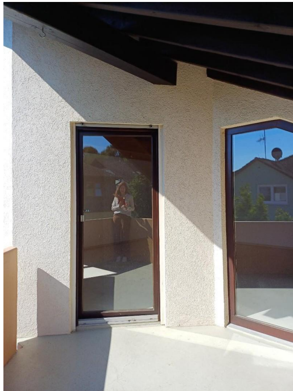
Süd-West Balkon vom Wohnzimmer