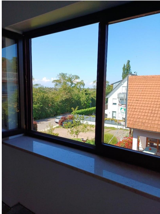
Aussicht vom Schlafzimmer