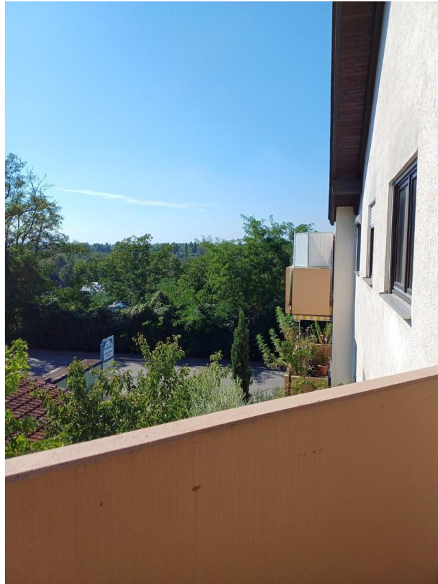
Aussicht vom Balkon