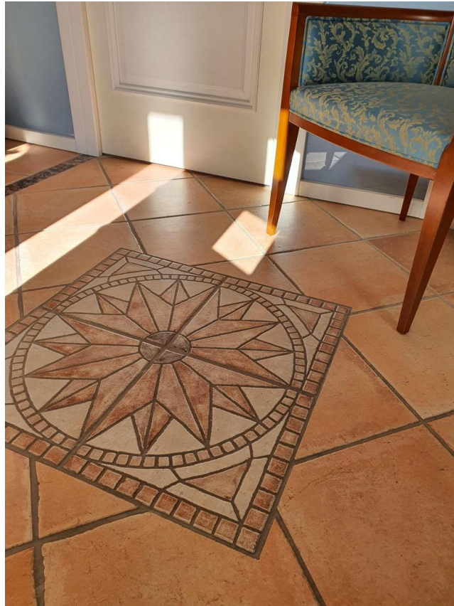
Fussboden Haus West