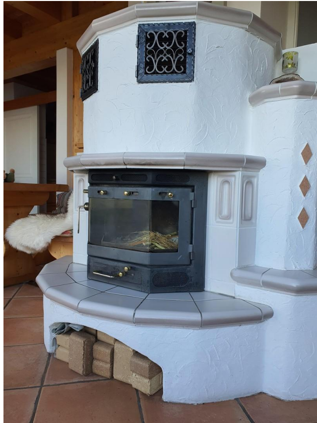
kachelkamin KAGO Haus West