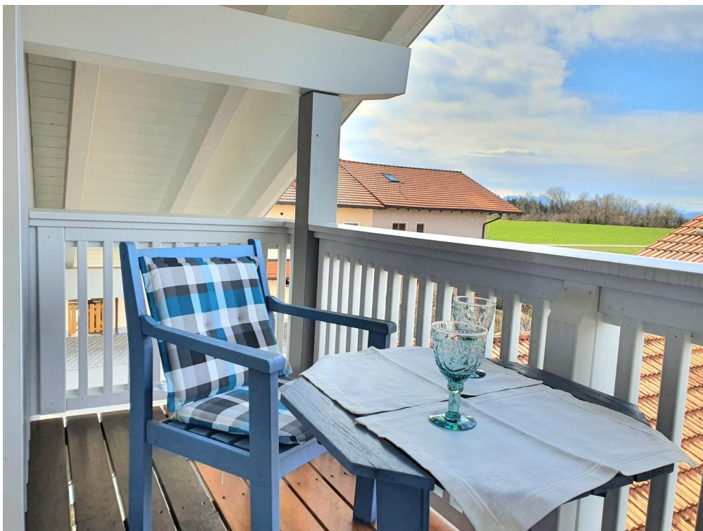
Balkon Galerie Haus West