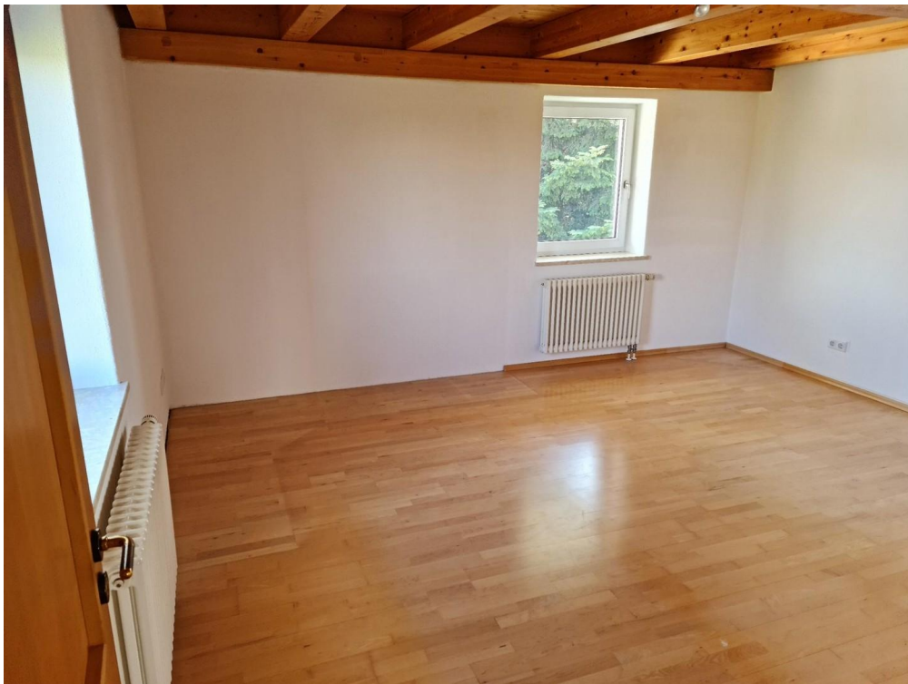
Schlafzi 1 OG HAus Ost