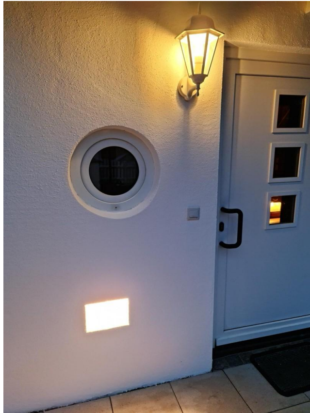
Lichtsteine Haus West