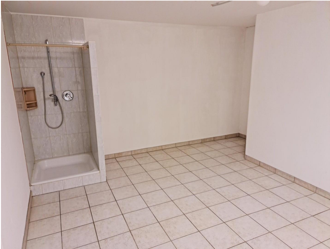
hobbyraum mit Dusche Haus Ost