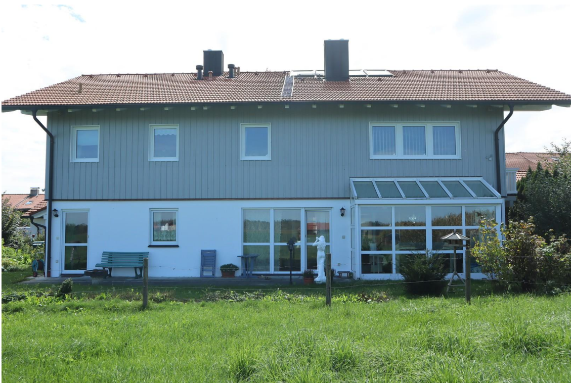
Nordseite mit Weide