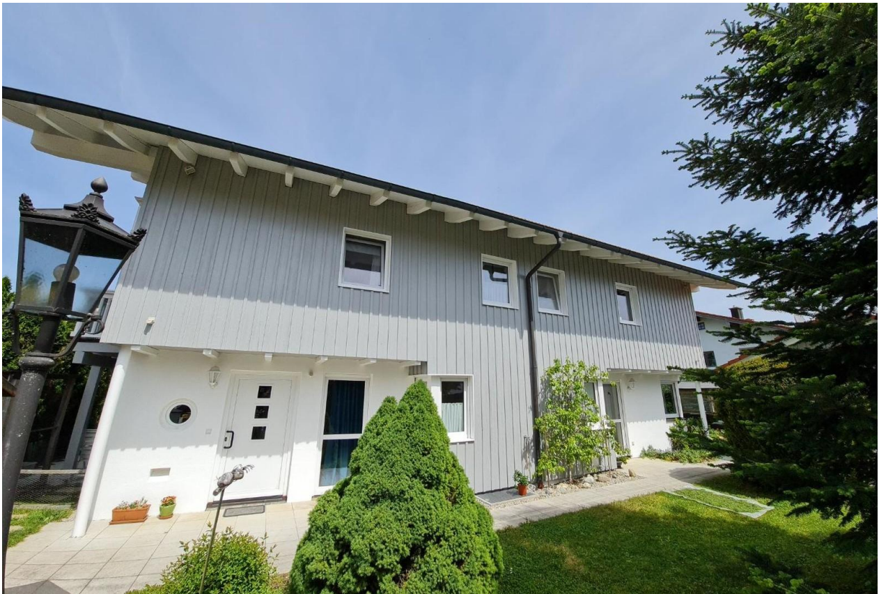
Aussenansicht Eingang Haus Wes