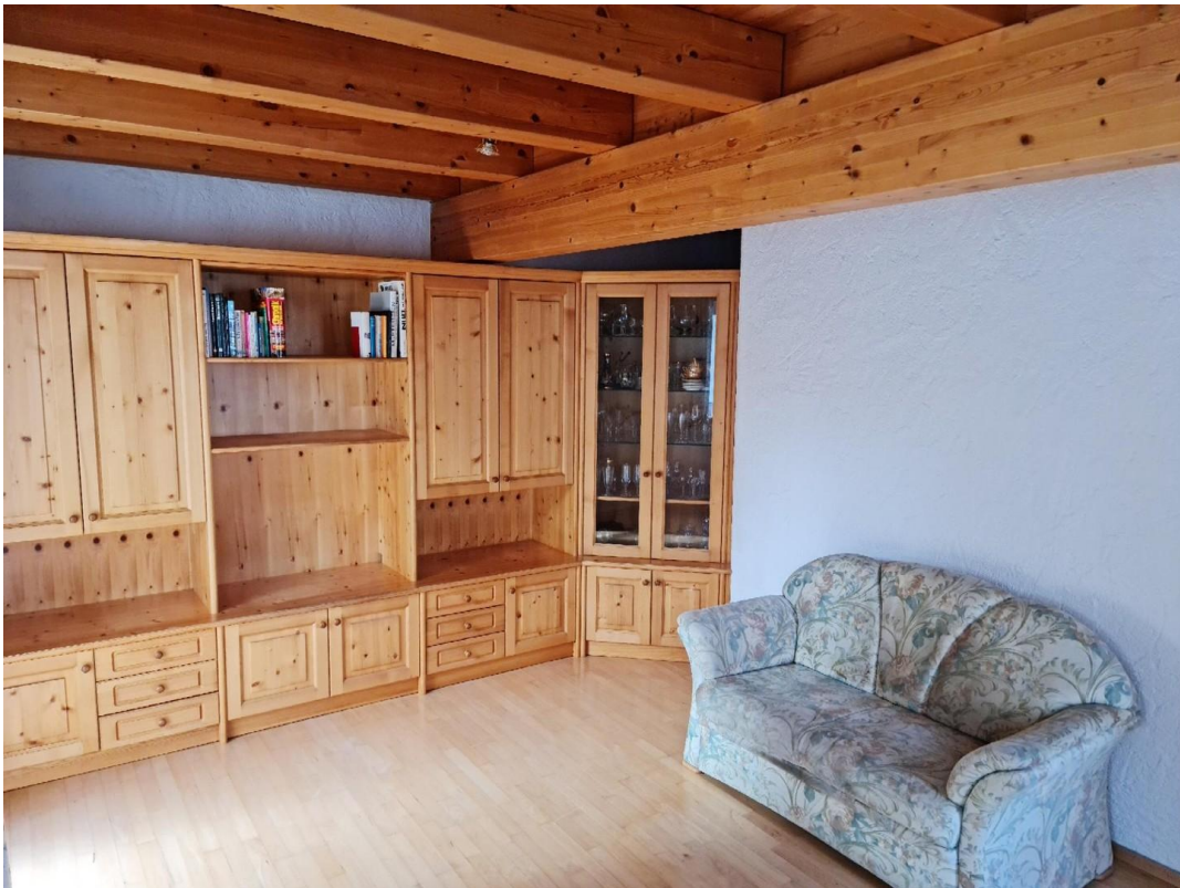
Wohnzi Haus Ost