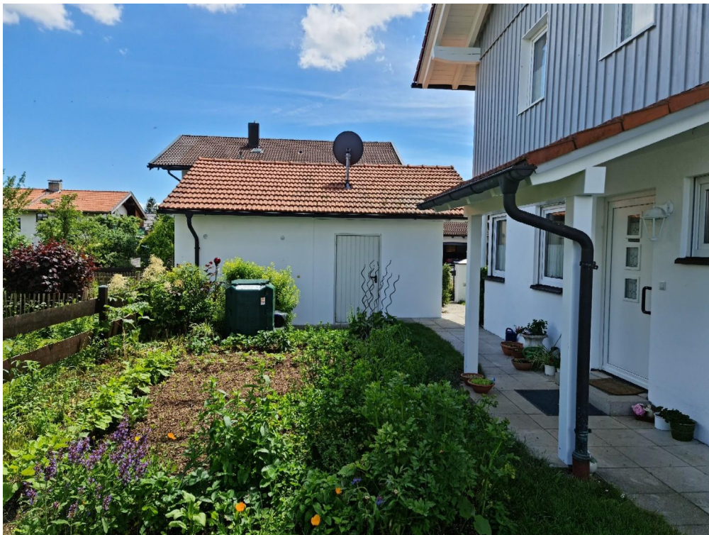
Zugang HAus Ost mit DoppelGara