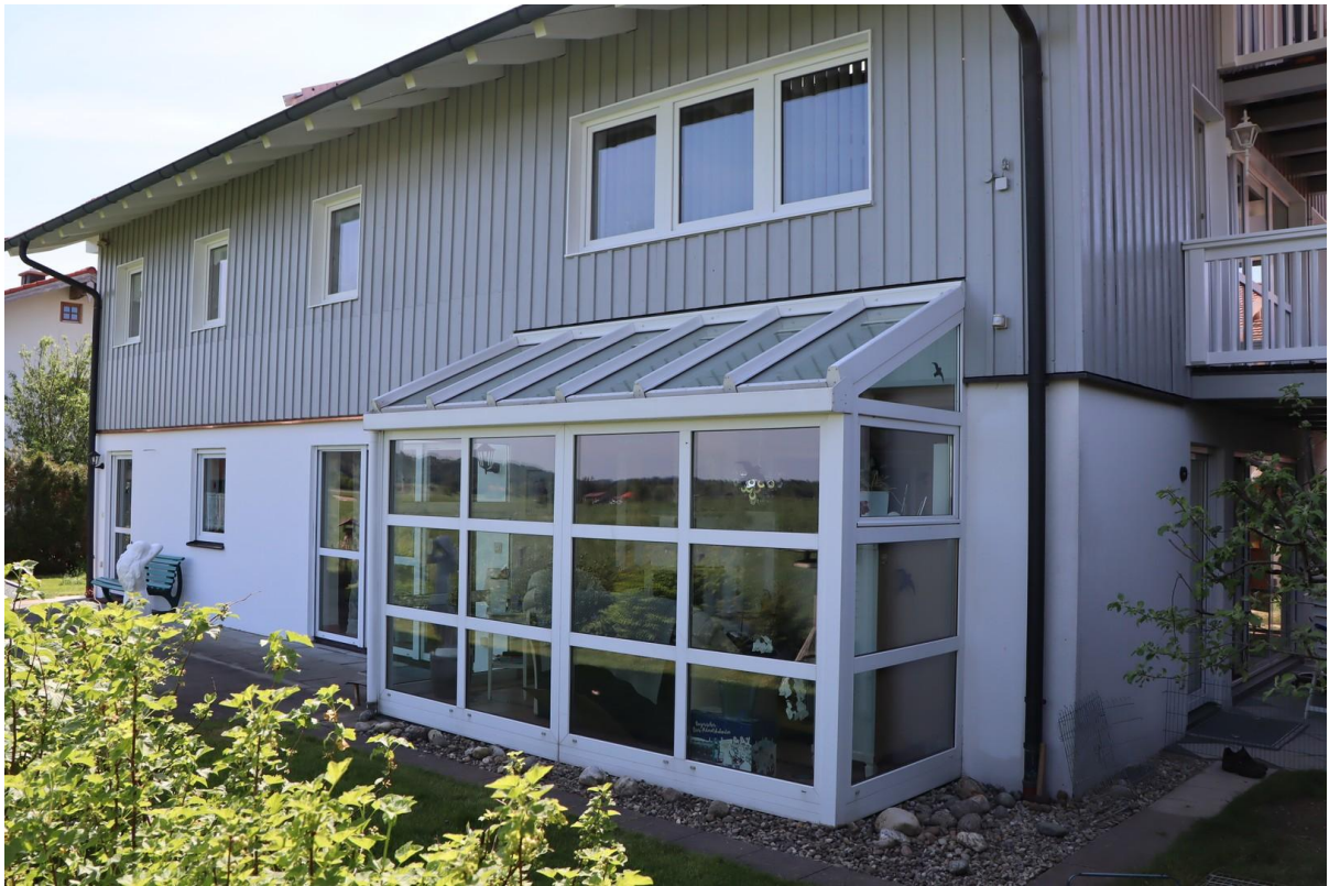
Wintergarten Haus West