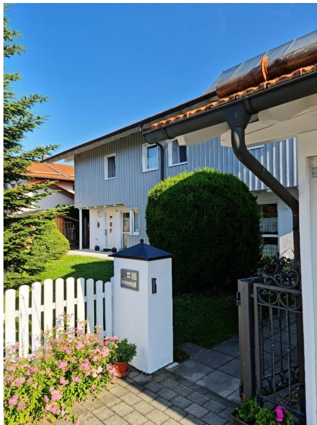
Zugang Haus west