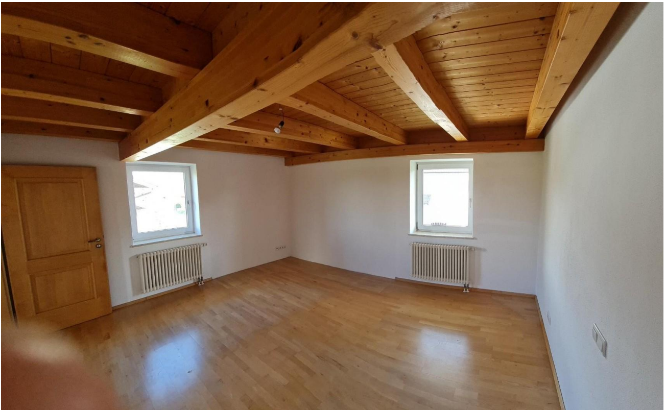
Schlafzimmer Haus Ost