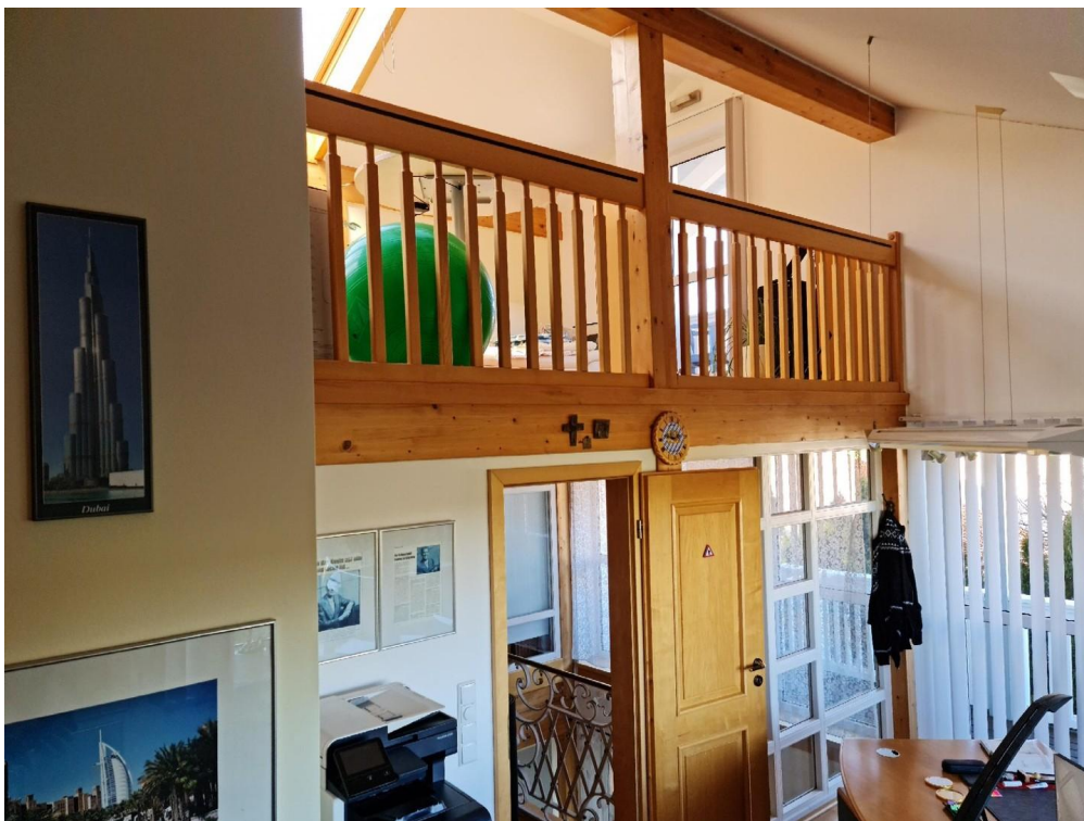
Gr Arbeitszimmer m Galerie H W