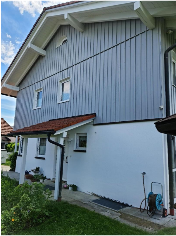
zugang haus ost