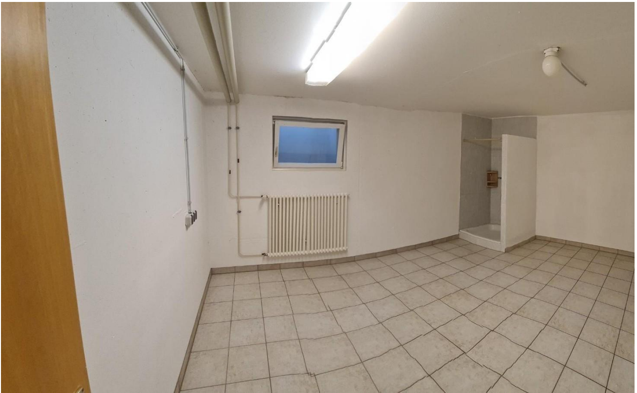
Hobbyr Haus Ost Dusche FB Hzg