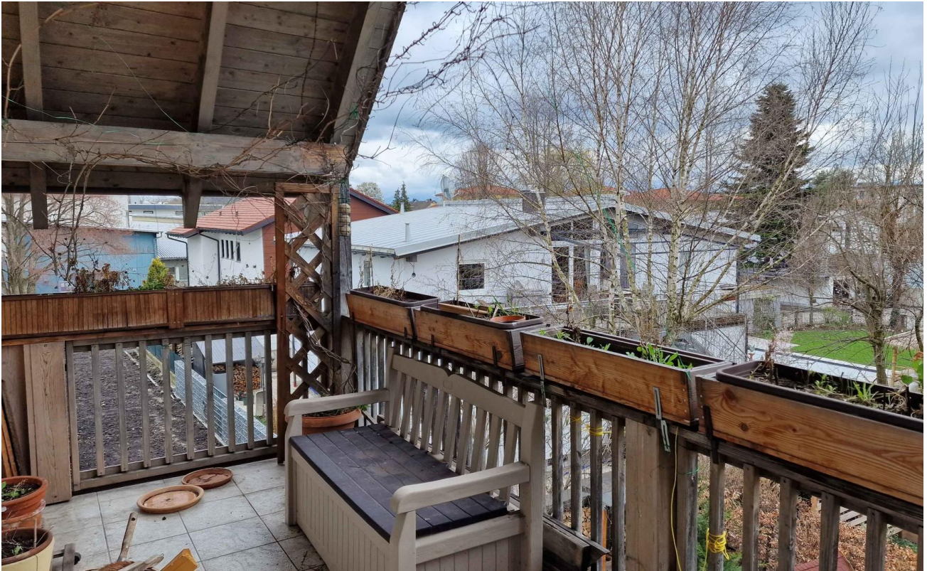
Balkon Ri. Südost