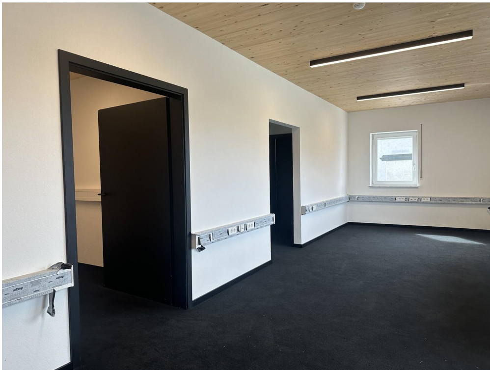
... mit großem Schaufenster