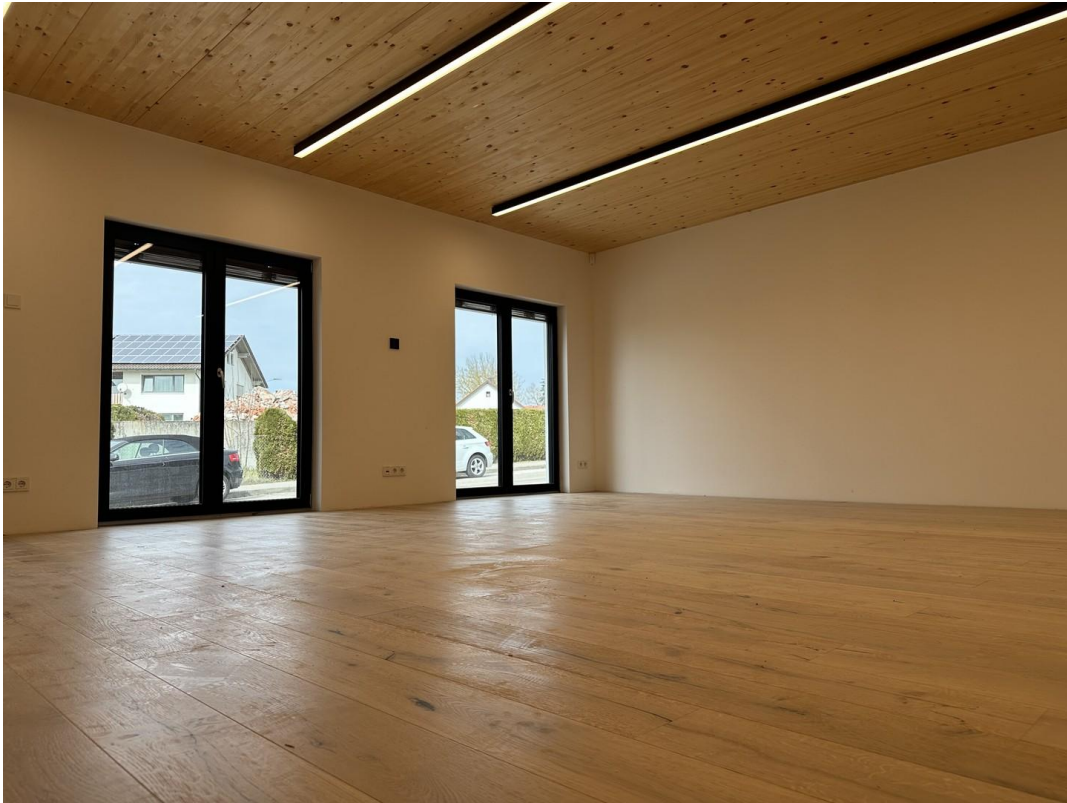
... hell und repräsentativ