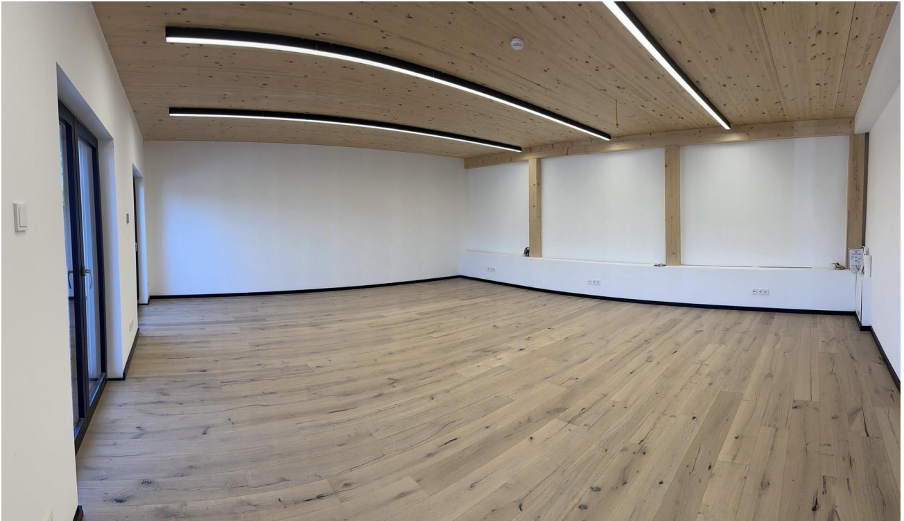
Das Herzstück- der Hauptraum