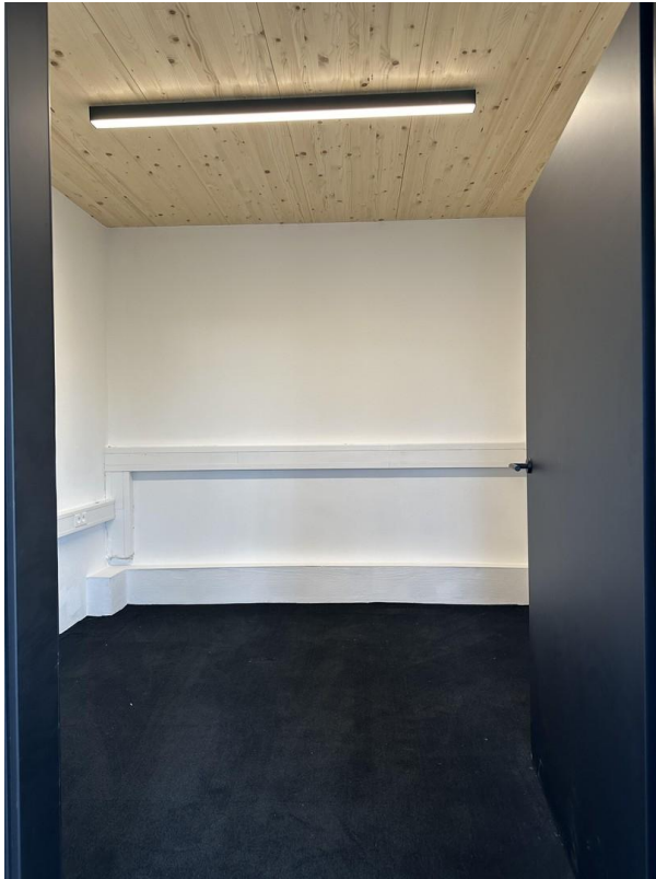
Praxisraum oder Lagerraum