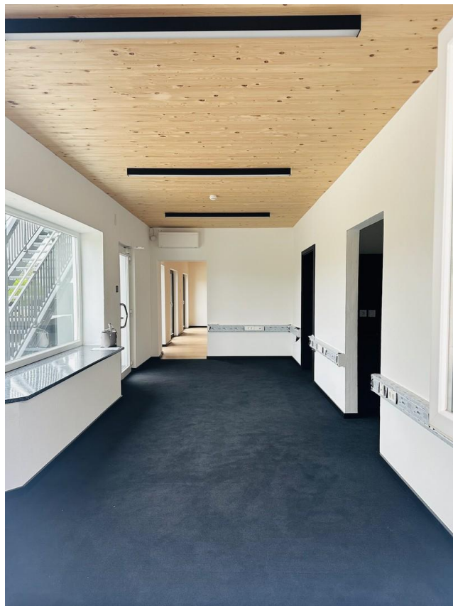
3 Räume, viele Möglichkeiten