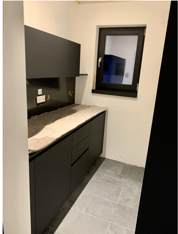
Küche OG (kleinere Einheit)