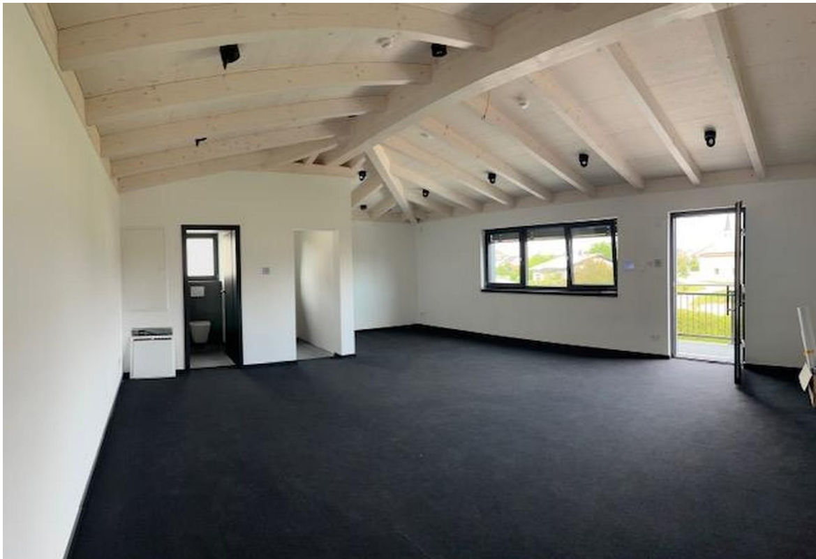
Einheit OG mit ca. 58 m 2