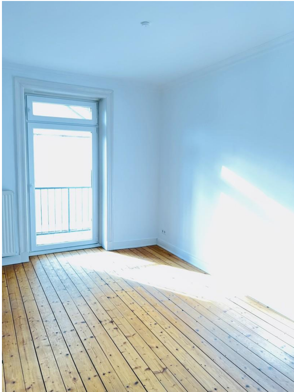
Wohn- und Esszimmer