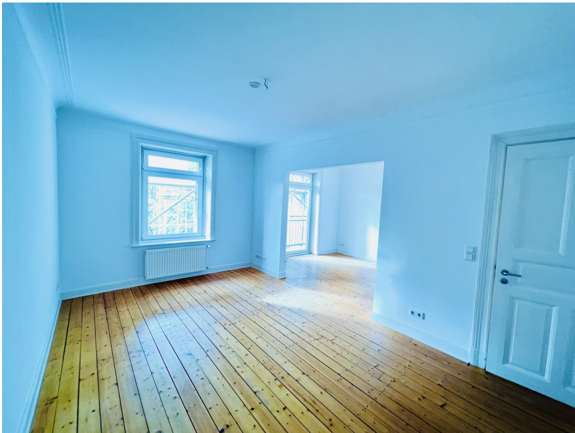
Wohn- und Esszimmer