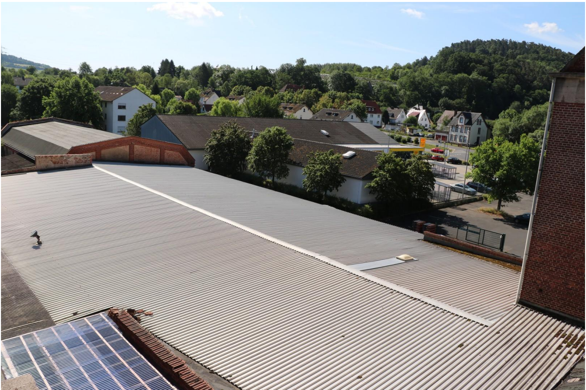
Blick über die Lagerhallen