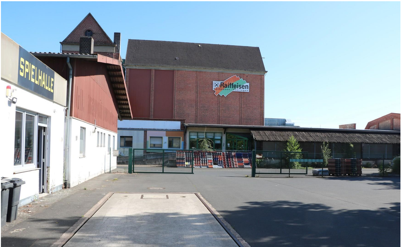
Grundstückseinfahrt / Waage