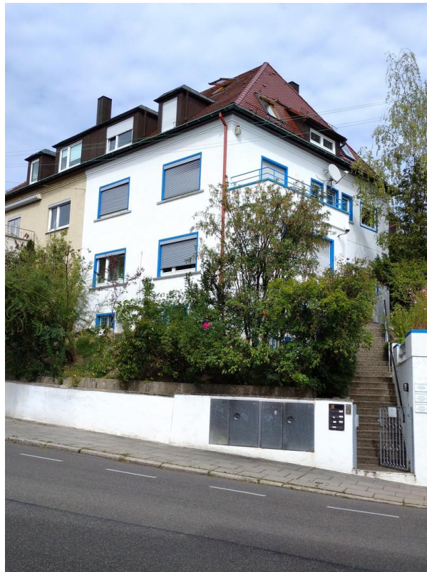
Aussenansicht _ Straße