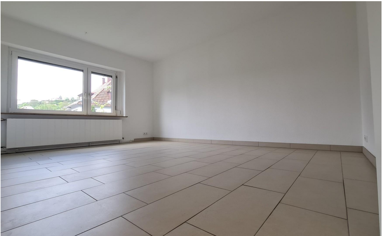
19m 2 -Zimmer