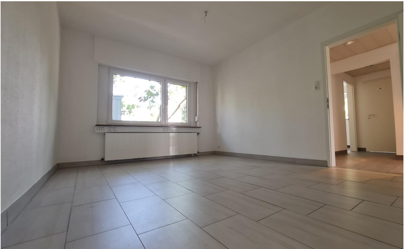
17m 2 -Zimmer