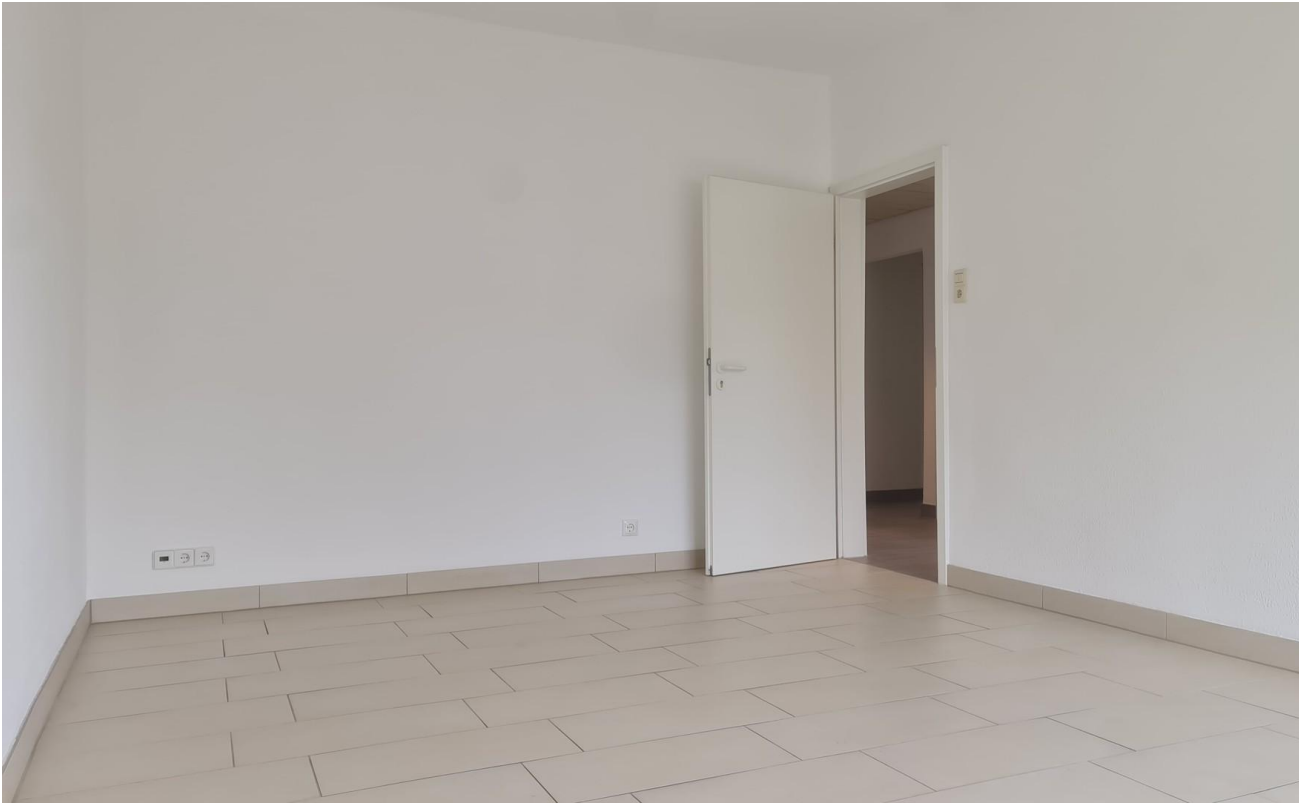
19m 2 -Zimmer