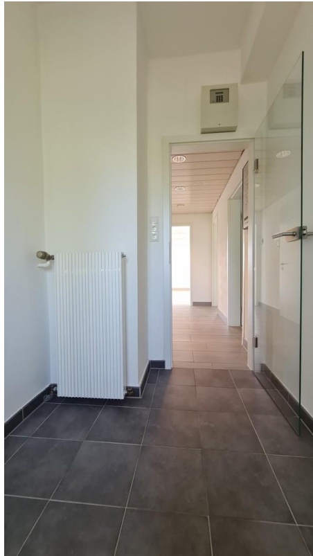
5m 2 -Zimmer