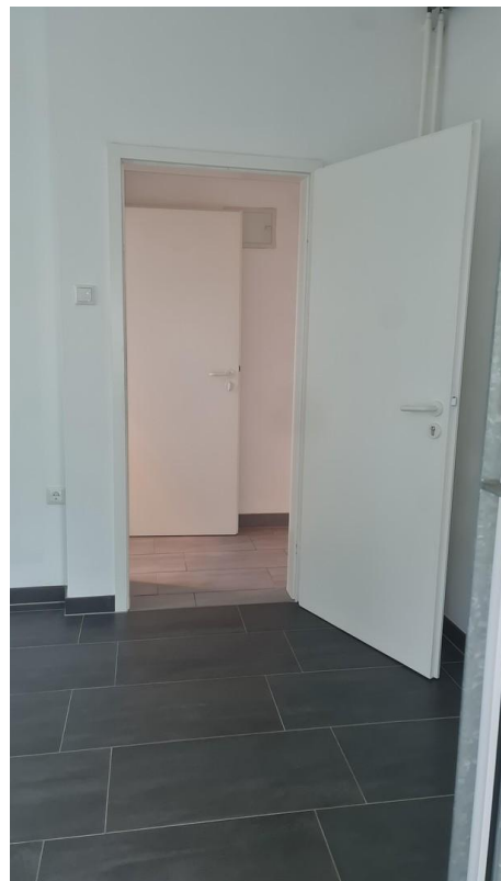
9m 2 -Zimmer (opt. Küche)