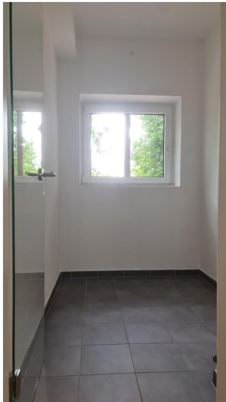
5m 2 -Zimmer