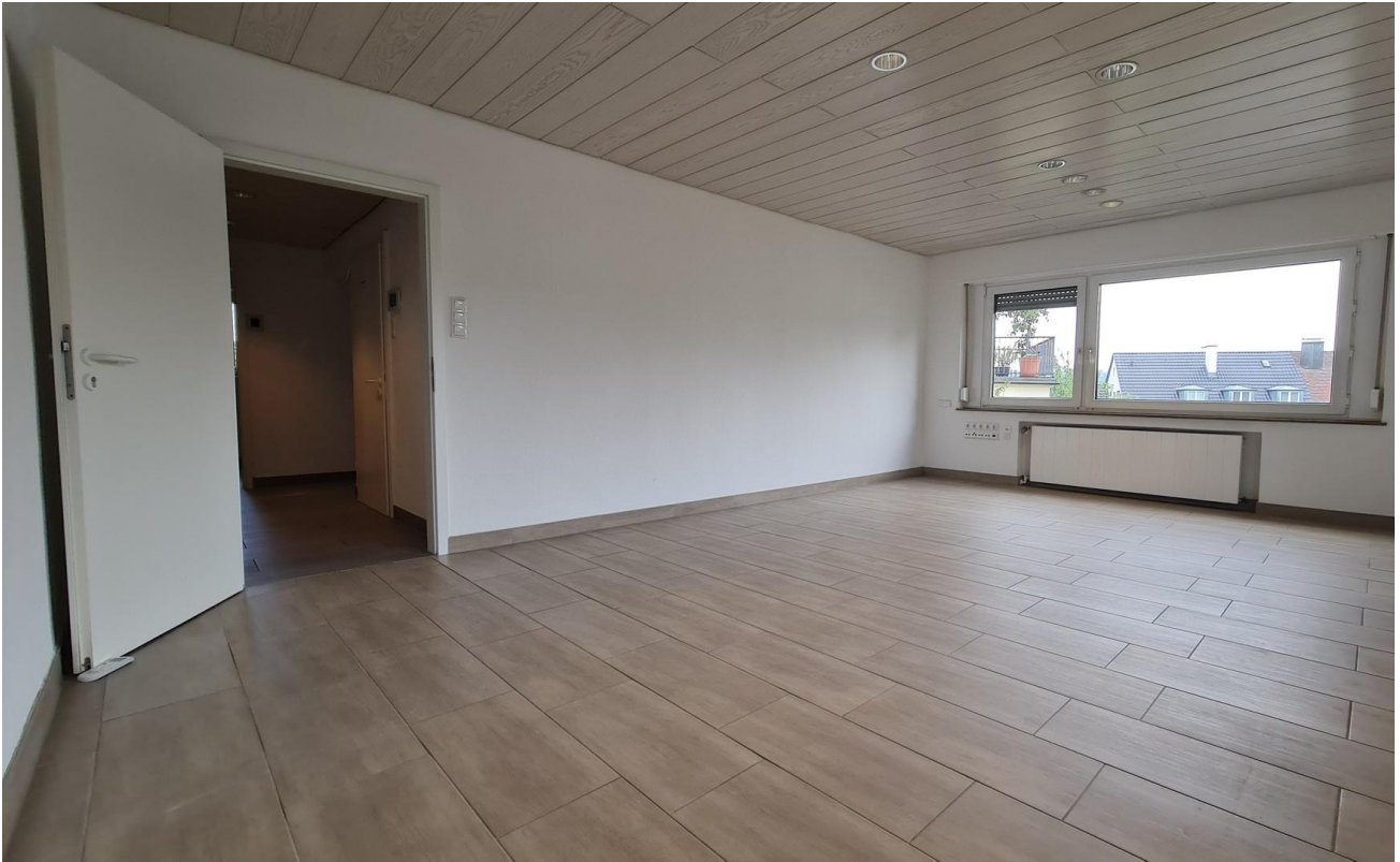
27m 2 -Zimmer