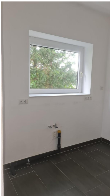
9m 2 -Zimmer (opt. Küche)