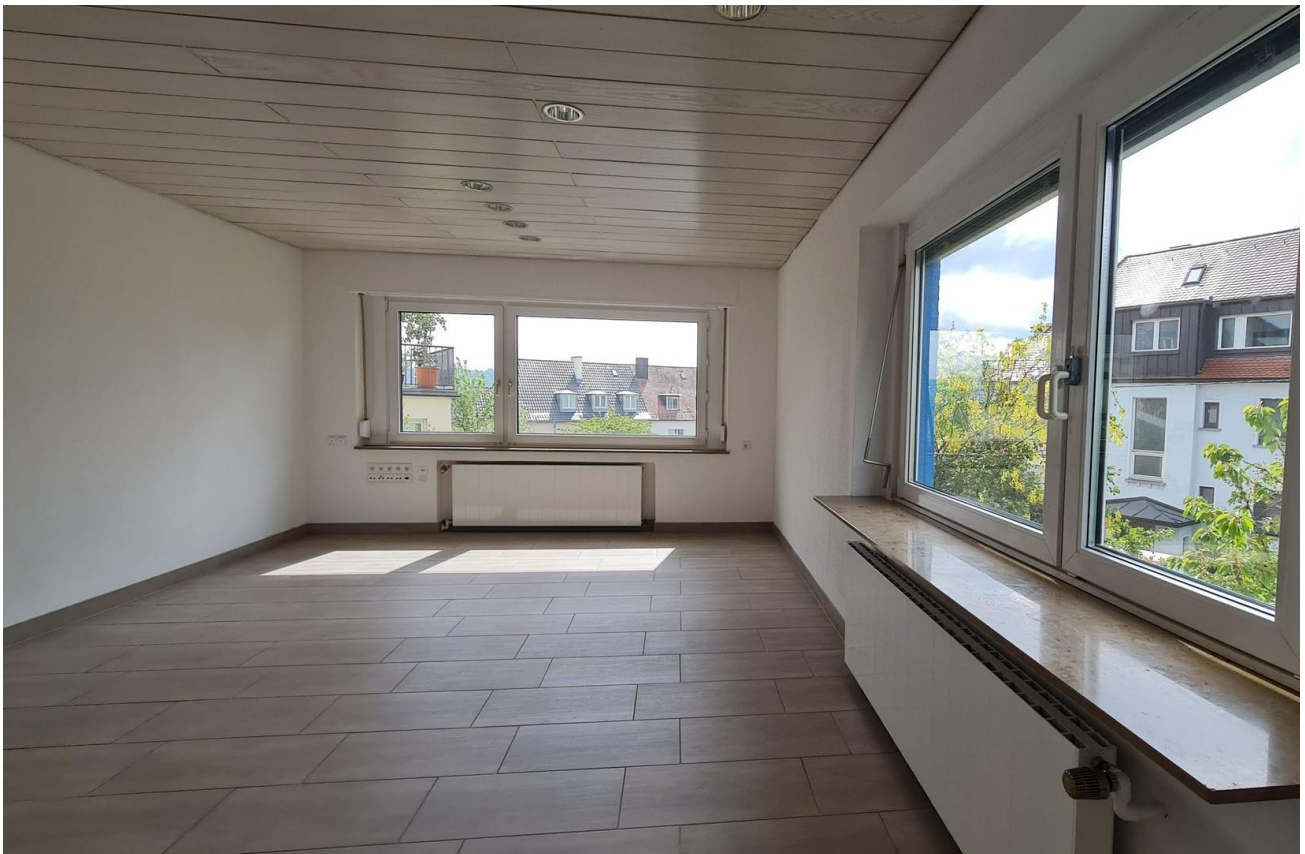
27m 2 -Zimmer