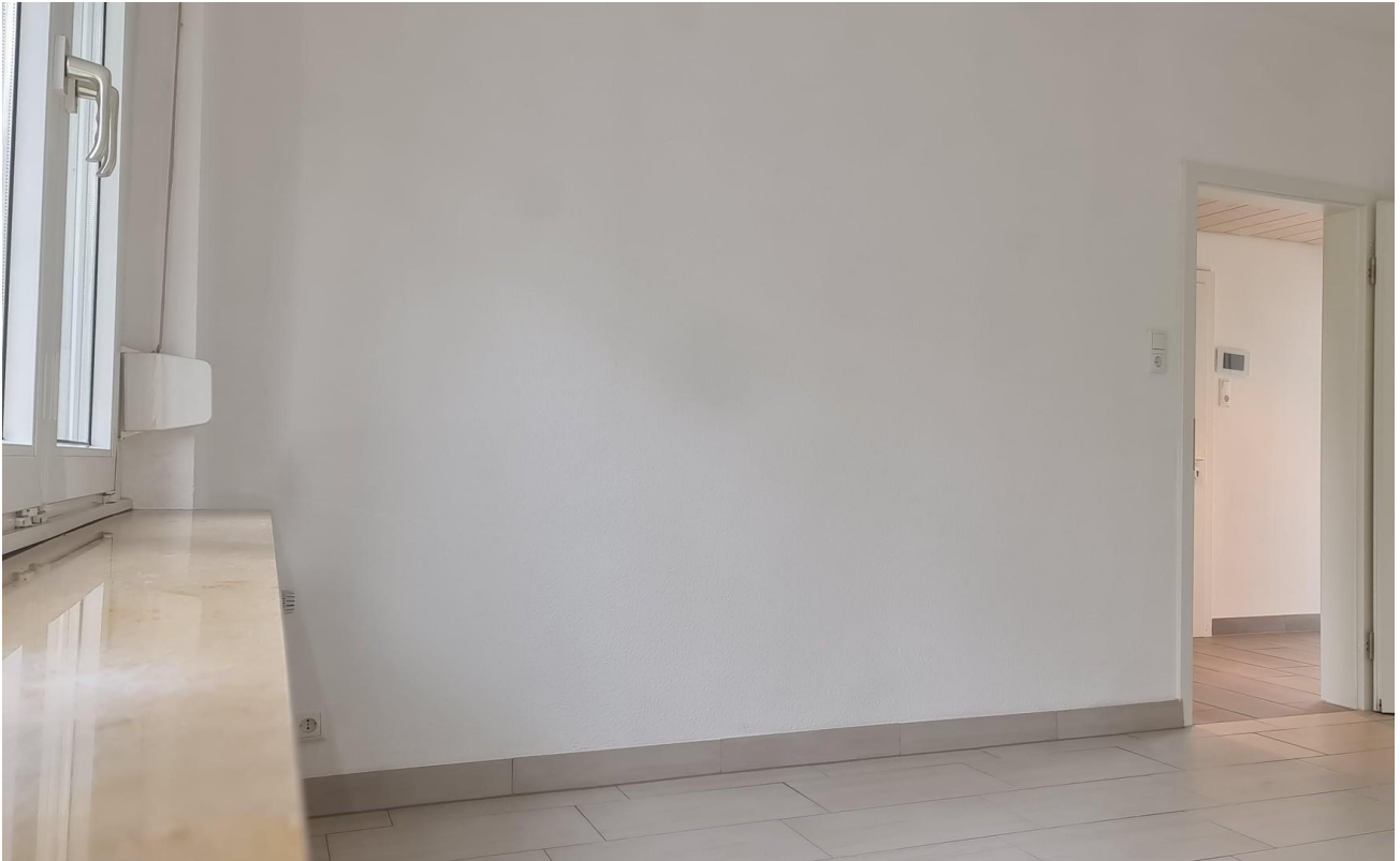
17m 2 -Zimmer