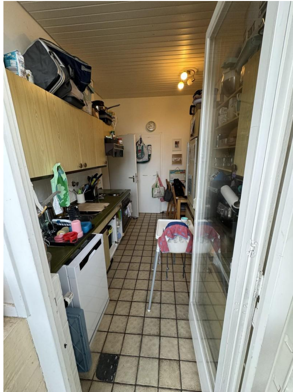
Blick vom Balkon in die Küche