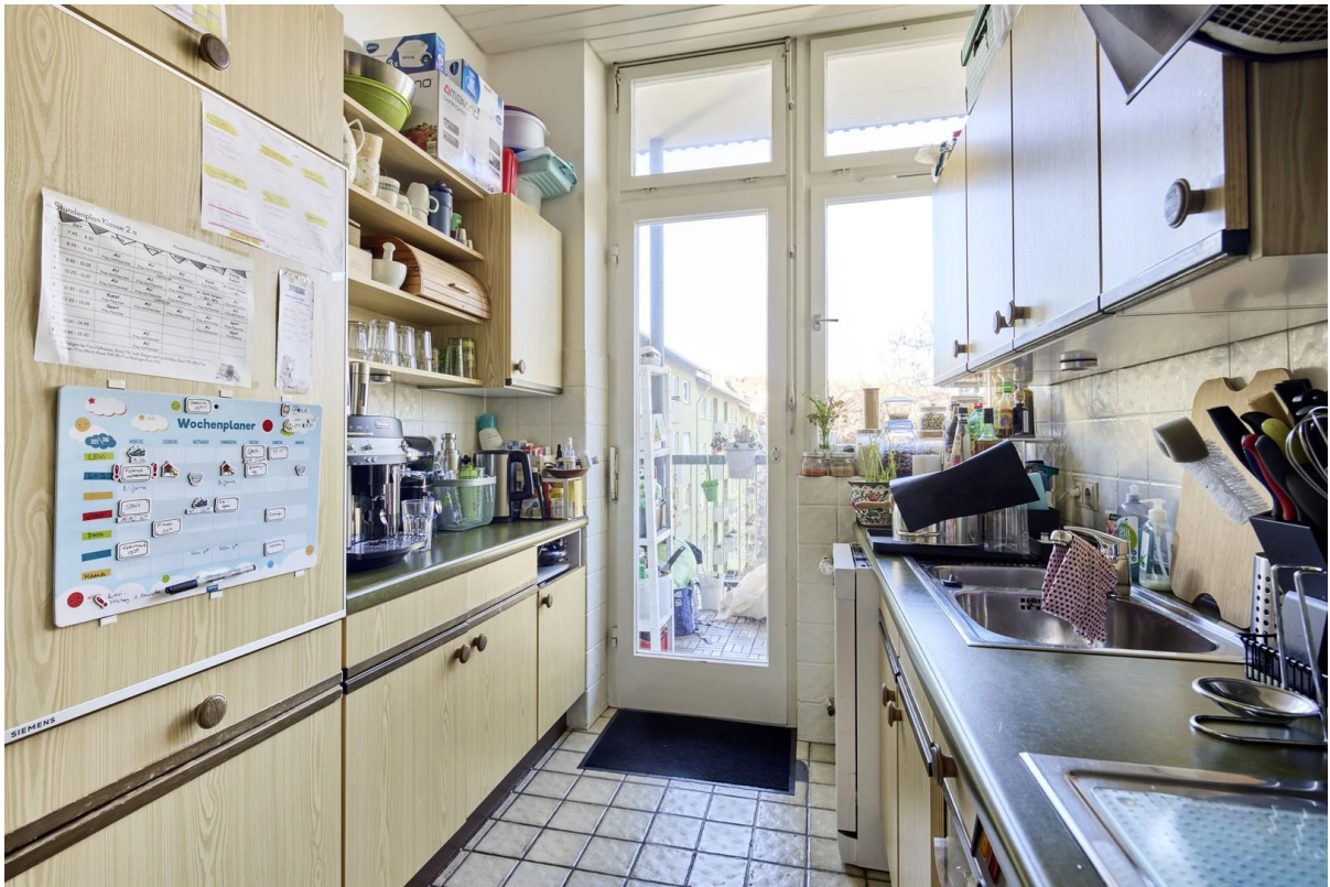
Küche mit Balkonzugang