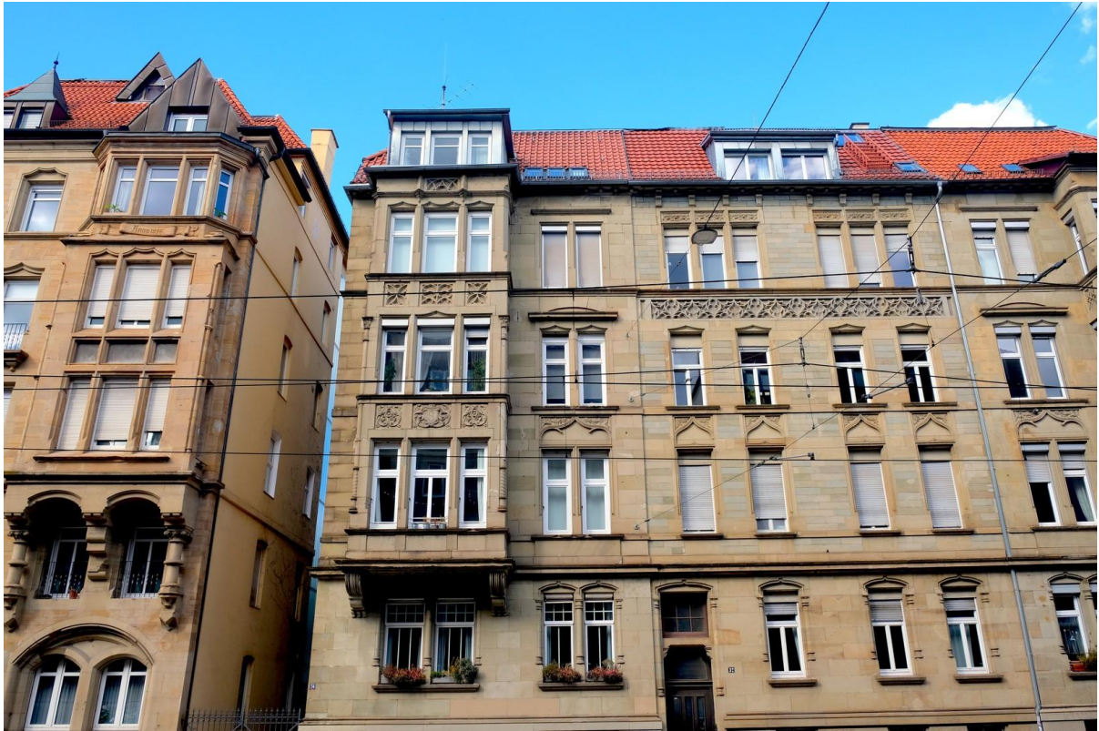
... toller Sandsteinfassade