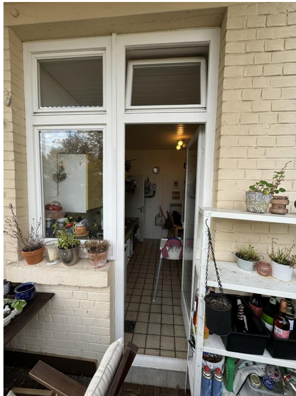
Blick vom Balkon in die Küche