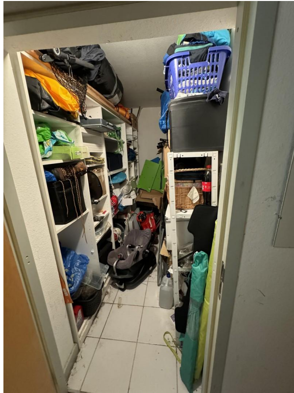
1. Geräumiger Kellerraum