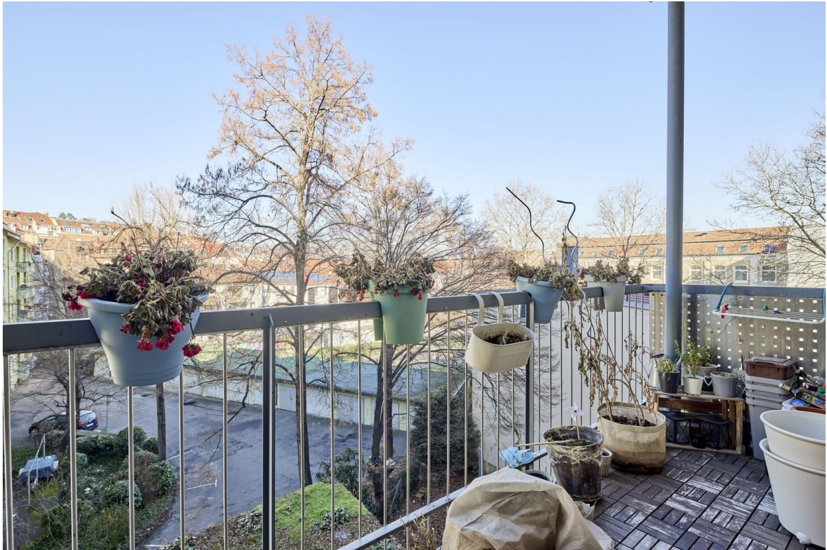
Großer Balkon mit Ausblick