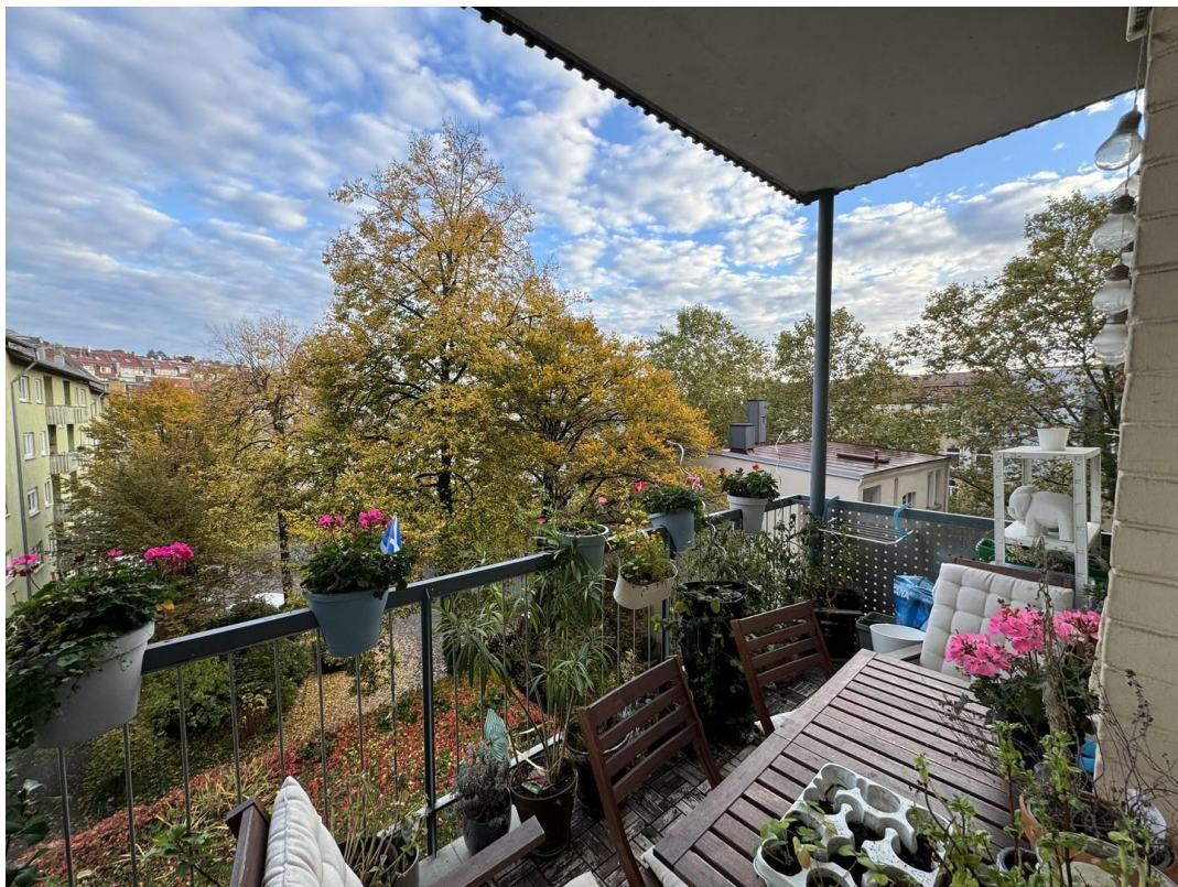
Balkon bei Herbst