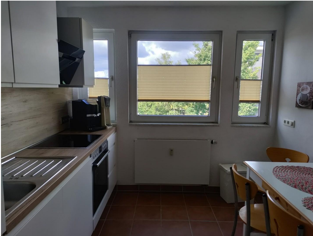
Fenster in der Küche