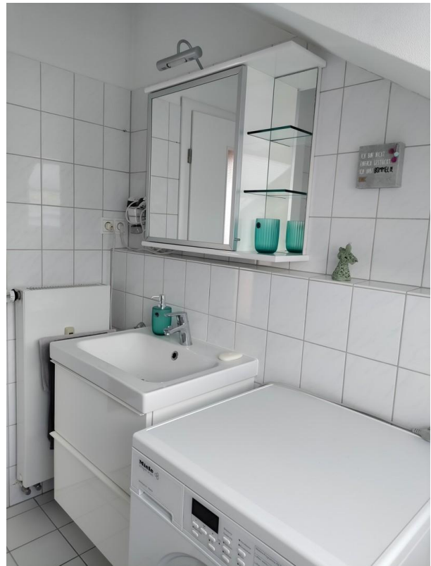
Waschtisch und Waschmaschine