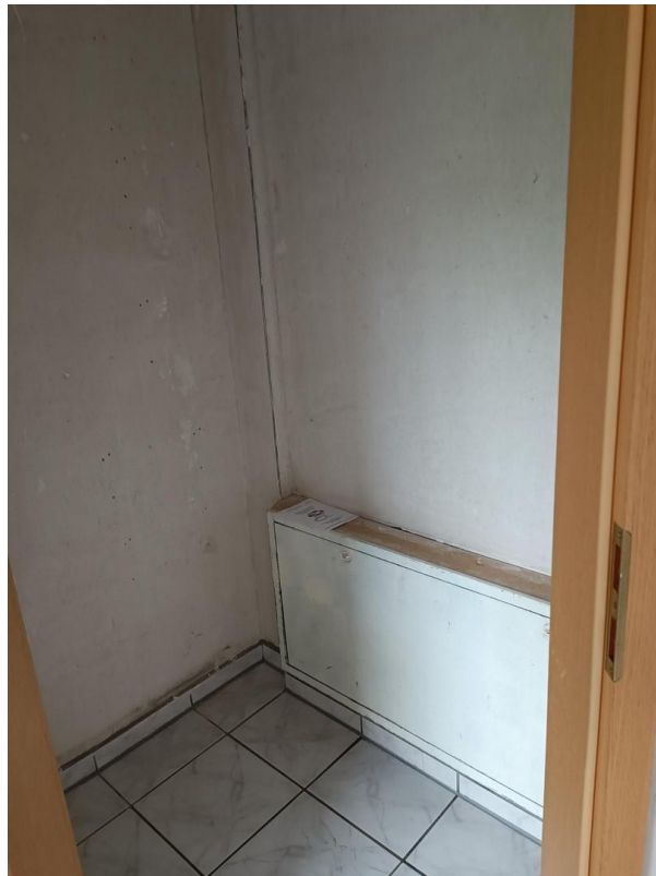
Abstellraum in der Küche