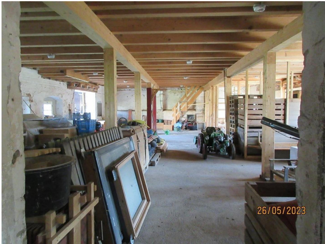
Hauptgebäude Stalltrakt 3