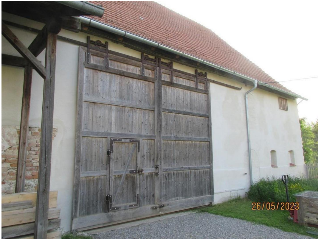
Kornstadel Einfahrt 1