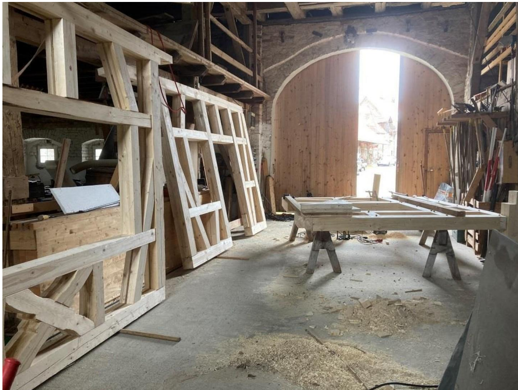
Kornstadel Einfahrt 1/ innen