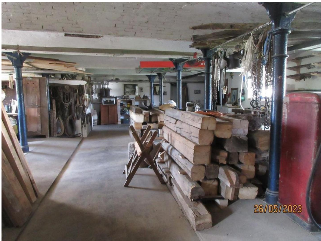
Hauptgebäude Stalltrakt 1