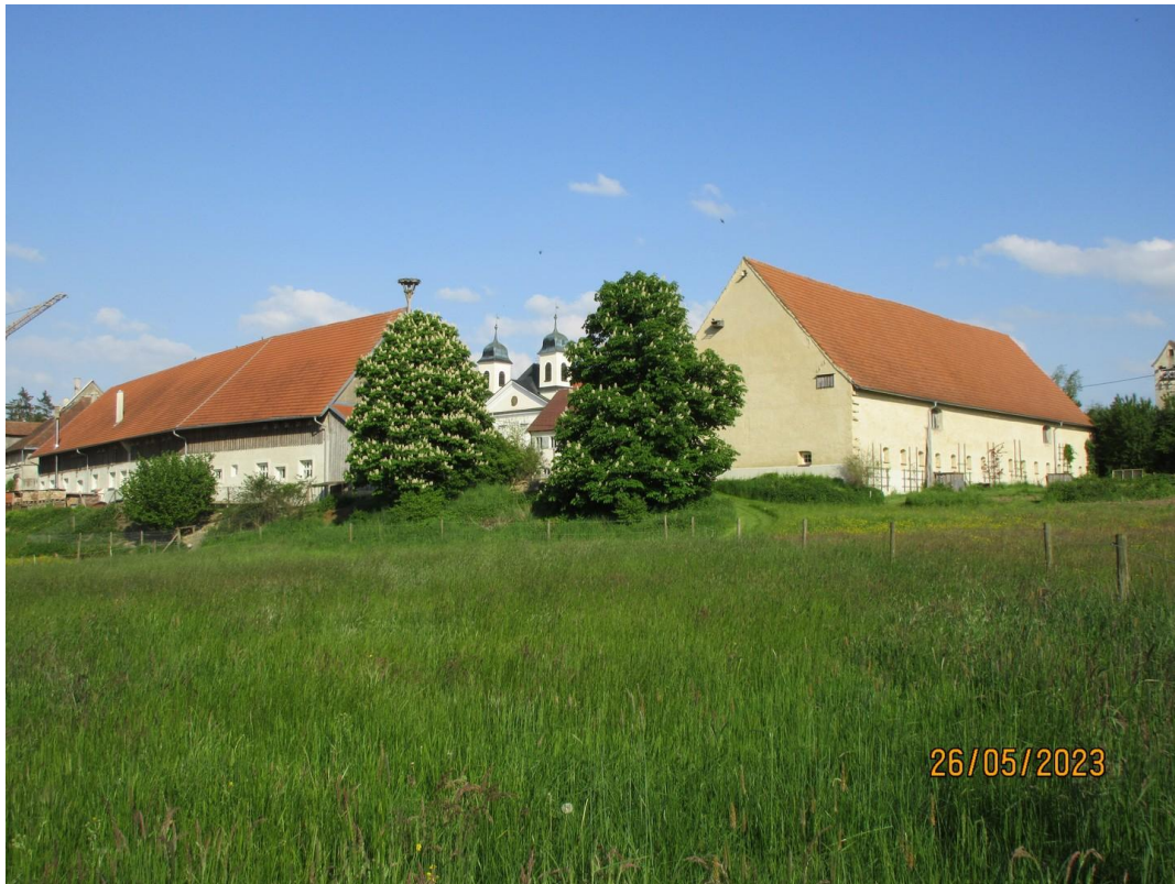
Hofstelle von Nordwesten