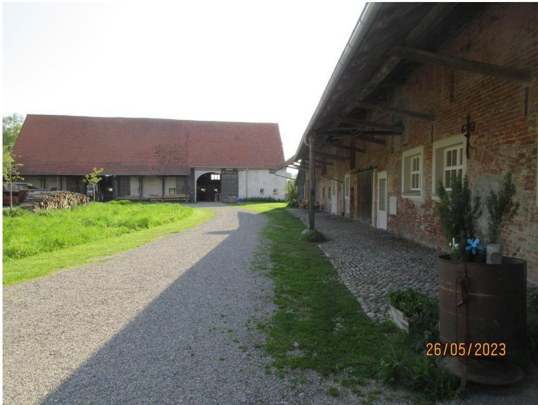
Hauptgebäude und Kornstadel