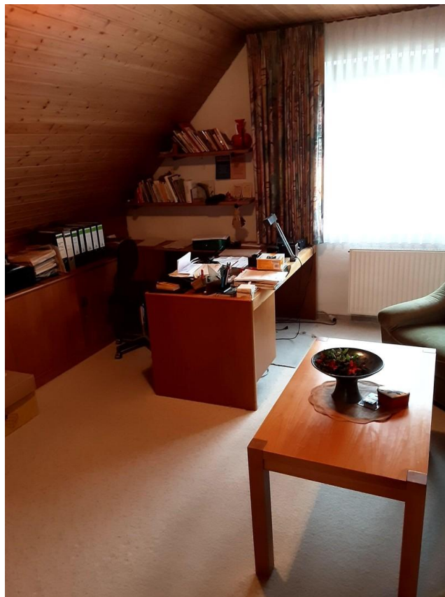
Kinderzimmer oben (jetzt Arbei