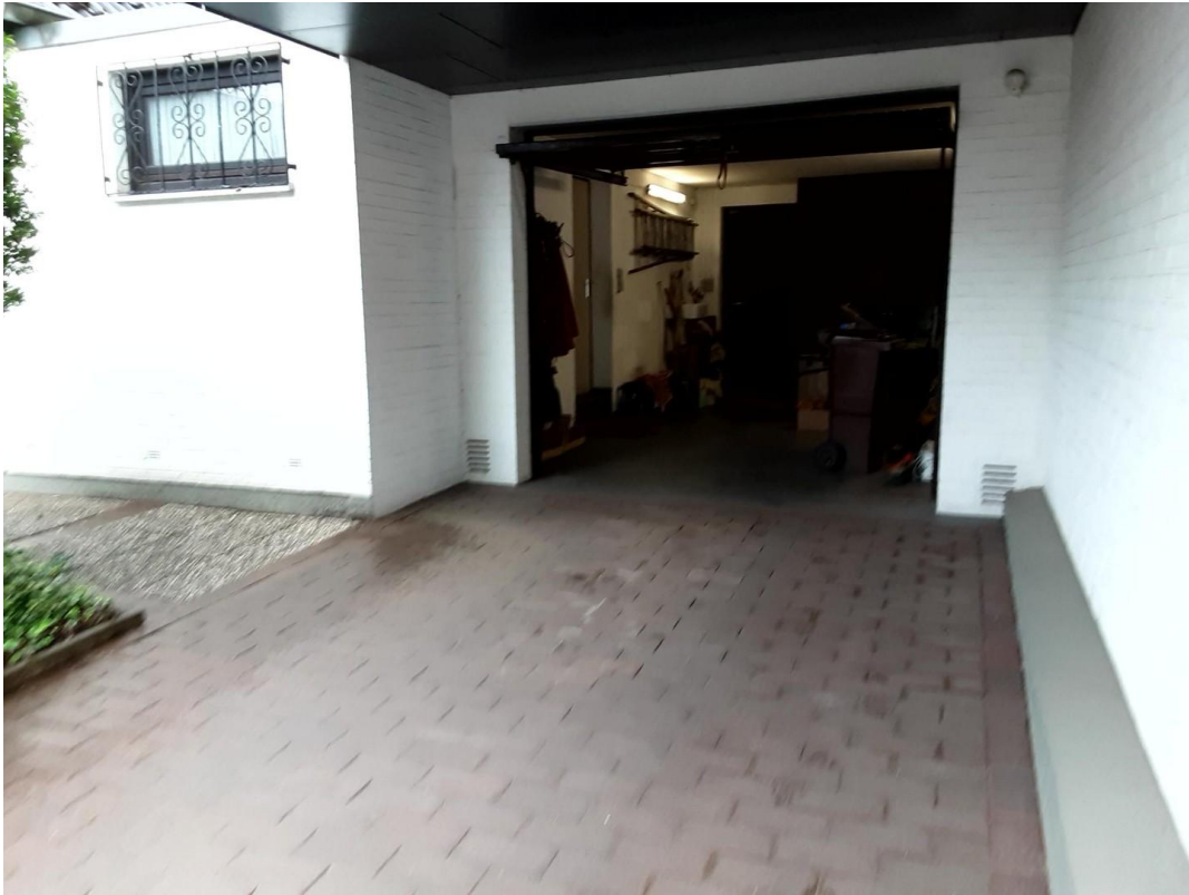
Überdachter Stellplatz mit Gar