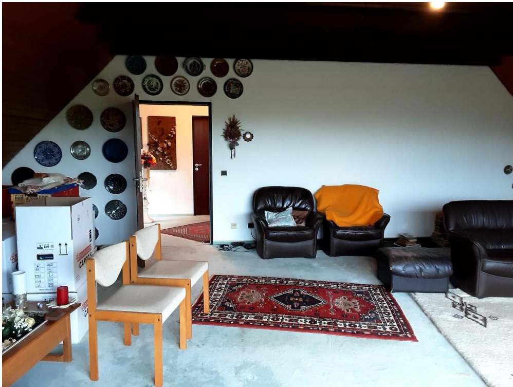
Wohnzimmer oben mit Sicht auf