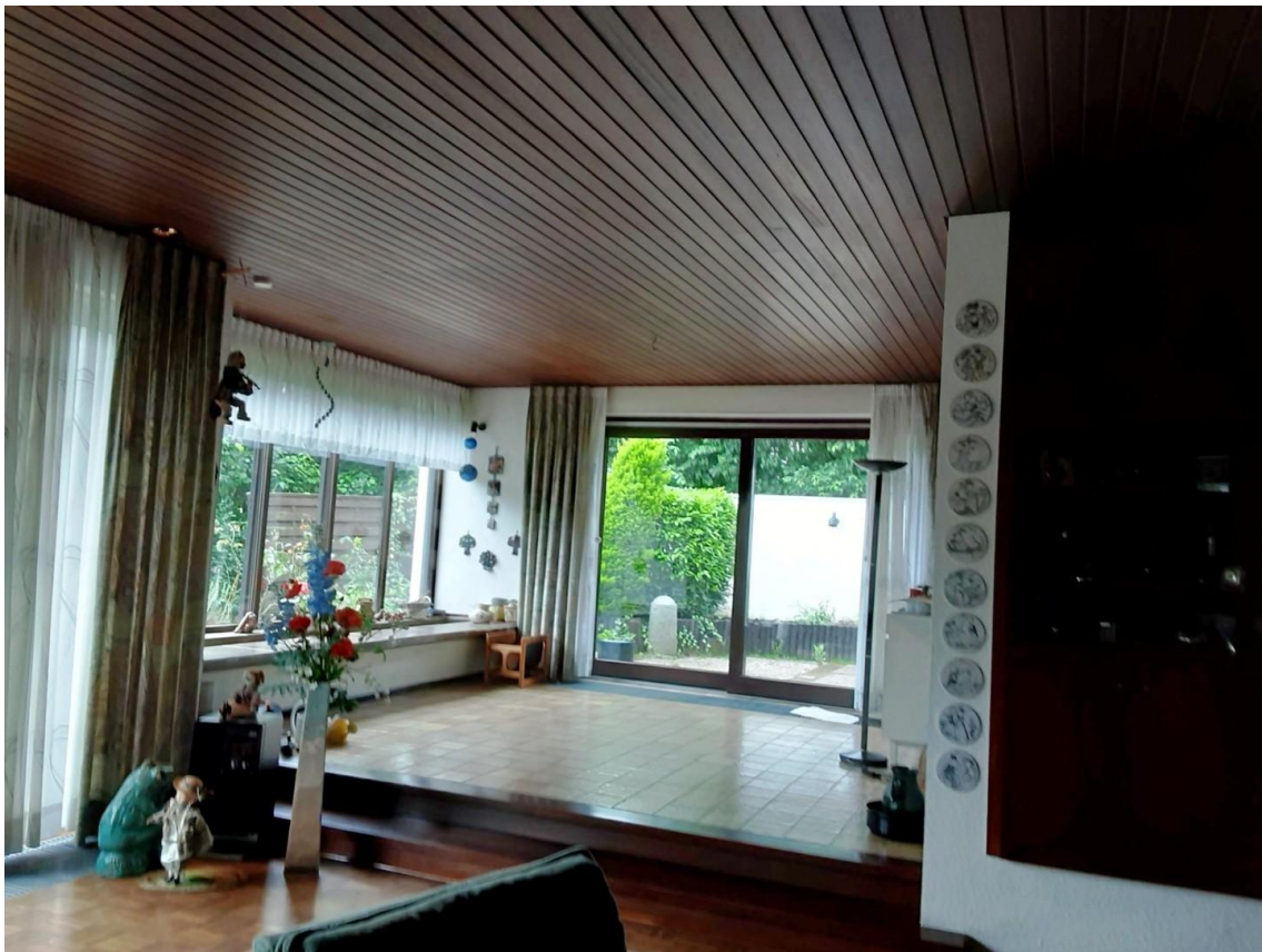
Blick vom Wohnbereich zum Eßbe