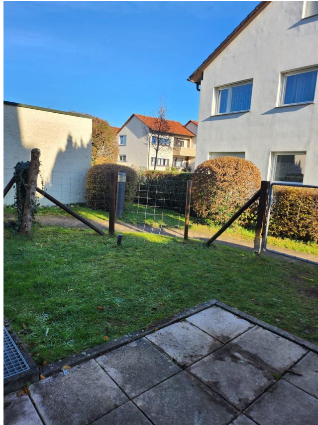
Terrasse und Garten