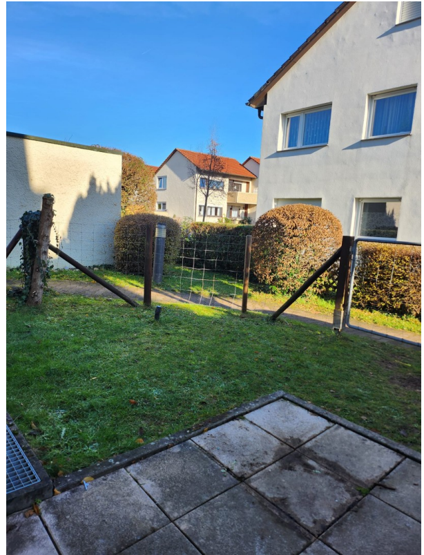
Terrasse und Garten