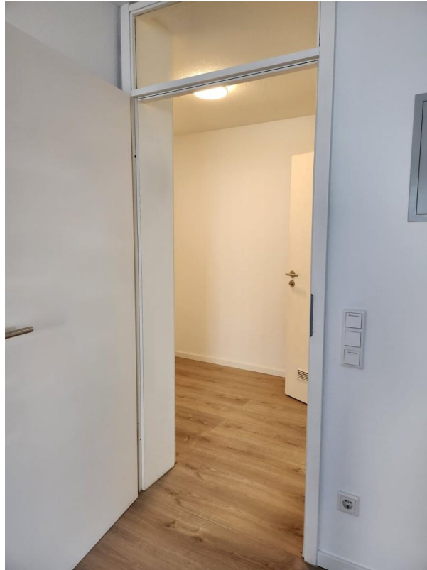
Eingangsbereich / Flur