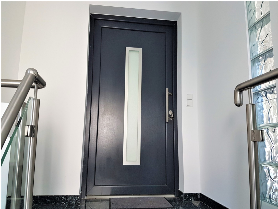
Tür zur Wohnung