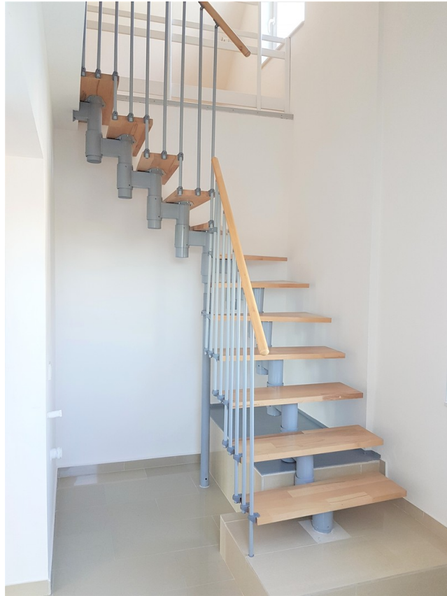
Treppe zum DG