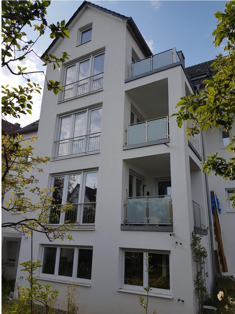
Ansicht vom Garten