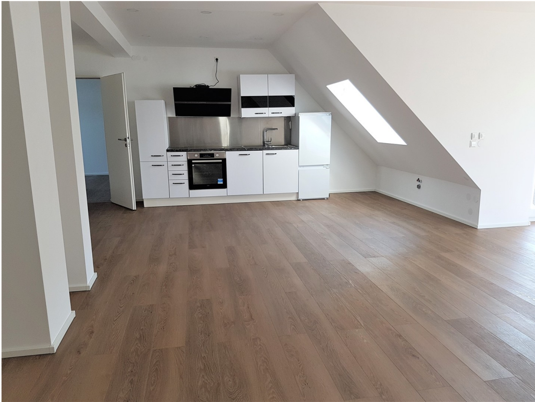
Wohn-/Essbereich mit Küche