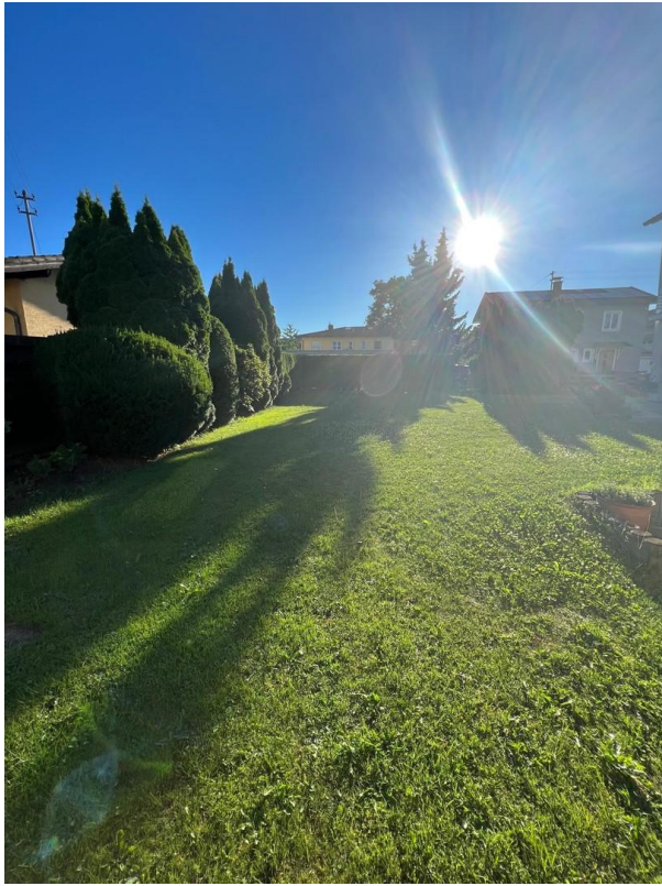
Ansicht Richtung Westen