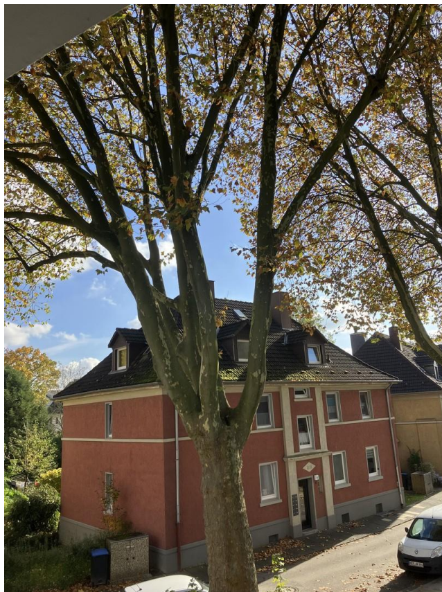
Blick aus Wohnzimmer