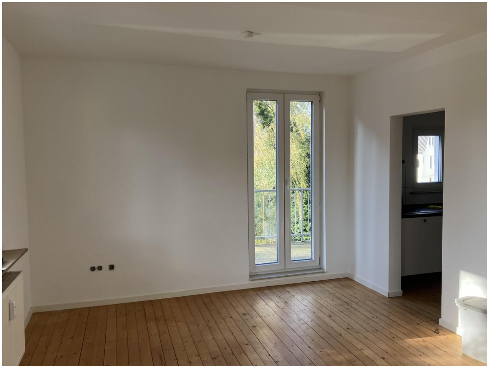
Wohnzimmer Zugang Balkon