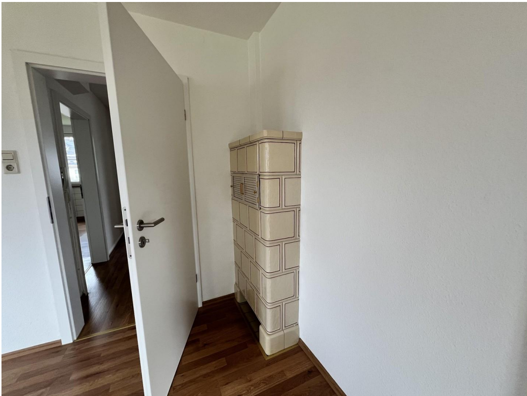
Zimmer 2 (Büro) mit Ofen