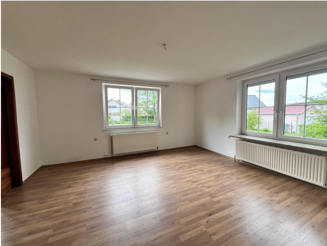
Zimmer 3 (Wohnraum)