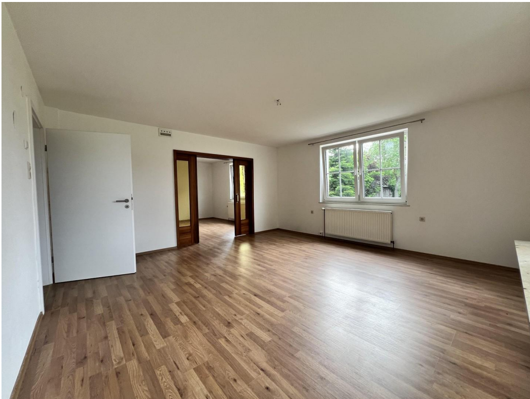
Zimmer 3 (Wohnraum)