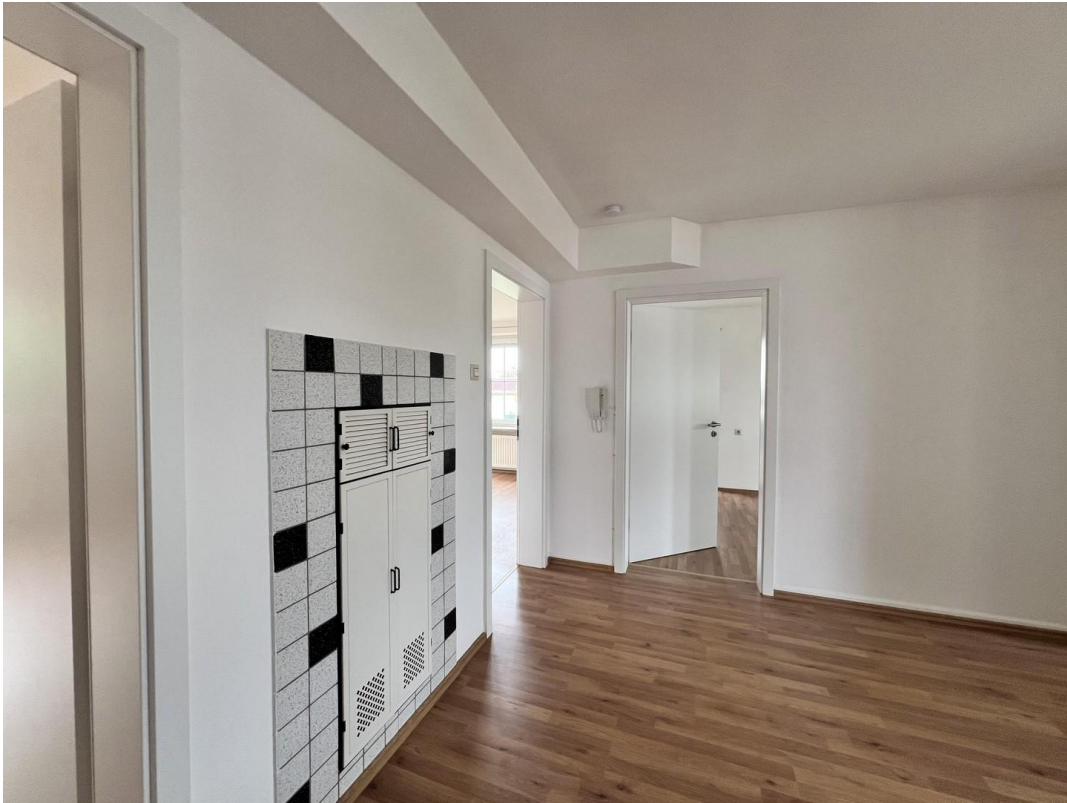
Eingang / Diele