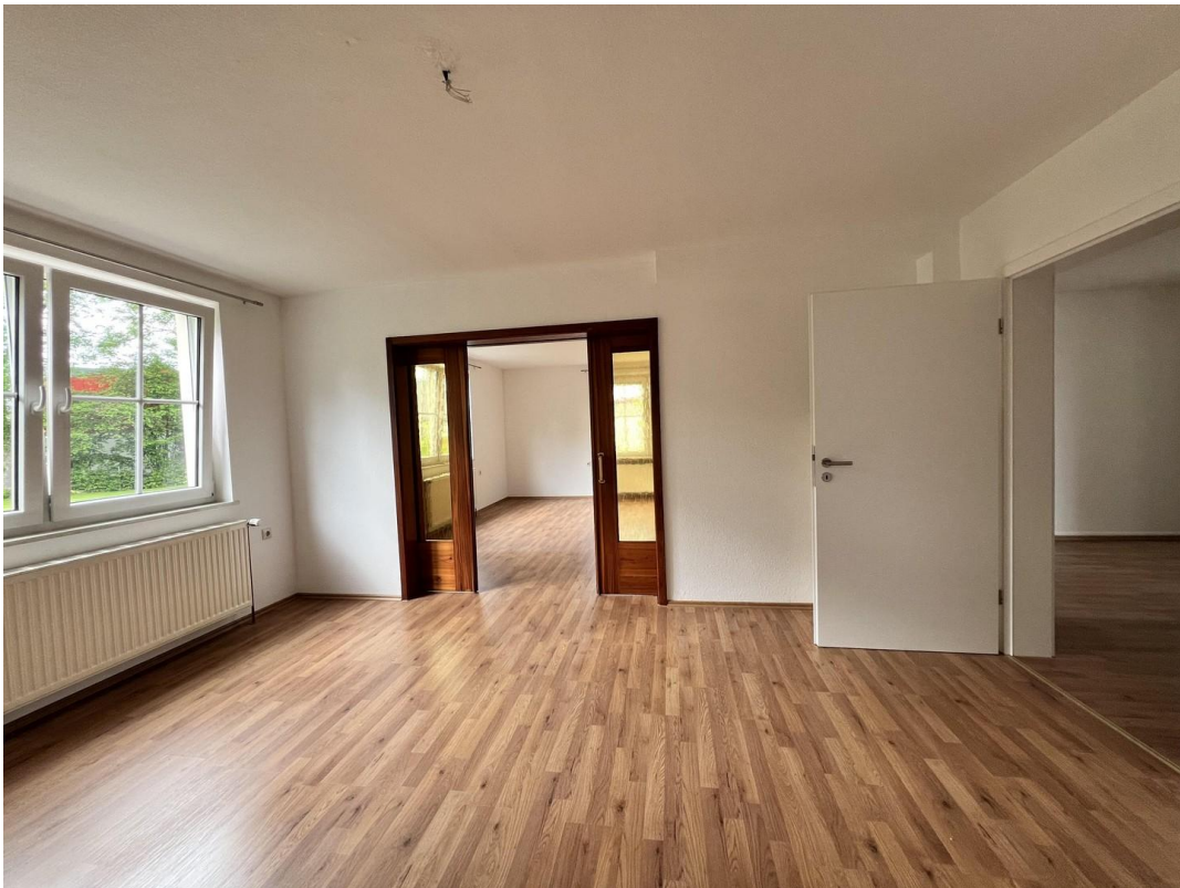
Zimmer 2 / Zugang zu Zimmer 3