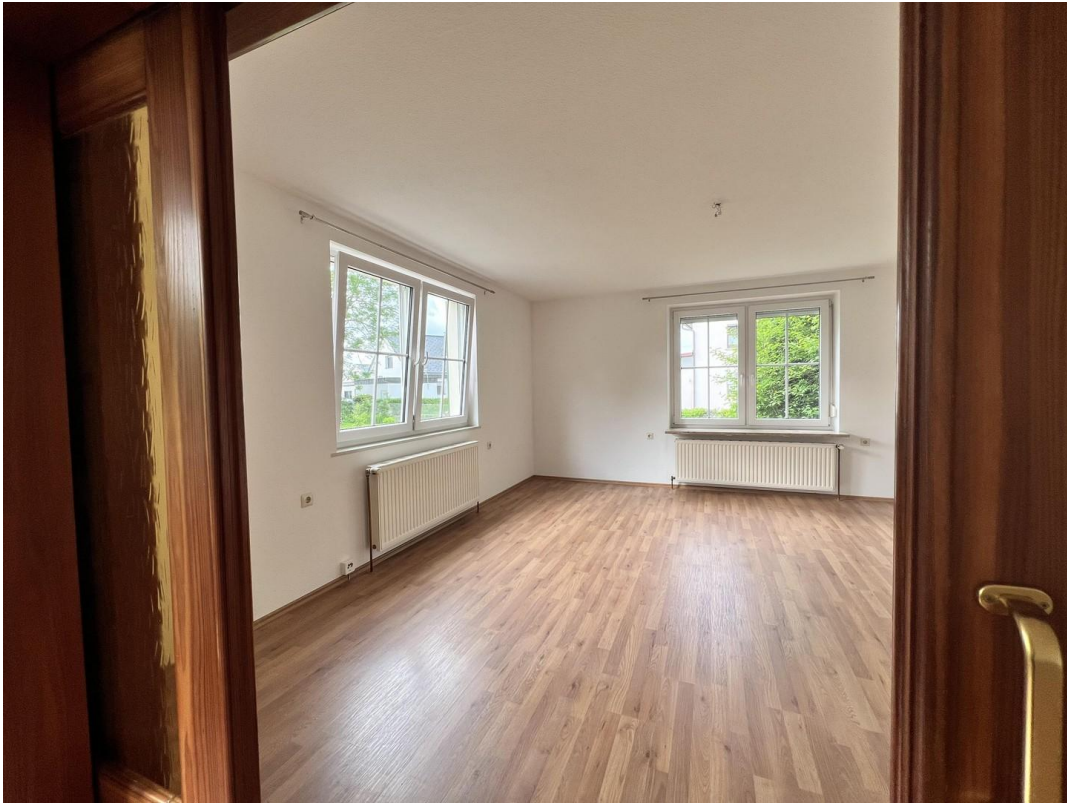
Zimmer 3 (Wohnraum)