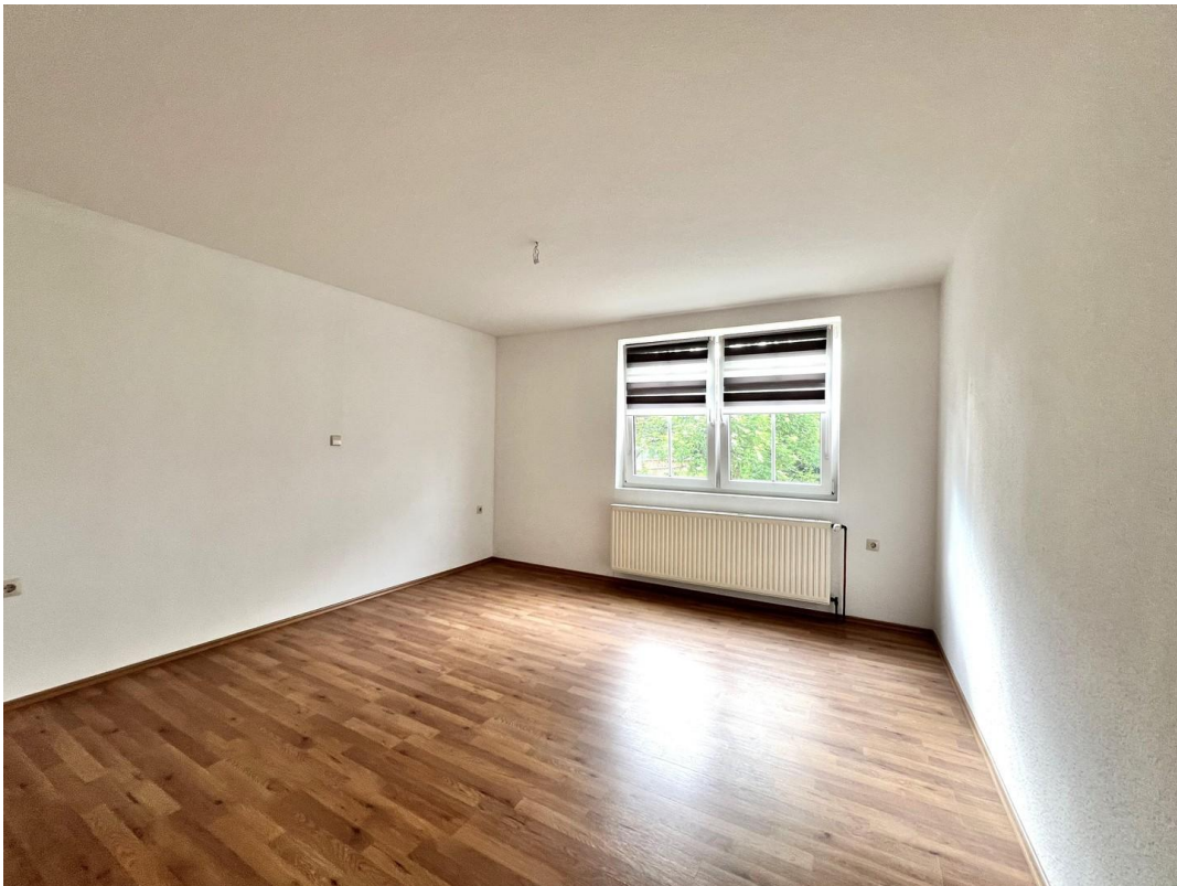
Zimmer 1 (Eltern)