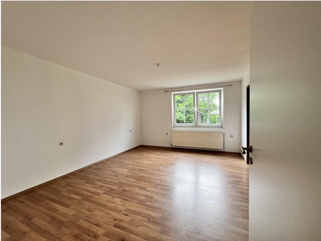
Zimmer 2 (Büro)