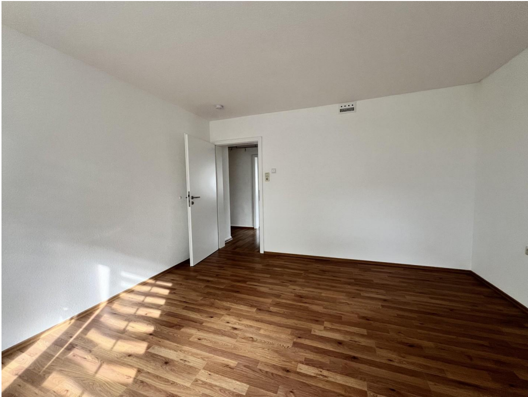
Zimmer 1 (Eltern)