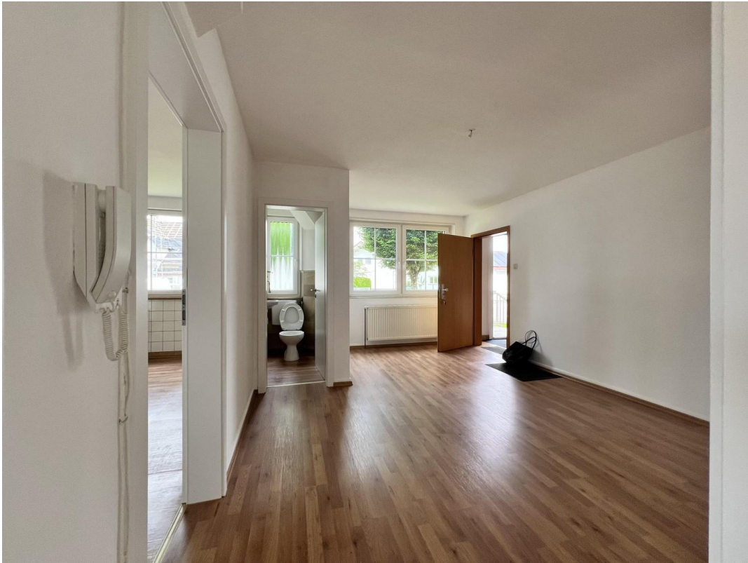
Eingang mit WC