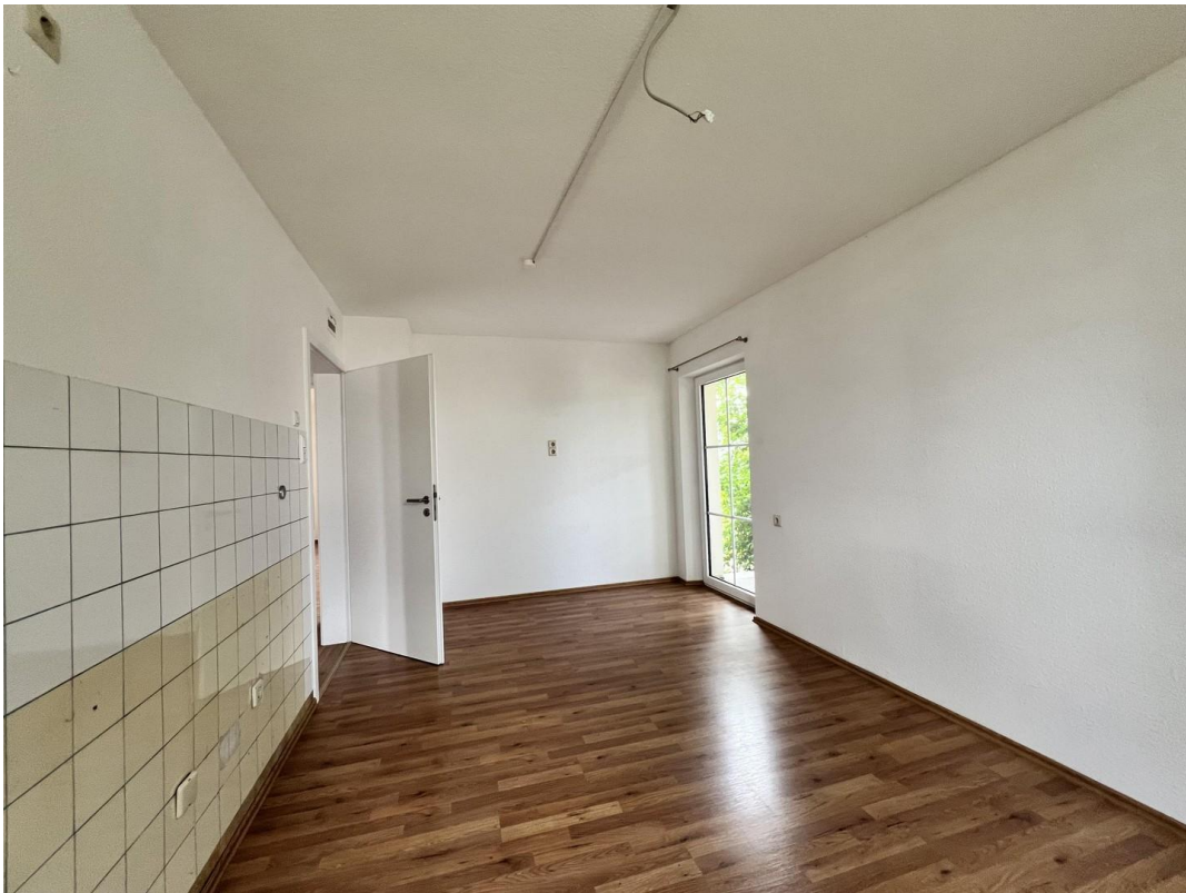
Küche mit Terrassenzugang