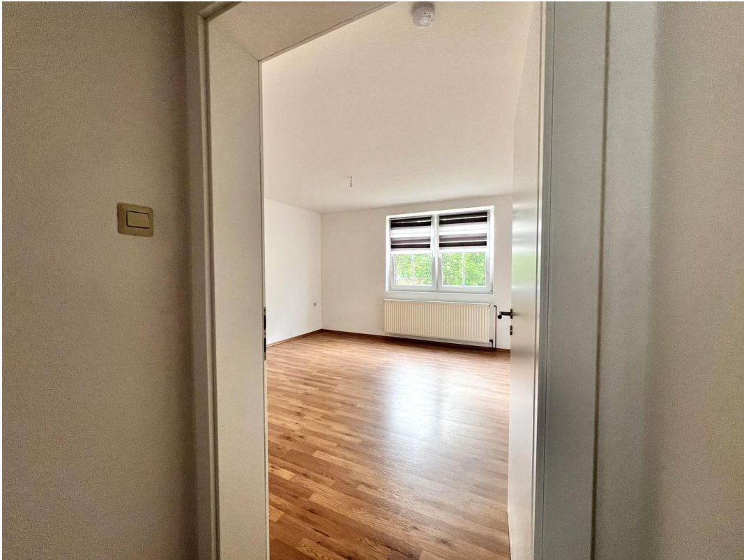
Zimmer 4 (Büro)