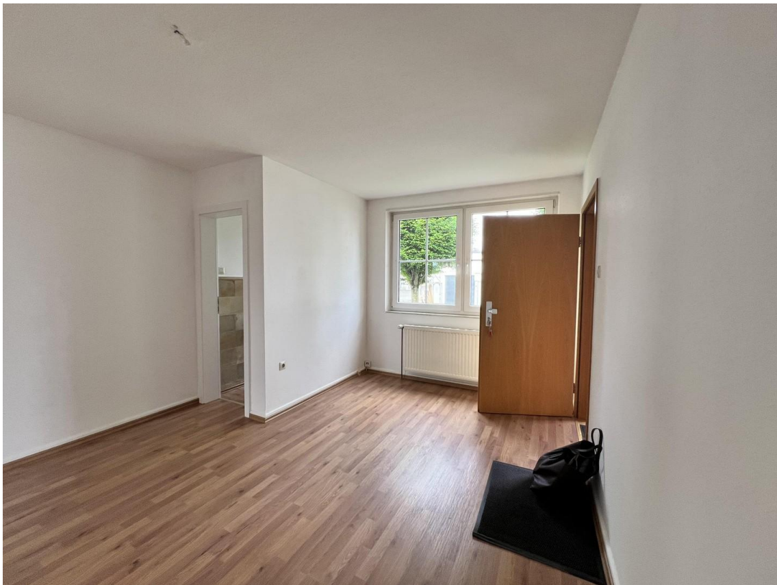
Eingang / Diele