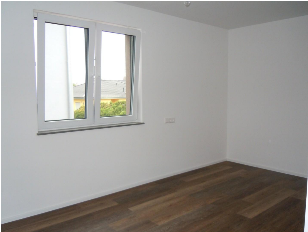
Eines von zwei Schlafzimmer