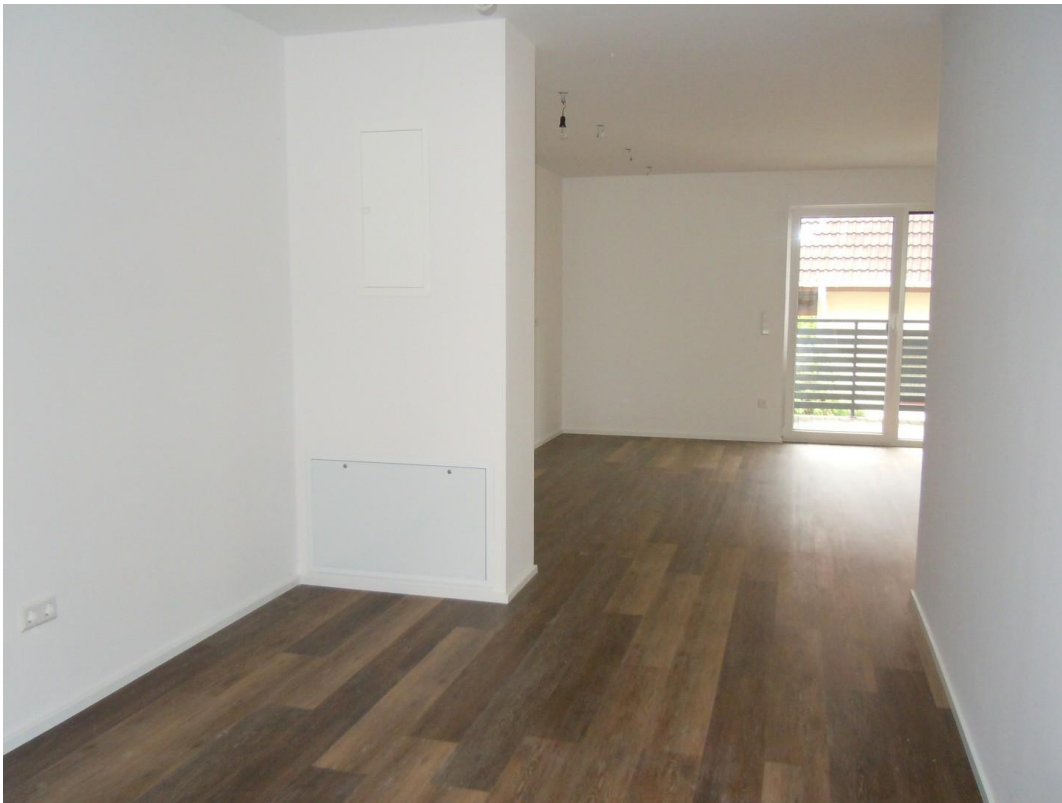
Sicht Flurbereich zum Wohnzim.