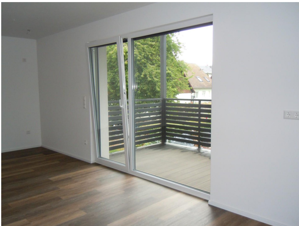
Zugang zu Balkon