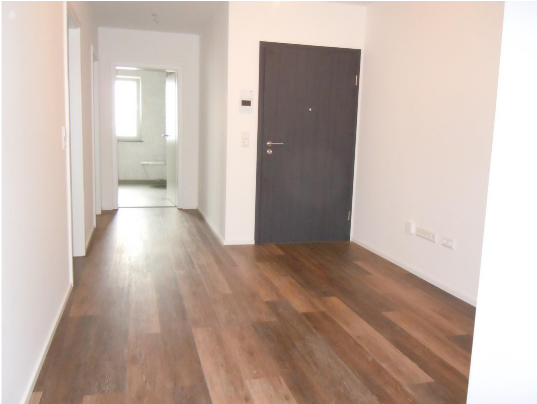
Sicht Flurbereich zum Bad