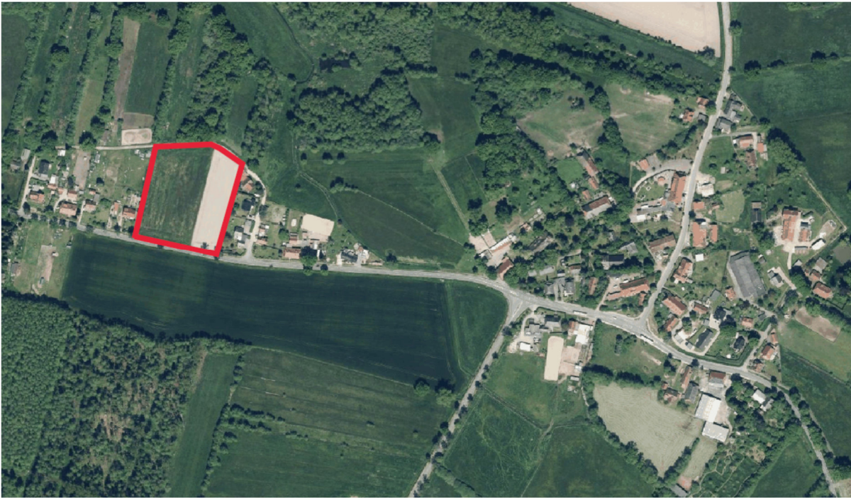
Luftbild aus dem Geoportal des Landkreises Lüneburg, Stand 2021

• Öffentliche Erschließung im Kaufpreis enthalten • Hausanschlüsse sowie Hausübergabeschächte und laufende Benutzungsgebühren für Ver- und Entsorgungsleitungen sind im Kaufpreis nicht enthalten.