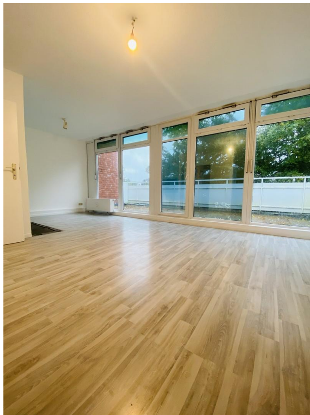
Wohnzimmer mit Dachterrasse