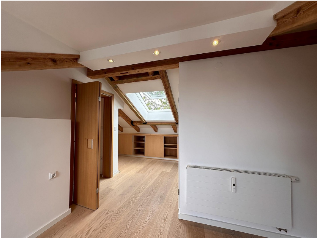
Arbeiten / Zimmer DG