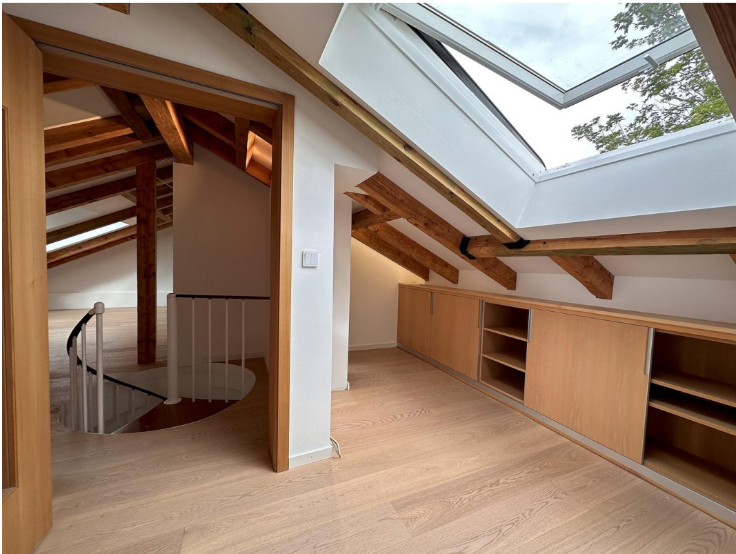
Arbeiten / Zimmer DG