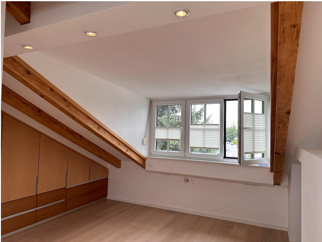
Arbeiten / Zimmer DG