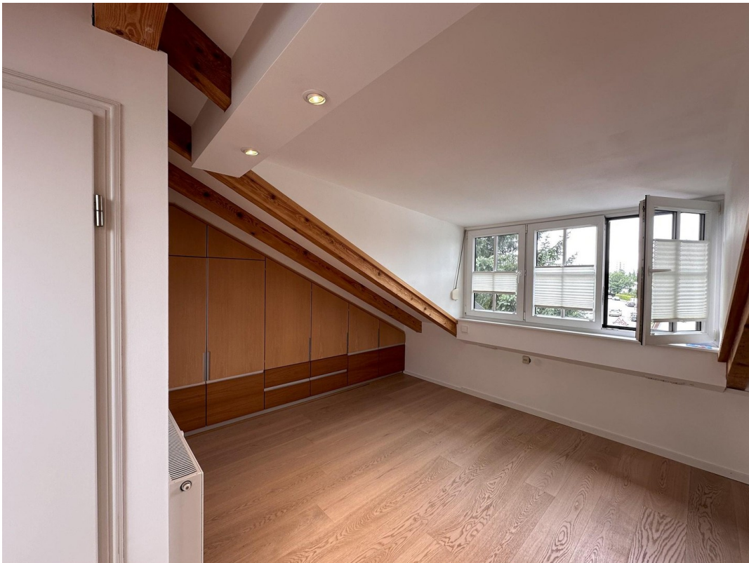
Arbeiten/ Zimmer DG