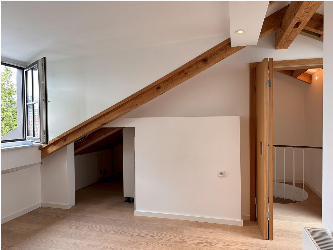
Arbeiten / Zimmer DG